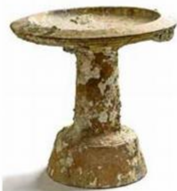
Grčki keramički brodski žrtvenik korintskog podrijetla, V. - IV. st. pr. Kr., otok Hvar, akvatorij Paklinskih otoka