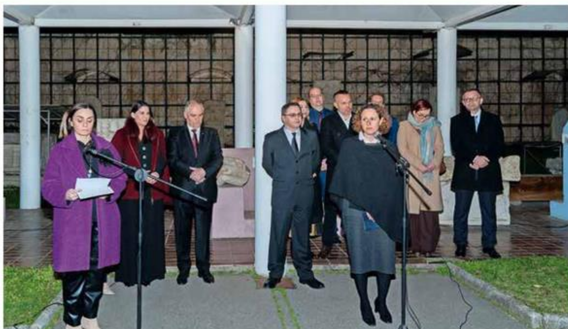
Pozdravni govor Nine Obuljen Koržinek, ministrice kulture i medija Republike Hrvatske, na otvaranju izložbe 'Vrhovi dubina' u lapidariju Arheološkog muzeja u Zagrebu