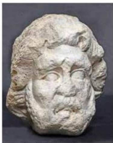
Glava rimskog božanstva (Jupitera ili Neptuna), II. st. posl. Kr., Vranjic