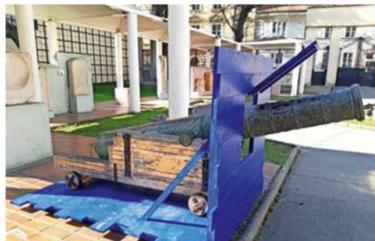
Brončani brodski top (godina lijevanja: Ante quem 1528., lokalitet: Pličina Pupak, Palagruža) iz Komiže postavljen u lapidariju Arheološkog muzeja u Zagrebu u okviru izložbe 'Vrhovi dubina'

Izložba "Vrhovi dubina - Podvodna baština Splitsko-dalmatinske županije" otvorena je u Arheološkom muzeju u Zagrebu do 3. lipnja 2026..