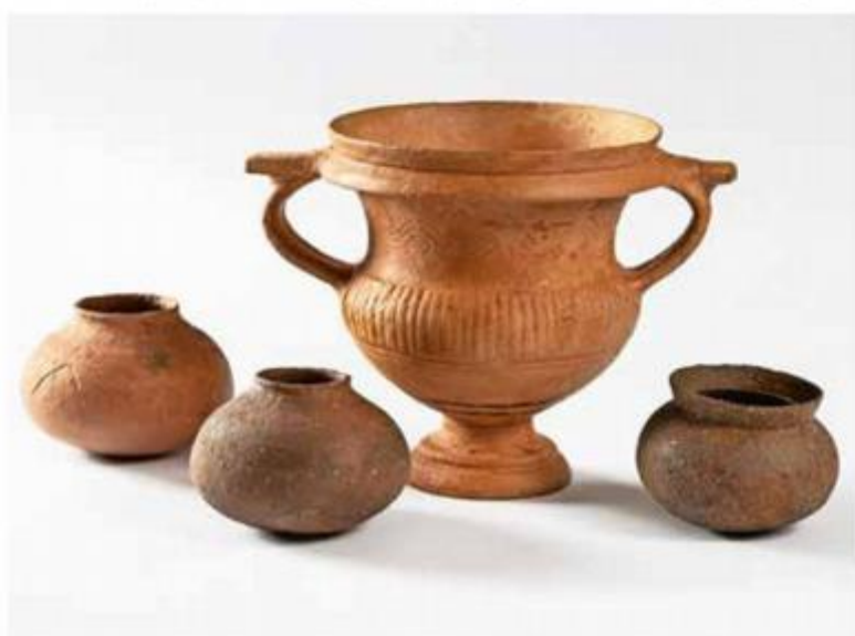
Nalazi helenističke keramike u uvali Gnijlana na otoku Visu, IV. - III. st. pr. Kr.