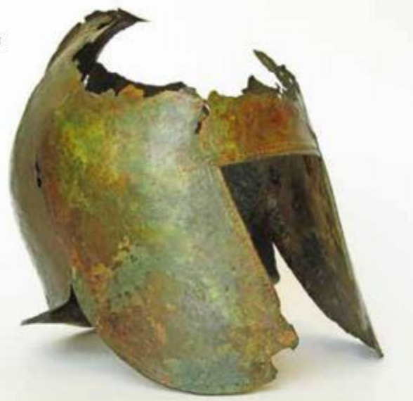
Brončana vojnička kaciga ilirskog tipa, V. - IV. st. pr. Kr., otok Hvar, akvatorij Sućurja

svojevrsan vrhunac zadane tematike i izložbu 'Vrhovi dubina'."