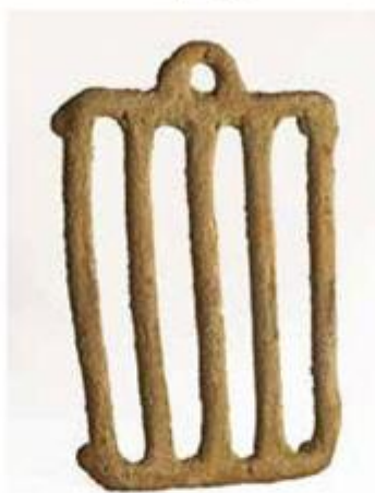
Keramičke gradele, I. - II. st. posl. Kr., Makarsko primorje, akvatorij Drvenika

Radić , jedan od autorskog trojca koncepta "Vrhovi dubina".