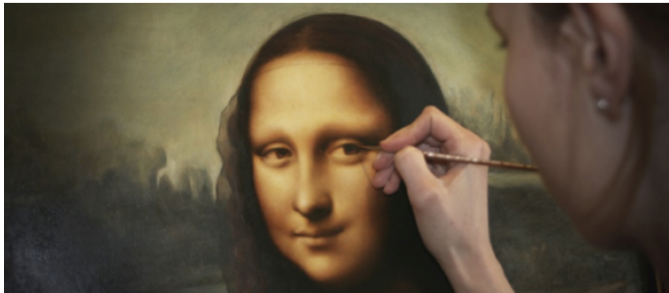
Izrada kopije Mona Lise