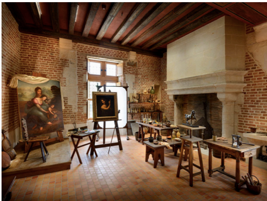
Château of Clos Lucé – Atelje Leonarda da Vinci

Godišnjicu Leonardove smrti obilježiti će i tematska izložba, koja će se održati u jesen 2019. godine u prostoru Muzeja. Na izložbi će svi polaznici radionice imati priliku izložiti svoje radove i sudjelovati u katalogu izložbe , a njezin je cilj, pored ostalog, dočarati izgled Leonardovog ateljea u njegovom posljednjem prebivalištu u Château du Clos Lucé, u blizini Amboisea.