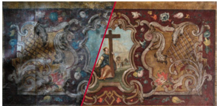
o. Hvar, Hvar, franjevački samostan Gospe od Milosti Glavni oltar Sv. Križa, antependij, 17. stoljeće

Prateći počela suvremenih kulturnih politika, djelatnost Zavoda razvija se prema novim oblicima i načinima zaštite kulturnih dobara. No unatoč promjenama, trajna će vrlina djelatnosti ostati ista - u najboljem znanju i umijeću sačuvati našu jedinstvenu baštinu neprocjenjive vrijednosti.