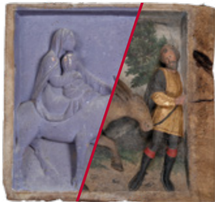
Mutvoran, župna crkva sv. Marije Magdalene Glavni oltar istog patrocinija, predela (1533.)