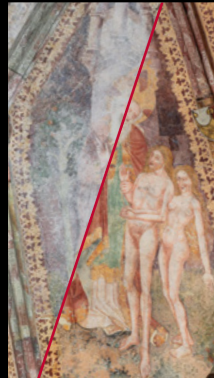
Pazin, župna crkva sv. Nikole Svod svetišta (oko 1470.)