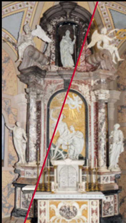
Varaždinske Toplice, župna crkva sv. Martina biskupa Francesco Robba, oltar sv. Katarine, 18. stoljeće