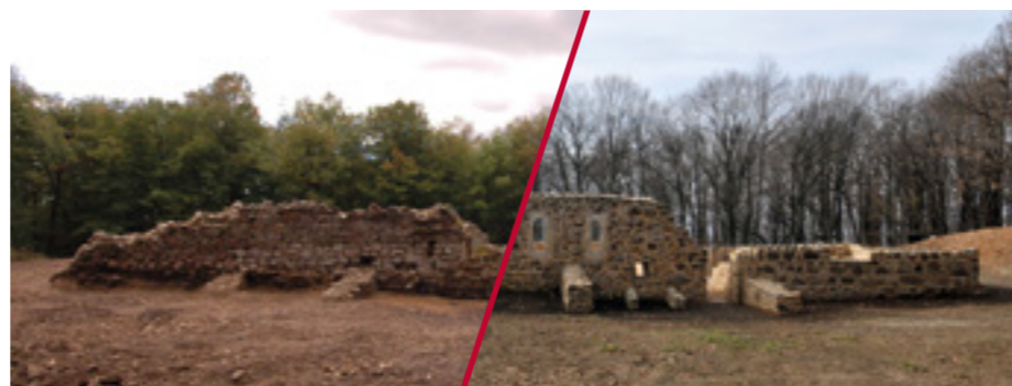
Petrova gora (Petrovac) Ruševine pavlinskog samostana sv. Petra

Od utemeljenja Zavoda do danas djelatnost se proširila na sve vrste umjetnina, spomenika i arheoloških nalaza. Primjenjujući visoke standarde stručne djelatnosti, razvijajući nove metode i tehnike rada te njegujući sustav prijensa znanja, iskustava, vještina i kompetencija, Zavod je jedan od glavnih nositelja suvremene prakse zaštite i očuvanja kulturne baštine u Hrvatskoj. Usklađenost sa srodnim europskim ustanovama i svjetskim iskustvima postignuta je i zahvaljujući interdisciplinarnom pristupu zaštiti kulturnih dobara te različitim zanimanjima i specijalizacijama njegovih djelatnika.