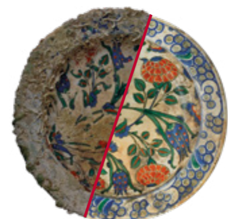
o. Mijet, pličina Sveti Pavao Iznička keramika

Dosadašnju djelatnost Zavoda prate brojne nagrade za uspješno provedene projekte, među kojima valja izdvojiti nekoliko dobivenih Nagrada Vicko Andrić te nagrada Europske unije za kulturnu baštinu (Nagrada Europa Nostra ).