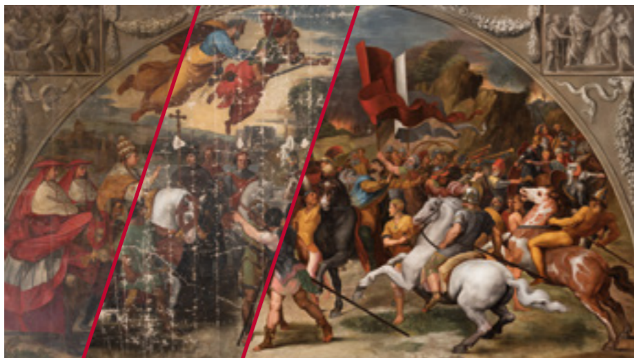
Zagreb, Strossmayerova galerija starih majstora HAZU Carlo Maratti (pripisano) / kopija prema Rafaelu, Susret pape Lava I. Velikog s Atilom , 18. stoljeće