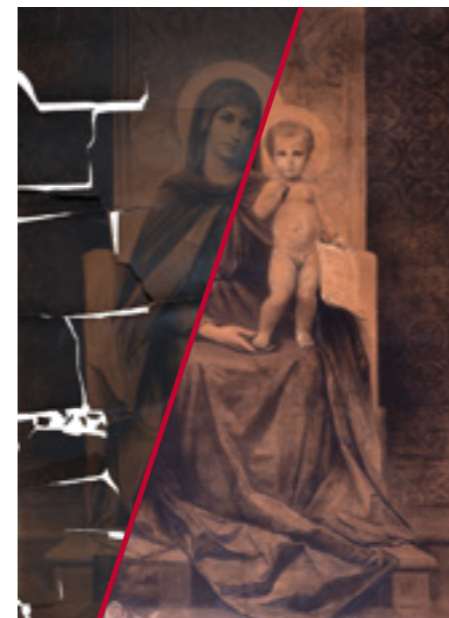
Našice, Zavičajni muzej Našice Izidor Kršnjavi, Bogorodica s Djetetom (1877.)