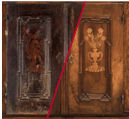
Pazin, župna crkva sv. Nikole Sakristijski ormar (1737.)

kao dviju javnih ustanova konzervatorsko-restauratorskih djelatnosti u vlasništvu Republike Hrvatske. Uz odjele u Splitu, Vodnjanu i Ludbregu, koji su Zavodu priključeni na početku, 1997. godine, postupno su se pridruživali i odjeli u Dubrovniku i Osijeku (1999.) te Rijeci (2005.) i Zadru (2006.), čime je prvi put objedinjena restauratorska služba na području cijele Hrvatske.