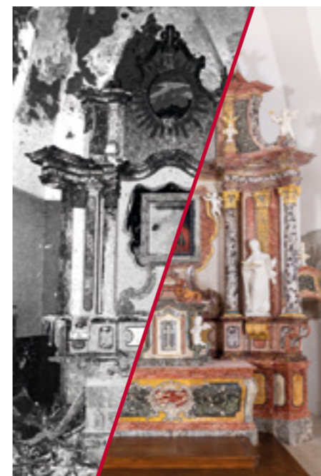
Sotin, župna crkva Blažene Djevice Marije Pomoćnice kršćana Glavni oltar istog patrocinija (1768.)

građevina te konzerviranih i restauriranih umjetnina, prema općoj kategorizaciji kulturnih dobara ipak se mogu izdvojiti radovi na obnovi sakralne i profane arhitekture Podunavlja, Tvrđe u Osijeku, Dvora Veliki Tabor ili pak dobrima upisanima na UNESCO-ovu listu svjetske baštine, poput Starog grada Dubrovnika, Dioklecijanove palače u Splitu, katedrala u Trogiru, Šibeniku i Poreču, stećaka, šibenske Tvrđave sv. Nikole, čipki ili pak odora i oružja sinjskih alkara. Valja navesti i vrsne rezultate arheoloških istraživanja: od izvanrednih nalaza izničke keramike iz podmorja otoka Mljeta, radova na istarskim kaštelima i kontinentalnim starim gradovima i utvrdama do novih spoznaja proizišlih iz istraživanja nalazišta Bojna - Brekinjova kosa. Djela istaknutih domaćih i europskih majstora skulpture (od Andrije Buvine, Ivana Duknovića, Jurja Dalmatinca, Francesca Laurane do Ivana Komersteinera, Vanje Radauša i mnogih drugih), slikarstva (od Julija Klovića, Lovre Dobričevića i Nikole Božidarevića, preko Tiziana Vecellija, Jacopa Tintoretta do Ivana Krstitelja Rangera, Vlahe Bukovca, Gustava Klimta i drugih velikana hrvatskoga slikarstva 19. i 20. stoljeća) te brojnih umjetnina i predmeta umjetničkog obrta iz najbogatijih riznica - sva je ta pokretna baština istražena i s pažnjom obnovljena.