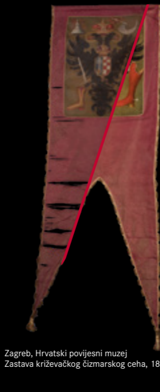
Zagreb, Hrvatski povijesni muzej Zastava križevačkog čizmarskog ceha, 18. stoljeće