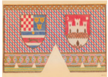
Zagreb, župna crkva sv. Marka