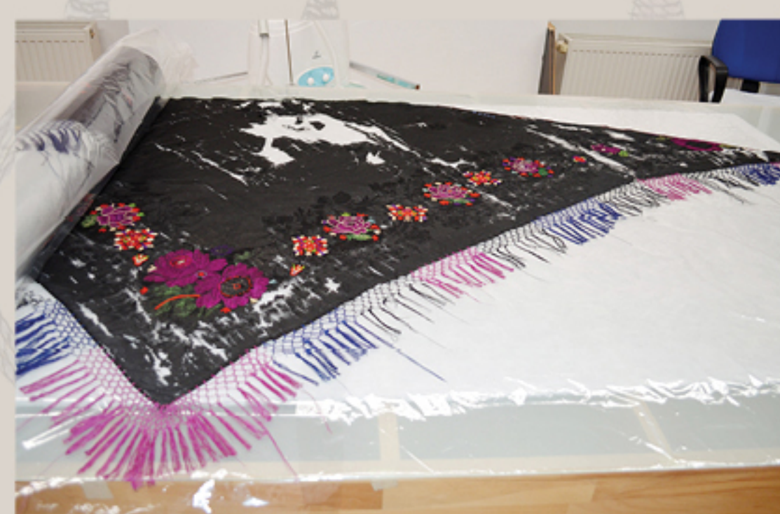
Izravnavanje i sušenje