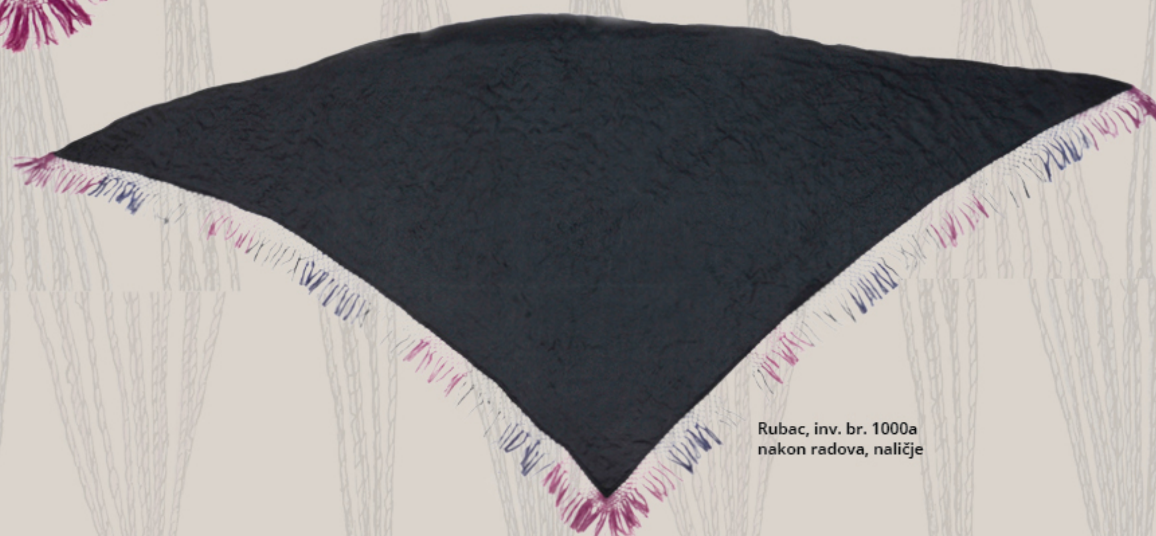
Rubac, inv. br. 1000a nakon radova, naličje