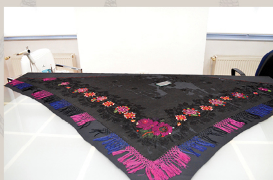
Konsolidacija novom svilenom tkaninom