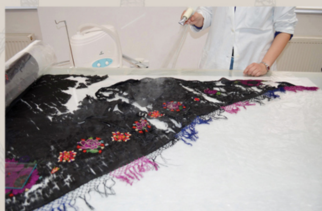
Relaksiranje vodenom parom