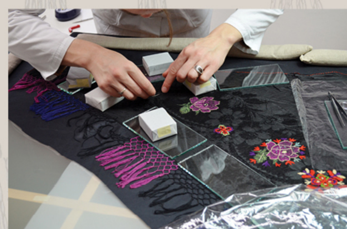
Sanacija oštećenja šivanjem