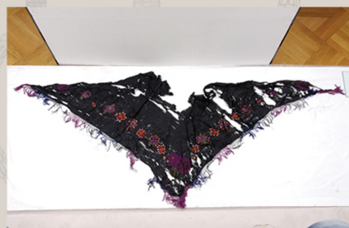
Rubac, inv. br. 1000a, prije konzervatorsko-restauratorskih radova