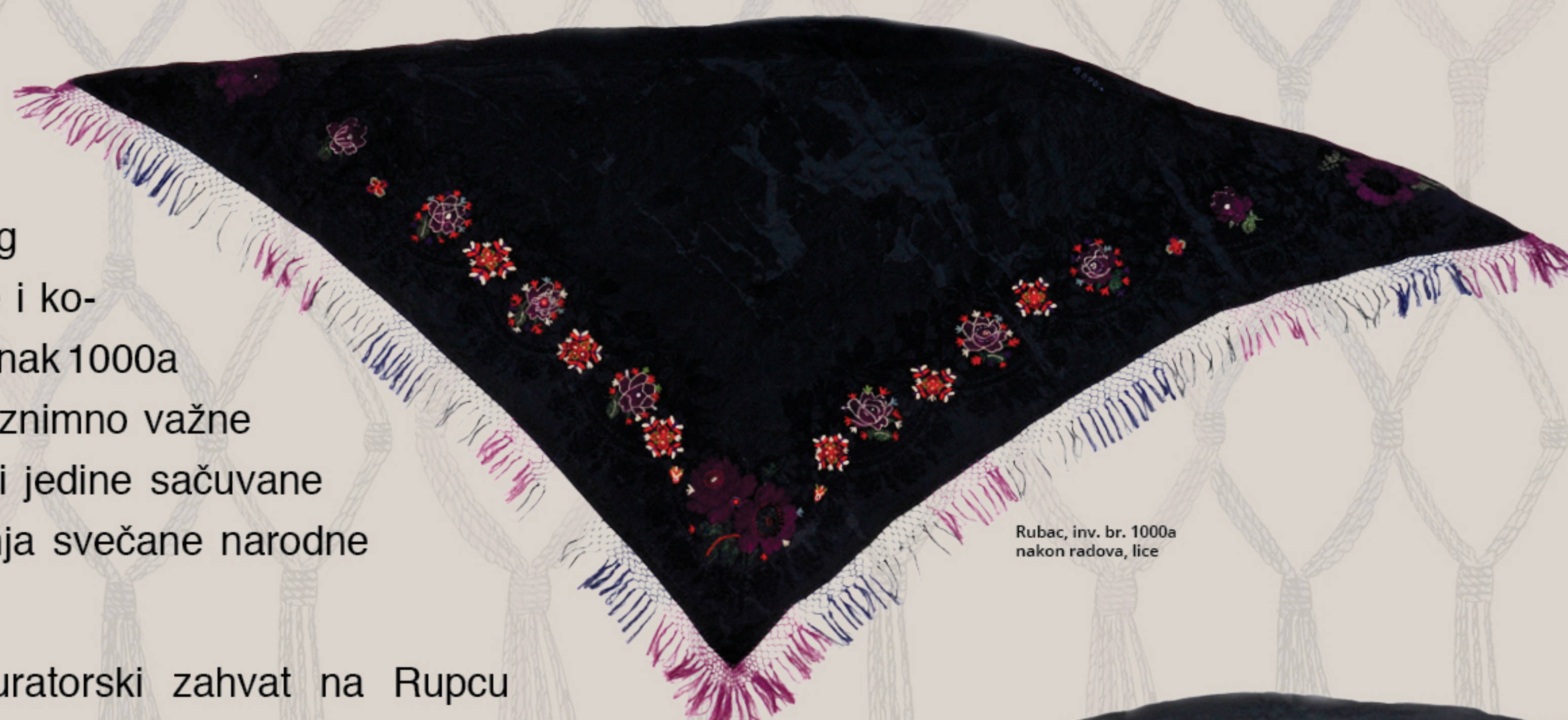
Rubac, inv. br. 1000a nakon radova, lice

Na rupcu su vidljiva veća oštećenja tekstilnog nosioca u vidu poderotina i nedostajućih dijelova, najvjerojatnije nastalih upora- bom i starenjem tekstilnog materijala. Rubac je izrazito izgužvan i naboran, što dodatno opterećuje tkaninu i stvara potencijalna mjesta oštećenja. Krtost predmeta uzrokovana je fotokemijskom degradacijom, a tkanina je u cijelosti prašna i onečišćena razno- vrnim prljavštinama. Ukrasne rese su zapletene, djelomično pokidane, dok na nekim mjestima crne rese nedostaju.