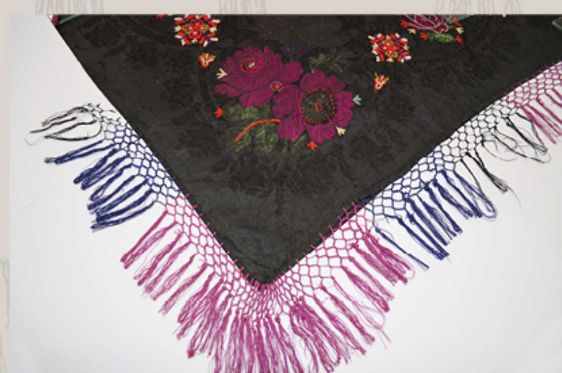
Detalji oštećenja nakon konzervatorsko-restauratorskih radova

Nakon dezinfekcije provedeno je uzorkovanje tekstilnih niti u svrhu kvalitativne analize metodom mikroskopije pod prolaznim svjetlom. Uslijedio je suhi postupak čišćenja; aerosolne prljav- štine uklonjene su mehaničkim putem. Za rubac je izrađena fotografska i grafička dokumentacija s konstrukcijskim karakte- ristikama predmeta. Nakon toga pristupilo se kondicioniranju i izravnavanju rupca hladnom vodenom parom. Predmet je u cijelosti konsolidiran novom svilenom tkaninom obojadisanom u lokalni ton izvornika, dok su mjesta oštećenja učvršćena šivanjem svilenom niti, konzervatorskim bodom. Lice tkanine dodatno je zaštićeno slojem poliamidne (PA) mrežaste teksti- lije, šivanjem.