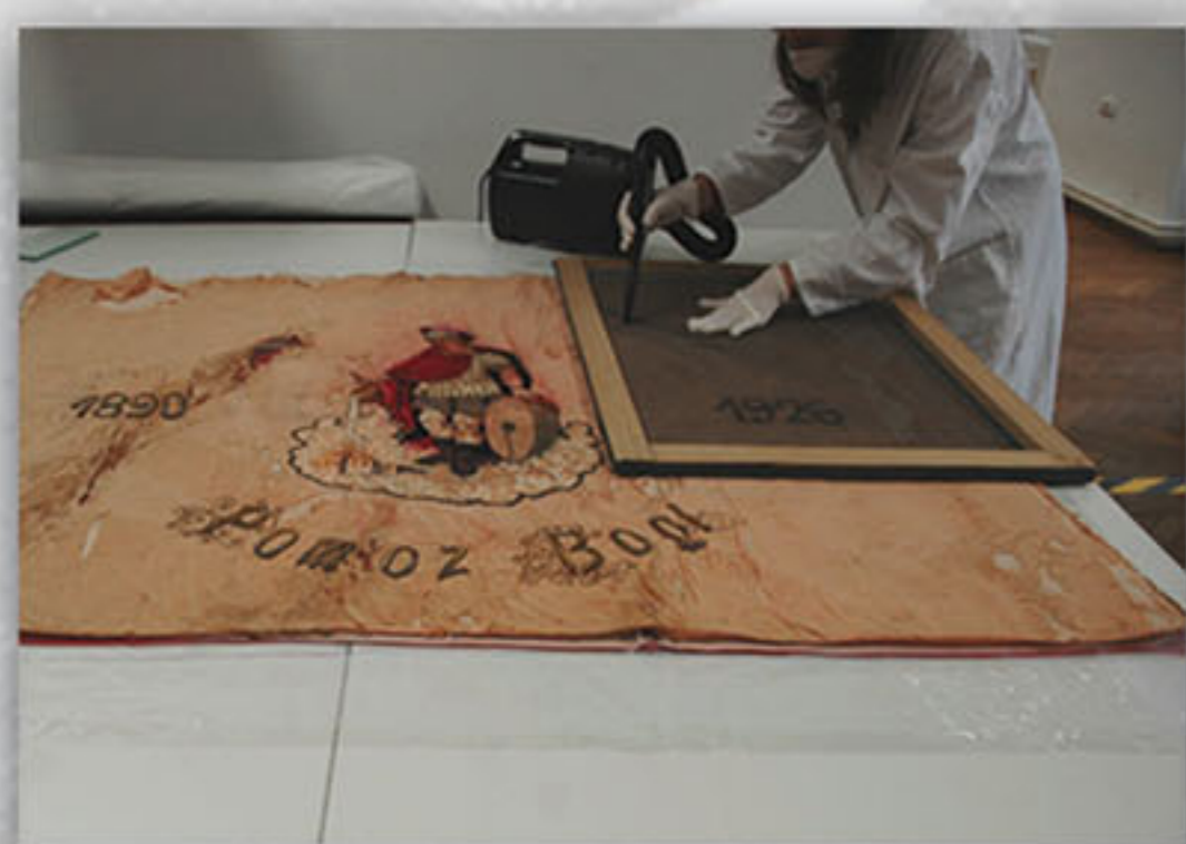
Uklanjanje površinske prljavštine