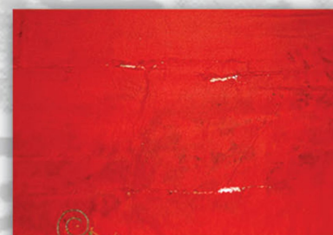
Uklanjanje prijašnjih intervencija