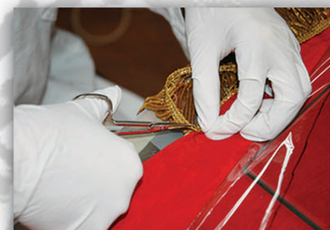
Razdvajanje metalnih rrsa