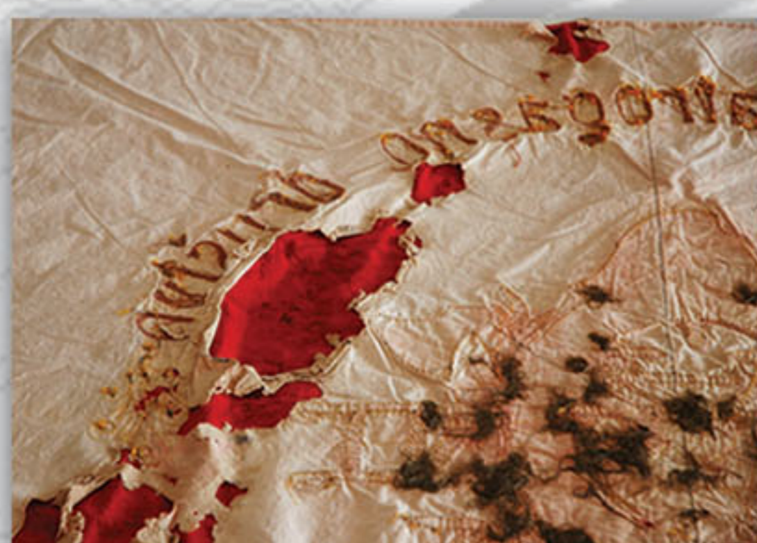
Mehanička oštećenja osnovne tkanine