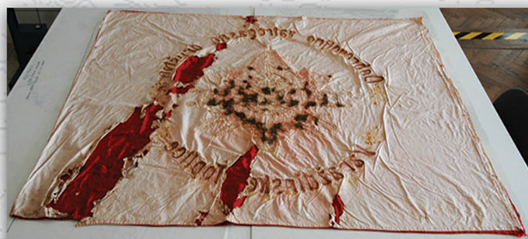
Pamučna osnovna tkanina nakon I faze radova