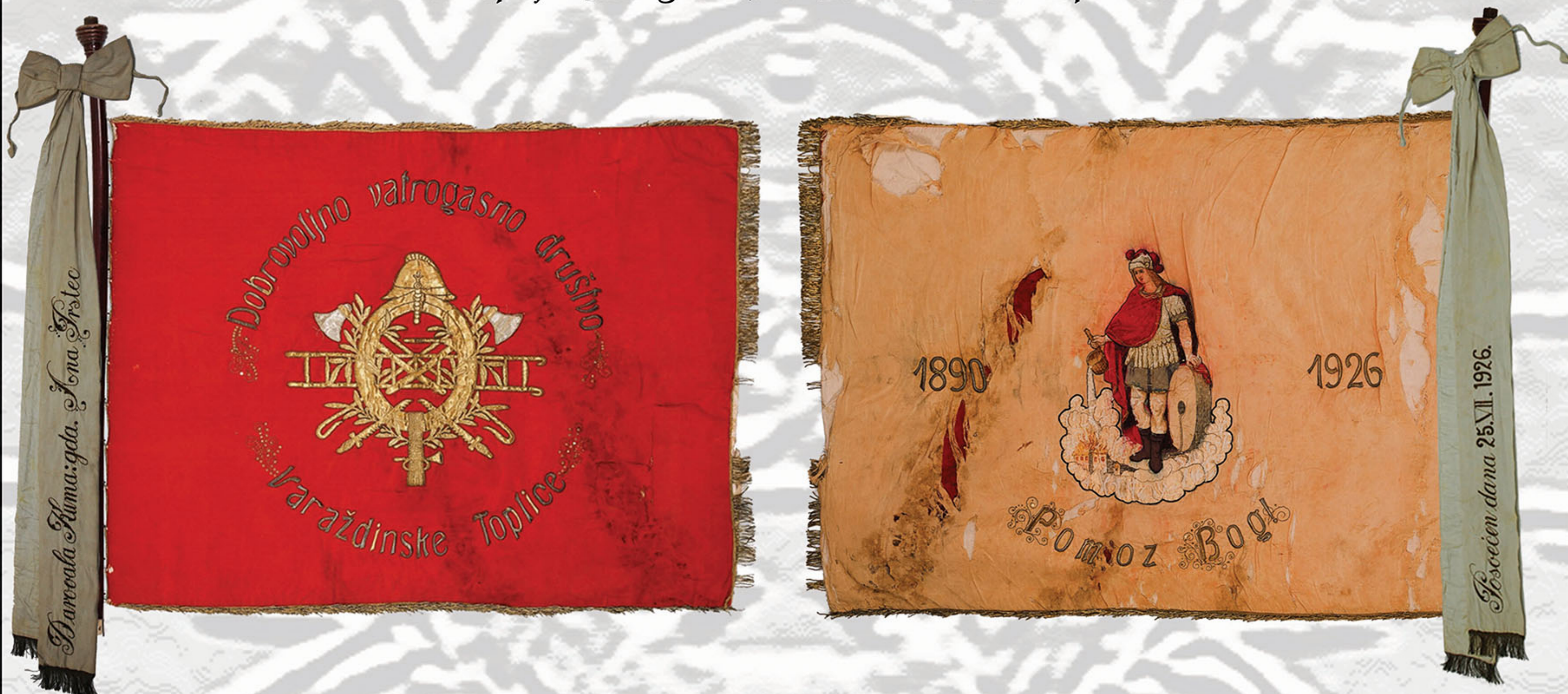
Zastava prije konzervatorsko-restauratorskih radova Prednja strana

Zasnovano na humanim, kršćanskim temeljima, u obranu života i imetka, prije 150 godina javlja se potreba za organiziranjem u borbi protiv požara - osnivaju se vatrogasna društva. Postojanje vatrogasnih društava je općeprihvaćeno, a zbog svoje masovnosti i potrebe ova društva održala su se i do danas. Svako društvo ima i svoja Pravila, a najveći ponos svakog društva je Zastava, koja se ističe i nosi u svim važnim prigodama. Vatrogasno društvo Varaždinske Toplice , osnovano 1889. godine, upravo ima sreću da je taj simbol vatrogastva star 84. godine ostao sačuvan i danas. Međutim, ova prva Zastava društva u lošem je stanju, kako zbog same uporabe, tako i zbog neprimjerenog čuvanja kao i nepovoljnih fizikalno - kemijskih utjecaja, stoga joj je potrebna pomoć konzervatora i restauratora kako bi ostala sačuvana za buduće generacije. Zastava DVĐ-a Varaždinske Toplice datira s početka 20. st. i pravokutnog je oblika. Načinjena je u Zavodu za umjetničko vezenje J. Neškudla, u Ljubljani. Svečana posveta zastave obavljena je 24. i 25. srpnja 1926. godine u Varaždinskim Toplicama.