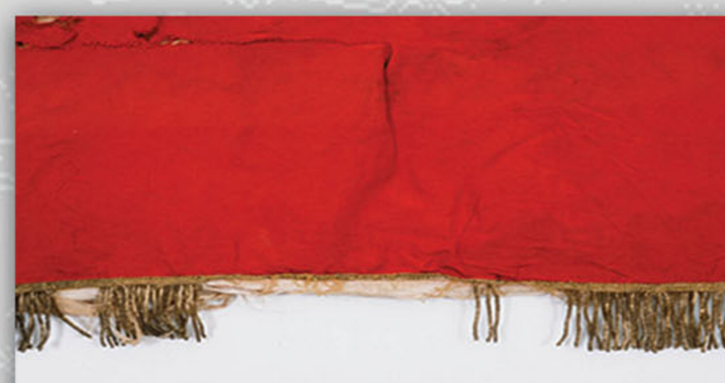
Nedostajući dijelovi rrsa