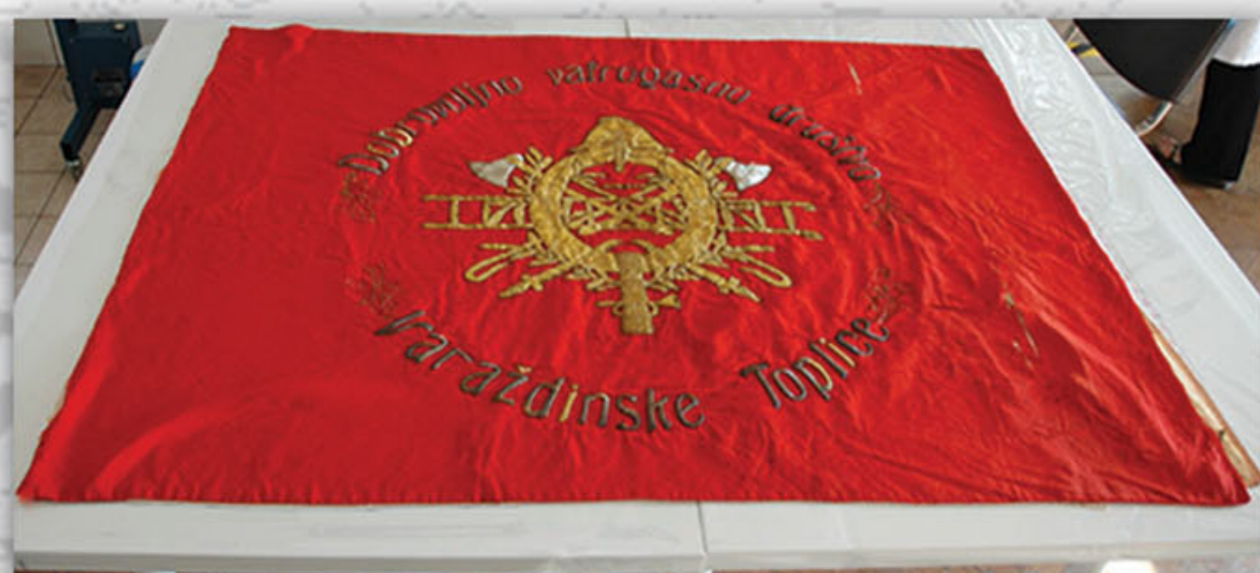
Svilena rips tkanina nakon I faze radova