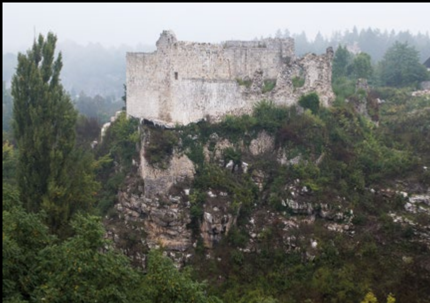
EL oko 1900 (MK RH) / JK 2013 (HRZ)