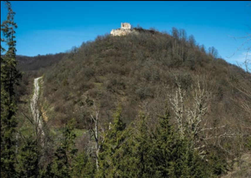
EL prije 1910 (MK RH) / JK 2014 (HRZ)