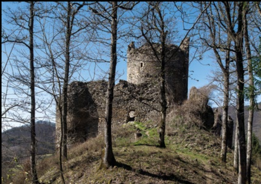
EL oko 1900 (MK RH) / JK 2014 (HRZ)