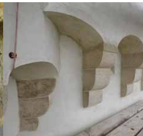
2009. | 2011.

DVOR VELIKI TABOR reprezentativan je primjer obrambenog, stambenog i gospodarskog plemićkog sjedišta. Građen je od početka 16. stoljeća a ima kasno-gotička, renesansna i barokna stilska obilježja.