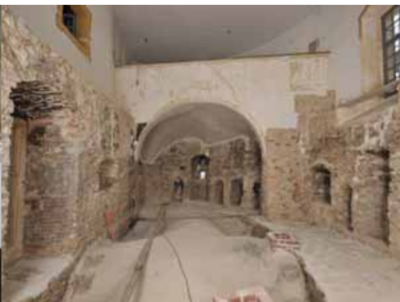
2009. | 2010.