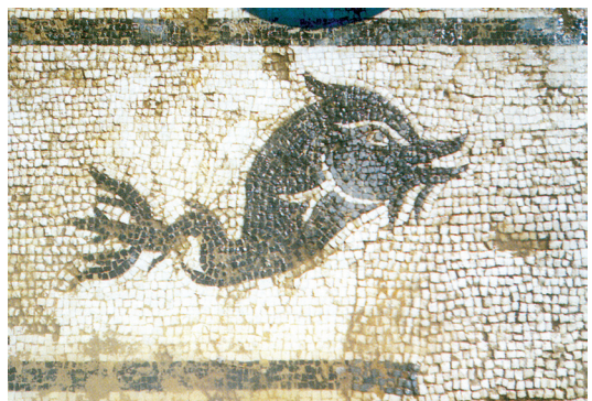
Mozaik s dupinima, nakon konzervacije-restauracije, Vis, terme rimske Isse

Odsjek je afirmaciju doživio i na područjima izvan Dalmacije, pa su 2004./2005. rekonstruirani te konzervirani-restaurirani mozaici sv. Marije Formoze u Puli i freske iz Andautonije-Šćitarjeva. Posebno je zahtjevan bio projekt konzervacije-restauracije stropnih slika Antonia Zuccara u palači Bajamonti-Dešković u Splitu, u kojem su provedene sve faze poznate u restauraciji stropnih slika: od parcelizacije i demontaže, rekonstruktivnog retuša do ponovnog vraćanja na strop. Taj zahvat, uz onaj na osliku hvarskog kazališta, doveo je do niza konzervatorsko-restauratorskih intervencija na dosad nepoznatim zidnim slikama 19. stoljeća u Šibeniku.