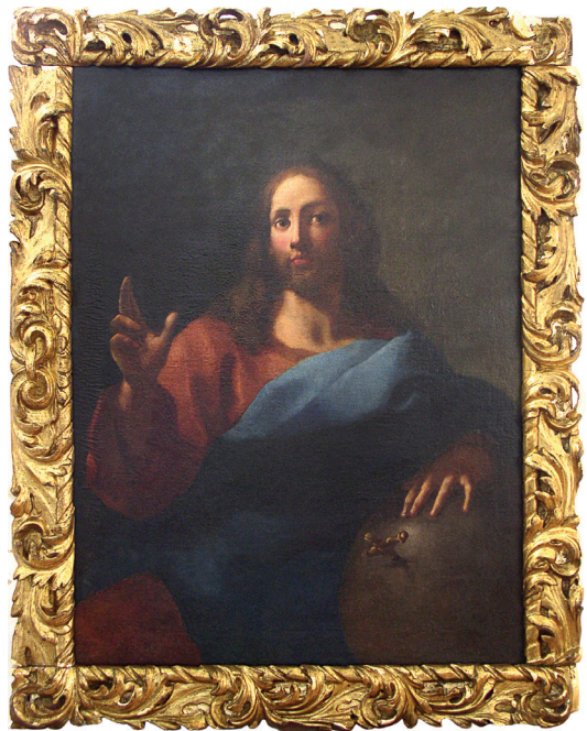
Mletački slikar, Krist Pantokrator, prva polovica 18. stoljeća, ulje na platnu, 114 x 86,5 cm, Split, crkva sv. Križa

Prvo gotovo tridesetogodišnje razdoblje slijedi tadašnje spoznaje i tehničke postupke