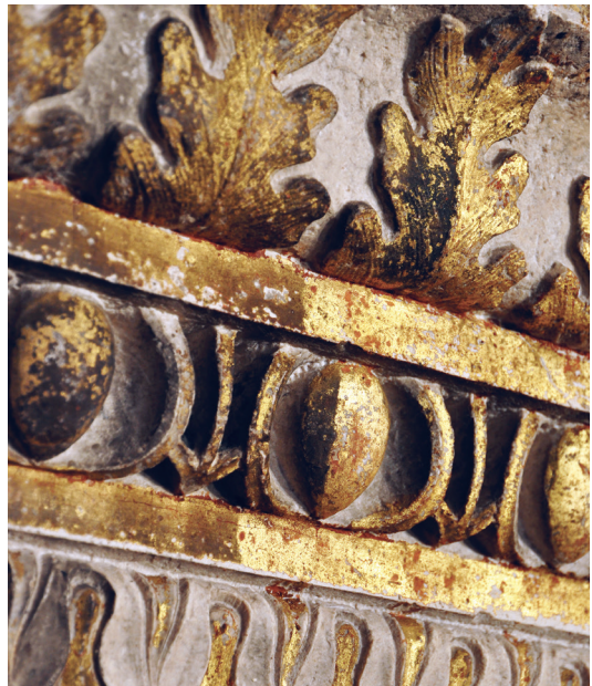
Detalj vijenca u svetištu, 15. st., katedrala sv. Jakova, Šibenik

Izvođeci od 2003. godine veliki projekt konzervatorsko-restauratorskih radova na Peristilu Dioklecijanove palače u Splitu, Odsjek za kamenu plastiku se snažno i brzo razvijao