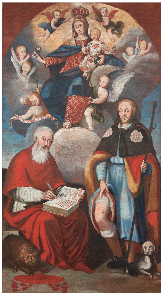
Filippo Naldi, (Firenca, ? – Dalmacija, nakon 1777.), Bogorodica s Djetetom, Sv. Jerolimom i Sv. Rokom, 1754. godine, ulje na platnu, 172 cm x 95 cm, Kostanje, župna crkva sv. Mihovila

pojedinačne opuse, stilske epohe te povijesne i pokrajinske cjeline.