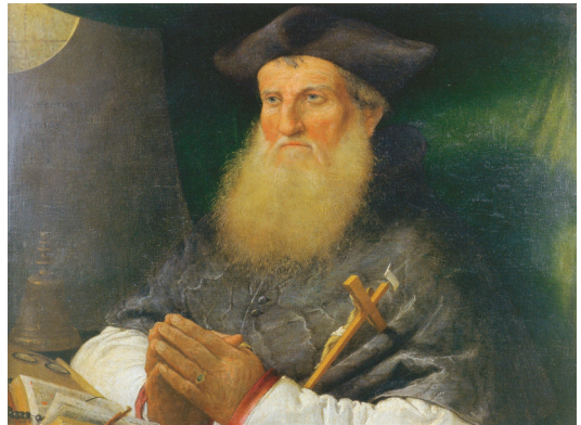
Lorenzo Lotto, (Venecija, oko 1470. — Loreto, 1566.), Portret Tome Nigrisa, 1527. godine, ulje na platnu, 42 x 54 cm, Split, Franjevački samostan na Poljudu (gore: prije restauracije, dolje: nakon restauracije)

dijelom iz njezinoga priobalja od Istre i Kvarnera do Dalmacije i Boke kotorske, u rasponu od umjetnina iz Antike do djela suvremenih majstora, podjednako slike u različitim tehnikama, mozaici i freske, kamena i polikromirana skulptura i štukatura do cjelovite obnove crkava i urbanih prostora poput Peristila i katedrale sv. Jakova u Šibeniku. Radionica je veoma često sudjelovala i u ostvarivanju značajnih izložbi. Navedimo samo neke: Romaničko slikarstvo (Split, Zagreb), Zlatno doba Dubrovnika (Zagreb), Pustinja Blaca (Splitu), Restaurirane umjetnine iz Boke (Split), Blaž Jurjev Trogiraniin (Split, Zagreb i Venecija), Hrvati-vjera, kultura, umjetnost (Vatikan), Renesansno slikarstvo (Zagrebu) i brojnih drugih koje su predstavljale