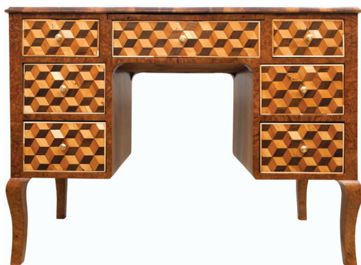
Pisači stol, 18. stoljeće, rezbareno drvo, intarzije, 85 x 56 x 109 cm, Split, Franjevački samostan u Poljuđu

umjetnina u uvjetima povećane vlažnosti i topline pogodnim za razvoj crvotočine i parazita na organskim materijalima, ipak se uočavaju nedostaci i ograničenje primjene voštanih smjesa.