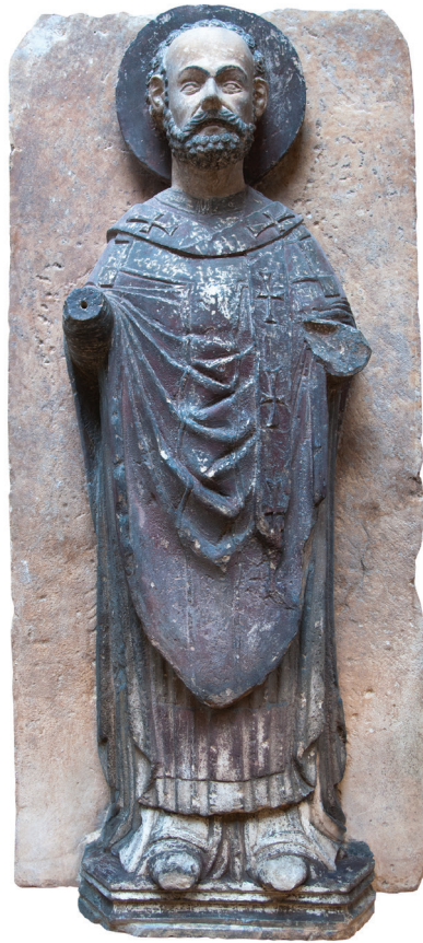
Bonino iz Milana, (Lombardija, ? – Šibenik, 1429.) Sv. Nikola, 1427. – 1429. godine, vapnenac, 106 x 50 x 30 cm, Šibenik, crkva sv. Barbare

primjeren radni prostor i oprema koja se nabavlja u skladu s mogućnostima. U takvom okruženju stasa u Splitu i novoformirani Odjel za restauriranje kamena Hrvatskog restauratorskog zavoda. Uz znanstvenu potporu prirodoslovnog laboratorija Zavoda u Zagrebu i kroz suradnju s Opificio delle Pietre Dure iz Firenze i Uredom za staru gradsku jezgru u Splitu, te arhitektima i konzervatorima iz Splita, započinje veliki projekt restauriranja Peristila. Poznate su i nagrade i izložbe vezane uz taj projekt, a na nama i na mlađim generacijama koje dolaze ostaje da slijedećih 60 godina ostvarimo još više kvalitetnih i uspješnih projekata. Naši spomenici i njihovo stanje nas na to obvezuju.