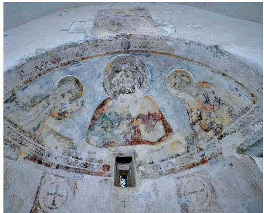
Srednjovjekovne zidne slike Deizisa i sv. Mihovila, Šolta, crkva sv. Mihovila

Odsjek za zidno slikarstvo i mozaike u protekla je dva desetljeća kontinuiranog rada stekao dovoljno iskustva da može rješavati niz specifičnih problema očuvanja zidnog slikarstva i mozaika, pri čemu među mnogim zahvatima posebno treba istaknuti zapaženu konzervaciju-restauraciju skinutih ulomaka ranokršćanskih fresaka iz crkvice sv. Ivana i Teodora u Bolu, kasnoantičkih fresaka krstionice u Naroni, mozaika antičke Isse i Dioklecijanove palače, srednjovjekovnih fresaka u Stonu, na Braču i u Srednjem Selu na Šolti, baroknih u manastiru Krupa i u Svibu kraj Imotskog.