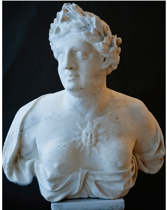
Nepoznati mletački kipar, Alegorija Slikarstva, 18. stoljeće, vapnenac, 198 x 65 x 48 cm, Split, Palača Bajamonti/Dešković

U današnjem vremenu znatno većih tehničkih mogućnosti, naglih i brojnih prodora suvremene znanosti, ponekad i pretjerane ponude restauratorske tehnologije zasnovane više na tržišnim interesima, potrebno je još opreznije i odgovornije sagledati bitne odrednice restauratorske djelatnosti i često zanemarenu, tehnološkom ekspanzijom potisnutu ulogu ljudskog faktora, poglavito ispravnog „čitanja“ i tumačenja restauratorskog problema, pa zatim određivanja i provođenja restauratorskog cilja. Osim standardnog vrednovanja izvornog djela u svakom njegovom segmentu, u zadnje je vrijeme u fokusu pridavanje sve veće i gotovo jednake važnosti specifičnom tragu koji ostavlja protok vremena na svaki korišteni materijal nekog umjetničkog djela, bilo da se radi o zlatnom listiću na okviru slike, drvenoj