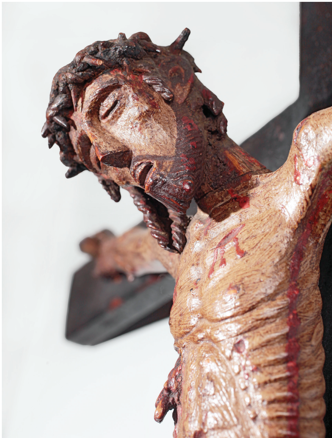
Fulgencije Bakotić, (Kaštel Gomilica, 1716. — Amelia, 1792.) Raspelo, četvrto ili peto desetljeće 18. stoljeća, bojano i rezbareno drvo, 80,5 x 37cm, Split, Nadbiskupsko sjemenište