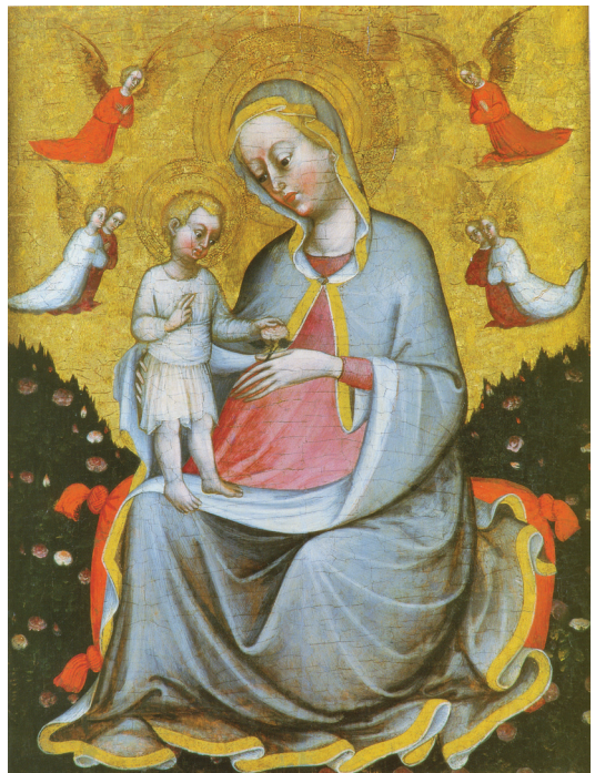
Blaž Jurjev Trogirin, (Trogir ?, oko 1412. – Zadar, oko 1448.) Gospa u ružičnjaku, prva polovica 15. stoljeća tempera na drvu, 133,5 x 103 cm, Trogir, Zbirka crkvene umjetnosti (gore: tijekom restauriranja, dolje: nakon restauriranja)