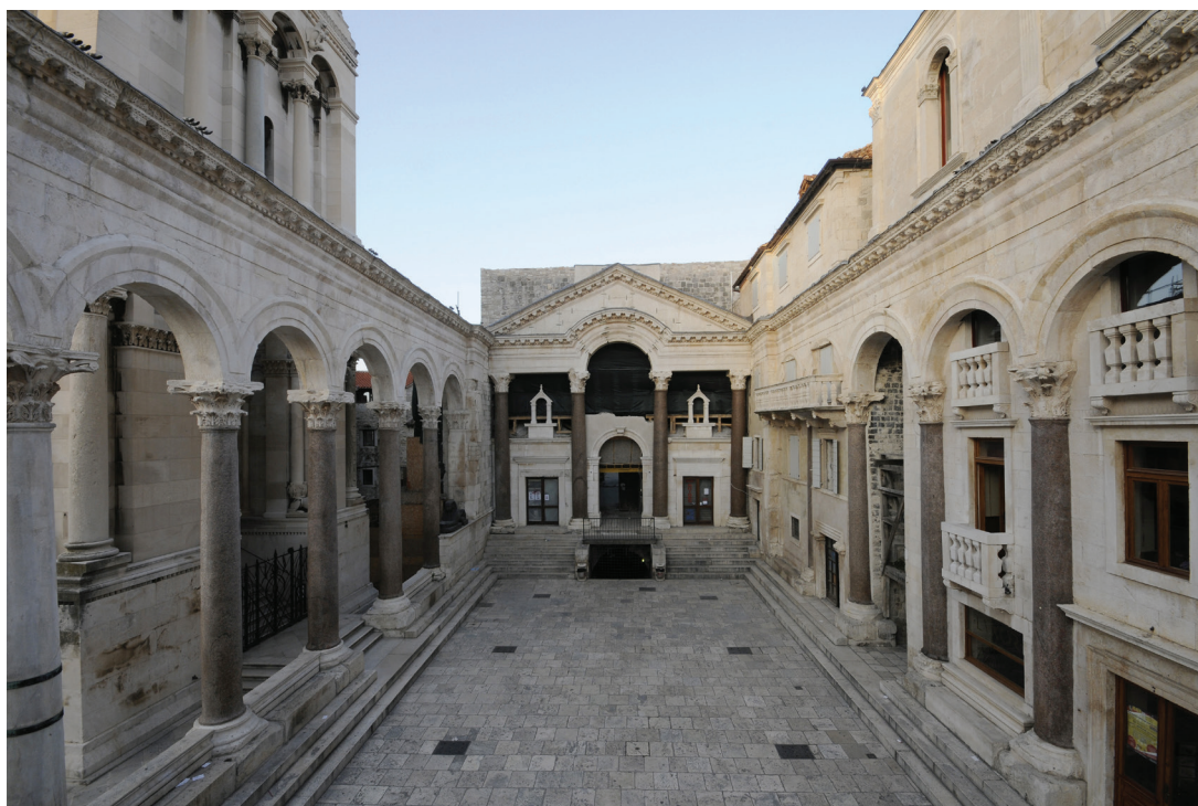
Peristil, 295. – 305. godine, Split, Dioklecijanova palača, (gore: prije restauriranja, dolje: nakon restauriranja)