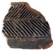
Ulomak bikonične zdjele ukrašene žlijebljenjem, s tragovima inkrustacije.

Početkom 17. st. u Stari se grad smješta posada Vojne krajine koja će tu ostati do njezina rasformiranja 1871. godine. Promjenom osnovne funkcije grad se arhitektonski prilagođava novoj, vojnoj namjeni. Pokretni arheološki nalazi jasno se razlikuju od nalaza prethodne faze s obzirom na to da su namijenjeni vojnoj upotrebi. Nedostaje luksuzno