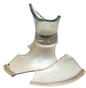
Donji dio čaše na nozi s prstenastom stajaćom bazom.

keramičko i stakleno posuđe i mijenja se oružje, a proizvodnja je uglavnom lokalna.