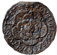
Trgovački pečat s natpisom GVILHELMVS ALMANDETEE.