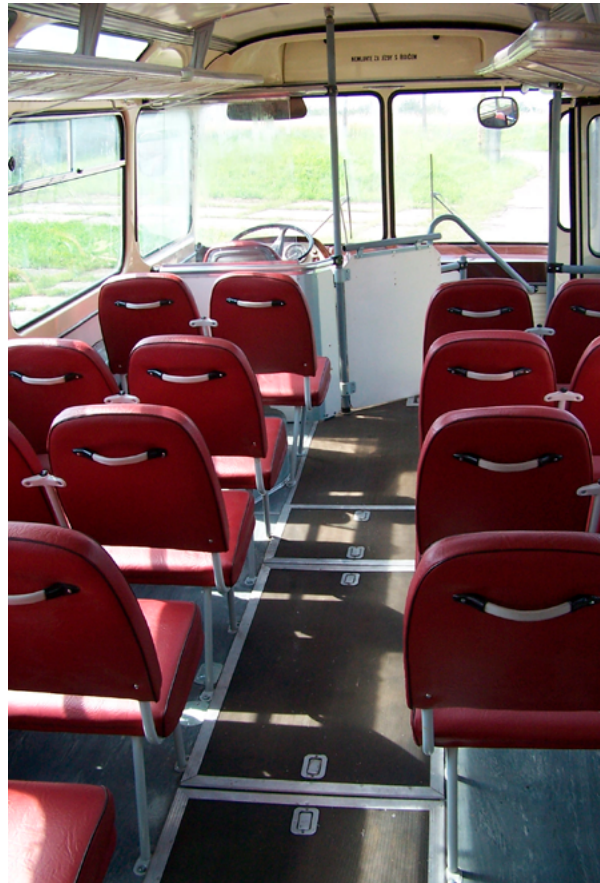
12. Stanje interijera autobusa Karosa ŠL 11.1305 nakon konzervatorskog-restauratorskog zahvata (TMB, snimka: T. Kocman, 2009.)

Condition of the interior of the Karos ŠL 11.1305 bus before conservation (TMB, T. Kocman, 2003)