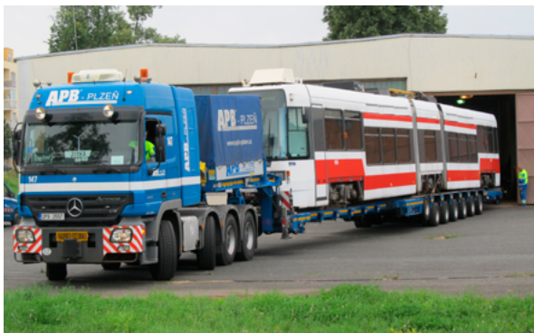
2. Tramvaj ČKD RT6N izrađen 1997. godine tijekom istovara iz specijalnih kola u depou Tehničkog muzeja u Brnu 22. lipnja 2018. godine (TMB, snimka: T. Kocman, 2018.) Tram ČKD RT6N, made in 1997, during unloading from special cars in the depot of the Technical Museum in Brno on June 22, 2018 (TMB, T. Kocman, 2018)

U okviru testiranja procjenjuje se i povijesna originalnost, kao i tehničko stanje vozila. 3 Pravila za tračnička