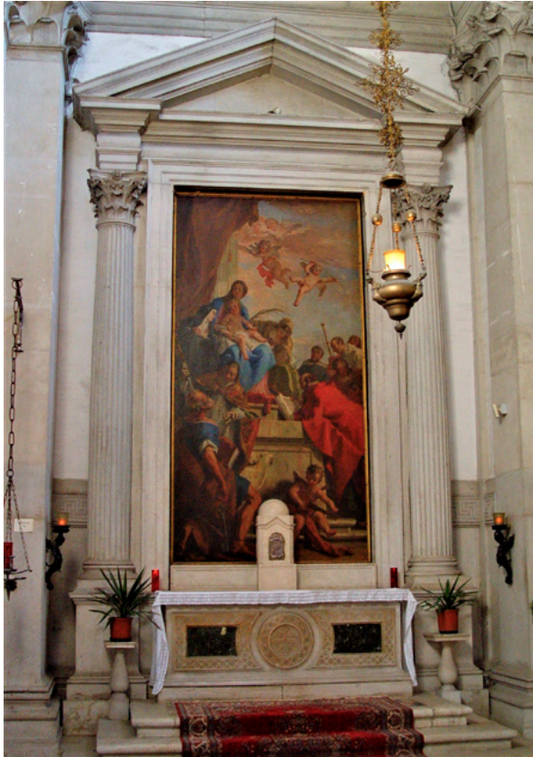
4. Venecija, San Giorgio Maggiore, bočni oltar (snimka: D. Tulić, 2008.) Venice, church of San Giorgio Maggiore, side altar (D. Tulić, 2008)