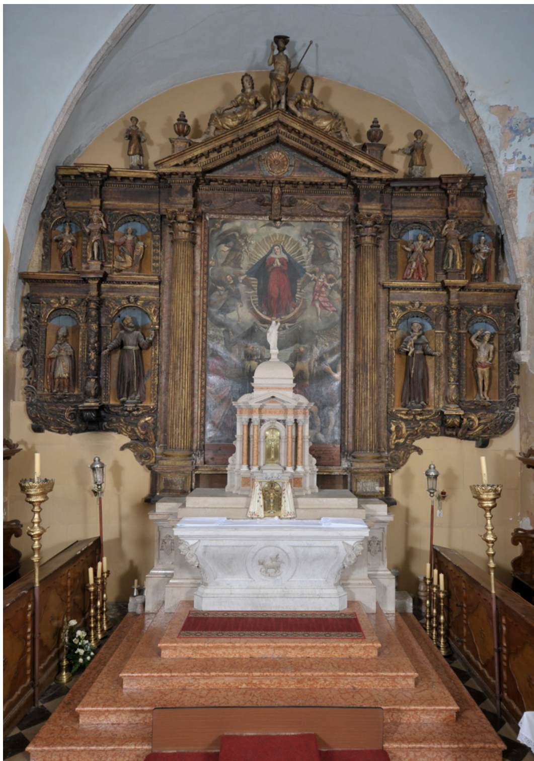
1. Vrbnik, župna crkva Uznesenja Blažene Djevice Marije, glavni oltar Uznesenja Blažene Djevice Marije, zatečeno stanje

Vrbnik, church of the Assumption of the Blessed Virgin Mary, high altar of the Assumption of the Blessed Virgin Mary, condition before conservation