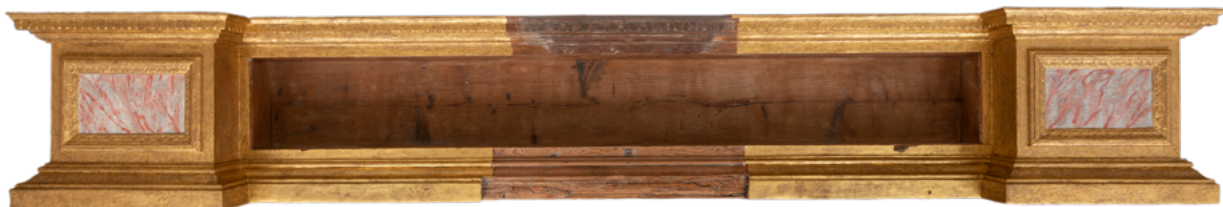
15. Predela nakon izvedenih konzervatorsko-restauratorskih radova Predella after conservation

Oslíkani su dijelovi oltara, na koncu, zaštićeni slojem laka. I za tu, završnu fazu prethodno su napravljene probe s dvije otopine laka na bazi sintetičkih smola koje dugoročno imaju puno bolja fizikalno-kemijska svojstva od tradicionalnih triterpenskih smola, kao što su damar i mastiks. Prvi je lak napravljen od 20 %-tne otopine ugljikovodične smole Regalrez 1094 u mineralnom otapalu Shellsol T uz dodatak bijeljenog pčelinjeg voska za matiranje i aditiva Tinuvin 292 za stabilnost otopine. Drugi je lak napravljen od 20 %-tne otopine urea-aldehidne smole Laropal A81 u ugljikovodičnim otapalima Shellsol A i D (u omjeru 1 : 1) uz dodatak bijeljenog pčelinjeg voska za matiranje i aditiva Tinuvin 292 za stabilnost otopine. Za završni zaštitni lak polikromiranih dijelova umjetnine izabran je onaj na bazi urea-aldehidne smole Laropal A81 . Drugi je lak nakon sušenja ujednačen i blago sjajan na površini, za razliku od prvog koji ima neujednačen sjaj.