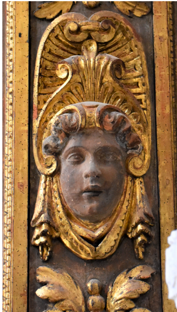
6. Venecija, San Sebastiano, protoma na ogradi pjevališta

Zanimljivo je istaknuti da je biskup David 1685. godine zabilježio kako se uz skulpturu Otkupitelja nalaze dva sjeđeća lika proroka s cvijetom u rukama. Nije lako objasniti zbog čega je, inače precizan biskup David, naveo proroke uz Otkupitelja na vrhu oltara, no kako je vizitacija održana u večernjim satima možemo tek pretpostaviti da prelat nije dobro vidio skulpture visoko na vrhu monumentalnog zabata. 27 Dvije kanelirane vaze na kvadratnim postamentima vrbničkog zabata također se mogu pronaći na nizu drvenih retabla u Dalmaciji, počevši od ranog primjera, kakav je raskošni okvir poliptiha Girolama da Santa Crocea iz 1549. godine na glavnom oltaru u franjevačkoj crkvi na Poljudu. 28