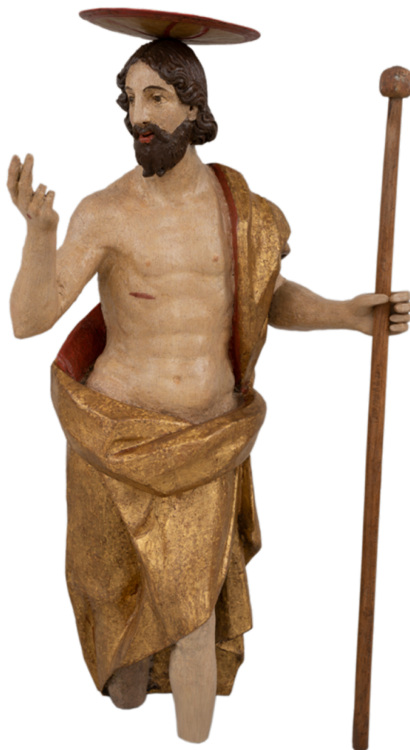
13. Skulptura Uskrslog Krista nakon izvedenih konzervatorsko-restauratorskih radova Sculpture of the Risen Christ after conservation

morali odvijati paralelno jer su pojedini nestabilni dijelovi oslika bili učvršćeni samo postojećim slojem laka. Uklanjanju laka prethodile su probe topivosti kako bi se utvrdila najbolja metoda rada s obzirom na polarost površine. Izveden je Wolbers-Cremonesijev test topljivosti. 64 Test je pokazao da je aceton najbolje otapalo za uklanjanje laka. Prednost acetona je i u tome što brzo hlapi i ne oštećuje donje slojeve izvorne pozlate, no upravo zbog brzog hlapljenja, ne daje dovoljno vremena da se odvijte fizikalni proces topljenja laka. Stoga nije korišten čisti aceton, već ugušćen u otapajućem gelu. Na taj način sporije hlapi, manje prodire u donje slojeve te ostavlja dovoljno vremena da se odvijte proces otapanja. 65 Gel se nanosio kistom na površinu, ostavljao da djeluje oko minutu i potom uklanjao mješavinom acetona i nepolarnog otapala (mineralno otapalo Shellsol T ) u omjeru 1 : 1. Tretirana je površina naposljetku isprana samo nepolarnim otapalom.