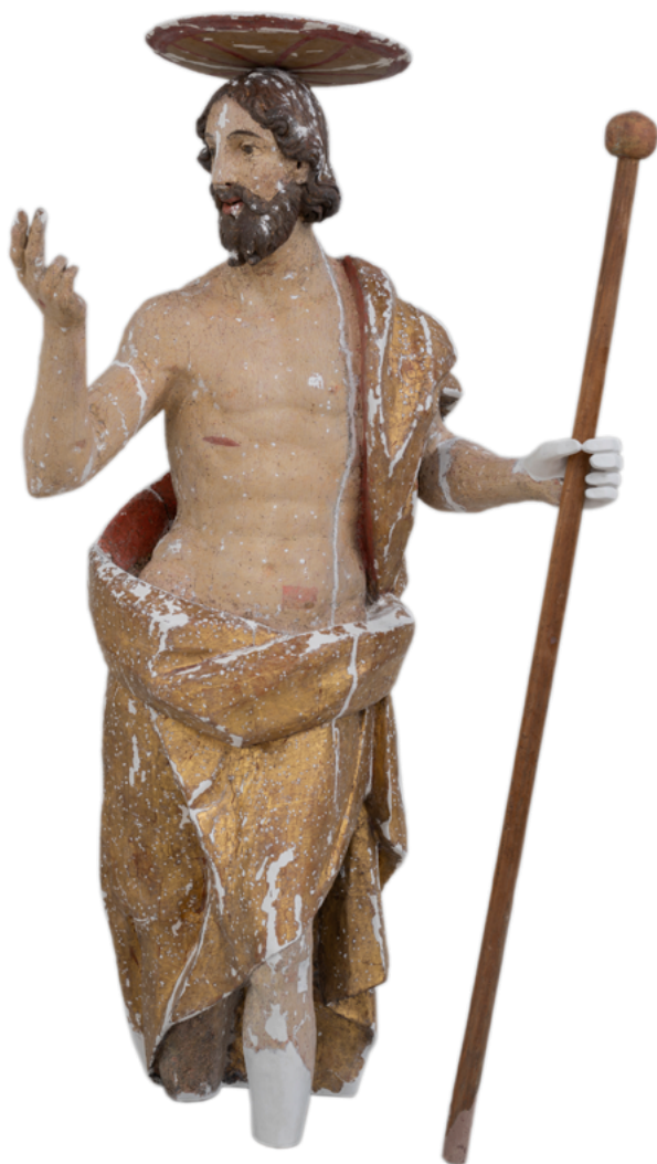
12. Skulptura Uskrslog Krista nakon rekonstrukcije oštećenja u sloju osnove Sculpture of the Risen Christ after reconstruction of damage in the base layer