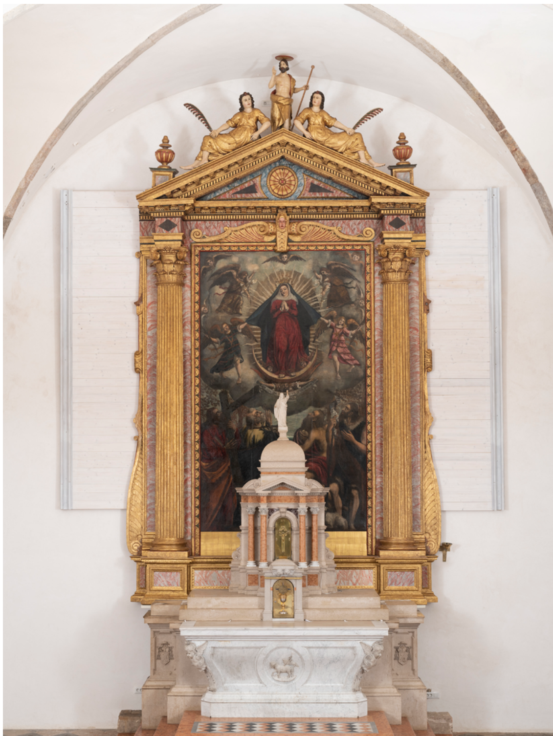
2. Vrbnik, župna crkva Uznesenja Blažene Djevice Marije, središnji dio glavnog oltara Uznesenja Blažene Djevice Marije, nakon završenih konzervatorsko-restauratorskih radova (arhiva HRZ-a, snimka: G. Tomljenović, 2019.)

Vrbnik, church of the Assumption of the Blessed Virgin Mary, central part of the high altar of the Assumption of the Blessed Virgin Mary, condition after conservation (HRZ Photo Archive, G. Tomljenović, 2019)