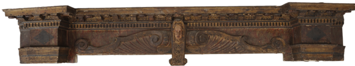
10. Vijenac prije početka konzervatorsko-restauratorskih radova Cornice before conservation

povijesna i stilaska razdoblja mijenjao izgled. Radovi su započeti demontažom te su dijelovi oltarne arhitekture i skulptura transportirani u Restauratorski odjel u Rijeci, gdje su do svibnja 2019. godine izvedeni cjeloviti konzervatorsko-restauratorski radovi na njegovom središnjem dijelu koji je potom vraćen i montiran u svetište crkve. Početni konzervatorsko-restauratorski zahvati, kao što je dezinfekcija, 43 konsolidacija izrazito oslabljenog drvenog nosioca i konzervatorsko-restauratorska istraživanja, izvedeni su na cijelom oltaru. Daljnji radovi, koji su potom izvođeni samo na središnjem dijelu oltara, 44 obuhvaćali su sljedeće faze: uklanjanje alteriranog laka i parcijalno nanesenih preslika, podljepljivanje slikanog sloja, stolarsku sanaciju i rekonstrukciju oštećenja u sloju nosioca, tutkalno-kredne osnove, slikanih slojeva i pozlate te zaštitno lakiranje. Svakom od spomenutih zahvata prethodilo je empirijsko testiranje materijala sa svrhom pronalaženja optimalnog rješenja za specifičnu problematiku na ovoj umjetnini.