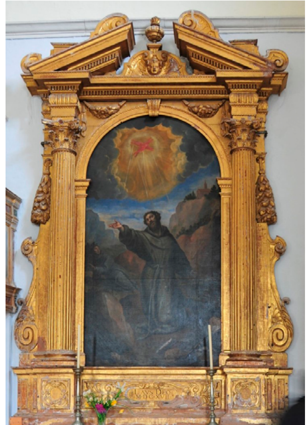
5. Hvar, franjevačka crkva Gospe do Milosti, oltar svetog Franje, 1617. Hvar, Franciscan church of Our Lady of Mercy, altar of St Francis, 1617

korinška stupa povezana trokutnim ili segmentnim zabatom. U formi retabla, ta je matrica najvjerojatnije prvi put izvedena oko 1508. u crkvi Santa Maria delle Carceri u Pratu prema projektu Giuliana da Sangalla (1443. – 1516.). 18 Po dolasku iz Rima u Veneciju, 1527. godine edikulu emancipira Jacopo Sansovino (1486. – 1570.) u nizu svojih radova počevši od one s kipom Bogorodice s Djetetom u Arsenalu iz 1534. ili dvorišne niše za kip u Palazzo Corner della Ca'Granda. Istovremeno, Serlio u traktatima, u najranijoj od svojih sedam knjiga, Libro IV – Regole generali di architettura sopra le cinque maniere degli edifici (...) , tiskanom 1537. godine u Veneciji, daje mnoštvo ilustriranih primjera arhitekture i s njom povezane dekoracije. On čitateljima, odnosno arhitektima i majstorima, nudi osnovnu matricu koju oni, ako su vješti i domišljati, potom mogu samostalno razviti i kombinirati s ukrasima kako bi njihova inventivnost izazvala divljenje promatrača. S druge strane, nasuprot Serlovim exemplima , Palladio i Scamozzi zagovaraju poštivanje zadanih kanona i izbjegavanje „nerazumnih“ ornamentea. 19 I doista, ako se uspoređi stroga monumentalna edikula iz Vrbnika s oltarima koji se do danas mogu vidjeti po venecijanskim crkvama, vidi se da je ona idejno najbliža jednostavnim i svečanim edikulama bočnih kamenih oltara u Palladijevoj