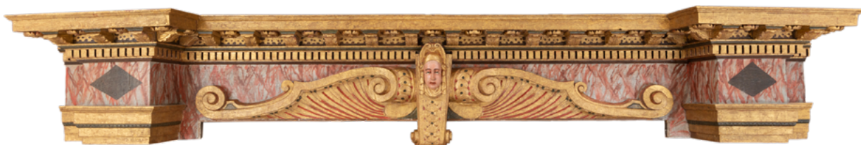
14. Vijenac nakon izvedenih konzervatorsko-restauratorskih radova Cornice after conservation