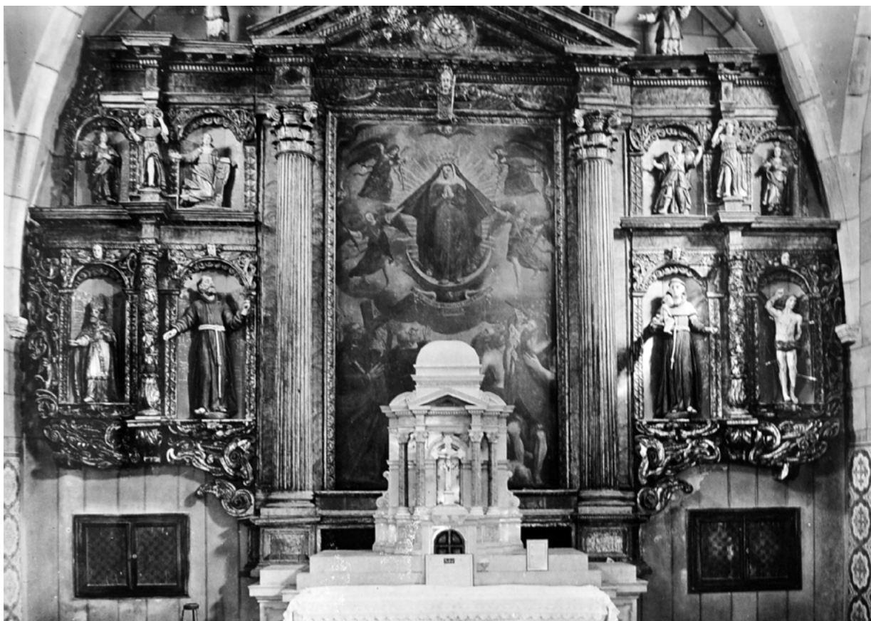
3. Vrbnik, župna crkva Uznesenja Blažene Djevice Marije, glavni oltar (HAZU SFA, snimka: Đ. Griesbach, 1933.) Vrbnik, church of the Assumption of the Blessed Virgin Mary, high altar (HAZU SFA, Đ. Griesbach, 1933)

moгу naći na području Istre, Kvarnera i Vinodola. S ovom se interpretacijom složila Vlasta Zajec, u studiji o drvenim oltarima i skulpturi 17. stoljeća u Istri iz 2014. godine. 14