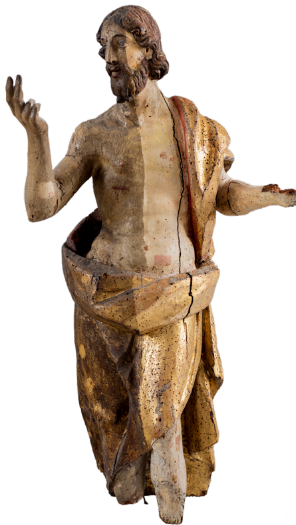
11. Vrbnik, središnji dio glavnog oltara, skulptura Uskrslog Krista nakon faze sondiranja slikanog sloja

Glavni je oltar, smješten na začelnom zidu svetišta župne crkve, zatečen u relativno lošem stanju očuvanosti (sl. 10). 58 Nakon izvedene demontaže, dezinfekcije 59 i konzervatorsko-restauratorskih istraživanja, 60 konsolidiran je oslabljeni drveni nosilac otopinom akrilne smole Paraloid B-72 u acetonu i etilnom alkoholu u različitim omjerima (korištene su otopine od 5 %, 10 % i 15 %). 61 Zbog specifične problematike na slikanom sloju, koji je bio izrazito raspučan i koritasto odignut te premazan debelim slojem