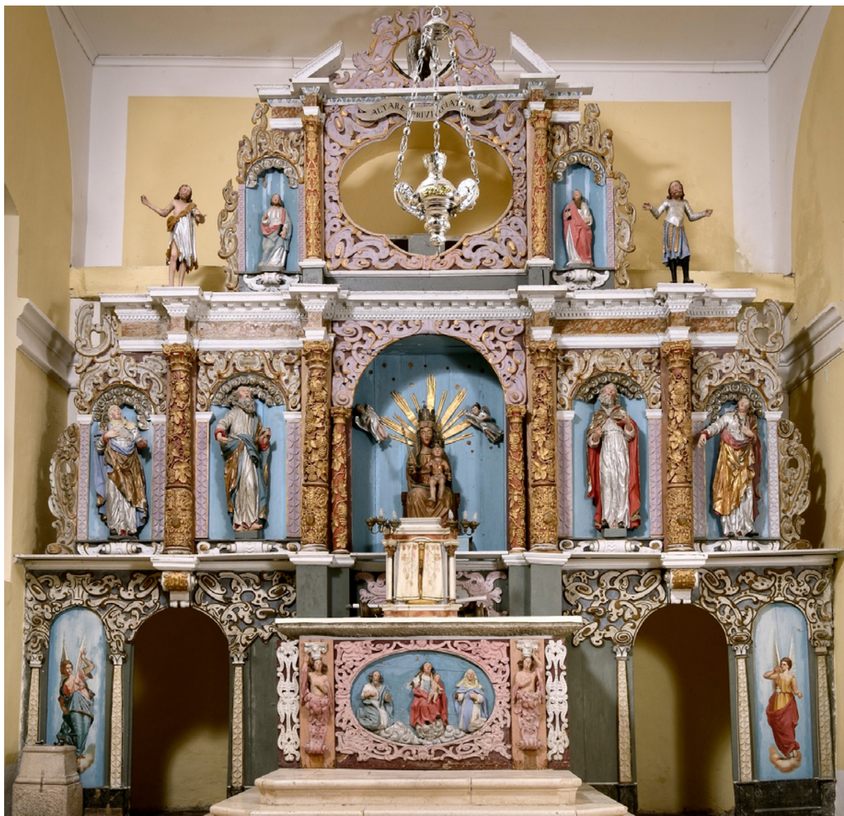
8. Boljunsko Polje, crkva Gospe od Karmela, glavni oltar, 1676. (snimka: I. Puniš, 2017.) Boljunsko Polje, church of Our Lady of Mount Carmel, high altar, 1676 (I. Puniš, 2017)

sačuvao, a zasigurno je bio naručen zajedno s retablom. Za pretpostaviti je da je on s „lijepom arhitekturom sa stupovima“ mogao izgledati poput drvenog pozlaćenog tabernakula u župnoj crkvi u Ninu koji se datira oko 1600. godine. 32 Taj poligonalni tabernakul ima četiri stupa i plitku kupolu, a na vratima je rezbareni sjedeći lik Krista na grobu, kojeg pridržava anđeo. Isti je motiv, samo s dva anđela, bio naslikan na vratima izgubljenog vrbničkog tabernakula. Tema andjeske Pietà bila je uobičajena u posttridentskom vremenu, u kojem je trebalo dodatno naglasiti da je u tabernakulu, u posvećenim hostijama, pohranjeno stvarno Kristovo tijelo. 33 Kao primjer oslikanih vrata tabernakula s ovom temom, svakako treba upozoriti na one na svetojhraništu u župnoj crkvi svetog Lovre u Vrboskoj na Hvaru, koje je izvela radionica Paola Veronesea u osmom desetljeću 16. stoljeća. 34 Uz tabernakul,