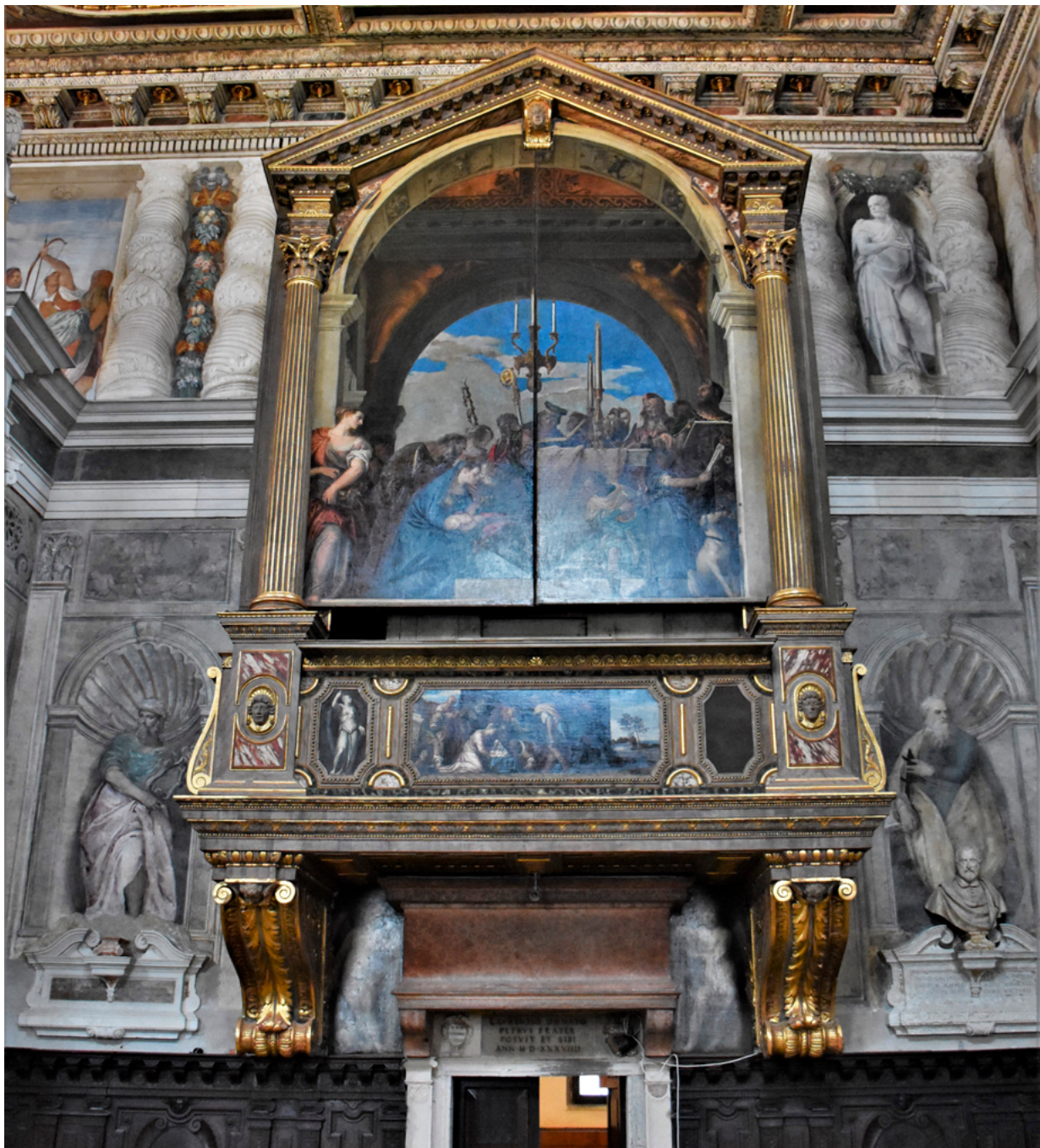
7. Venecija, San Sebastiano, pjevalište i kućište orgulja Venice, church of San Sebastiano, choir and organ casing

unutar drvorezbarske struke i njihovog ceha. 30 Ne treba sumnjati da je i u slučaju vrbničke edikule posao bio podijeljen između majstora drvodjelca, skulptora rezbara i majstora koji je izvršio skupocjen i delikatan proces pozlate retabla i polikromije na kipovima. U nedostatku dokumenata te s obzirom na prosječnost figuralne dekoracije, nemoguće je pobliže govoriti o autoru ili radionici oltara u Vrbniku. Možemo tek pretpostaviti da je rad bio podijeljen na više različitih osoba, ne računajući izradu oltarne slike. Jedan je majstor, marangone , mogao raditi stolarsku konstrukciju, drugi, tornitor , tokarene dijelove