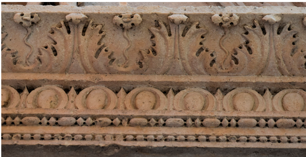
7. Šibenik, crkva sv. Ivana, južno pročelje, vijenac renesansnog prozora, N. Firentinac (1475.) Šibenik, church of St John, south façade, Renaissance window cornice, Nicholas of Florence (1475)

od polukružnog vijenca na luneti portala Sv. Eufemije u Splitu s motivom Pietà iz 1465. godine (sl. 6), a zatim se 1475. godine javlja u Šibeniku, na kornišu prozora južnog pročelja crkve sv. Ivana (sl. 7), te odmah pored, na balustradi stubišta istog pročelja, kao zanjihani cvijet bez listova akantusa. Otprilike u istom vremenu majstor ovu kombinaciju cvjetova i akantusovih listova koristi u punijem volumenu i razrađenoj formi na zidovima svojevrsne dekorativno-skulpturalne galerije u kapeli blaženog biskupa Ivana Trogirskog (Ursinija) čija je gradnja započeta 1468. godine. 17 Tu su nizovi ovih ornamenata raspoređeni duž glavnog vijenca koji nose anđeli telamoni , a prostiru se preko svih stranica kapele te se nastavljaju preko ulaznih pilastara (sl. 8 a i 8 b). Njihova je modelacija naglašena, a oblici su klasično i jasno rezani, s dubljim sjenama i svjetlijim akcentima dok su facete završnih, kliznih udaraca ravnim dlijetom, lako uočljive. Listovi akantusa masivniji su i znatno izdvojeni od podloge, središnji se vrh lista presavija dublje u prostor, a zanjihani cvjetovi u visokom reljefu krupniji su te su njihove četiri laticice oblikovane zasebno i dodatno odvojene izbušenom rupom, dok je stapka čvrsto povezana s listovima kao jedna cjelina.