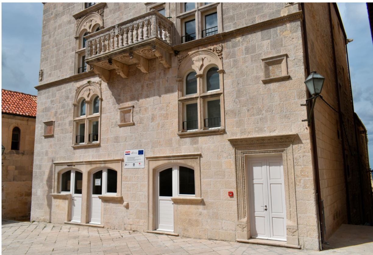
1. Korčula, palača Gabriellis, istočno pročelje, Trg sv. Marka Korčula, Gabriellis Palace, east façade, St Mark's Square

i na otocima, pa je potreba za najboljima, majstorima, naglo porasla. Ako već nije bilo moguće ugovoriti opsežni zahvat obnove ili izgradnje palače, kako je to pošlo za rukom trogirskom patriciju Koriolanu Ćipiku, njegovu prvom meceni i punomoćniku, onda su naručitelji sklopili pogodbe za nešto manje zahtjevna djela, kao što su portali, ili za jednostavnije, ali važne segmente, poput kipova i reljefa.