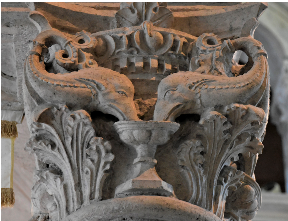
10. Korčula, katedrala sv. Marka, kapitel ciborija, primjer preoblikovanja antičkog ornamenta ovulusa – Marko Andrijić (1486.)

Korčula, cathedral of St Mark, ciborium capital, example of transforming an ancient ovolo ornament, Marko Andrijić (1486)