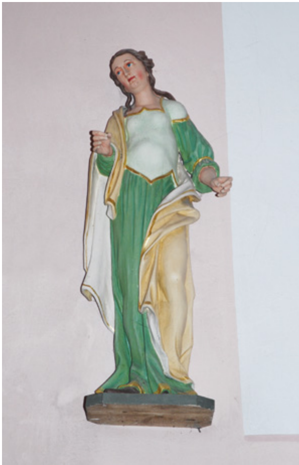
1. Margečan, župna crkva, kip svete Barbare

Margečan, parish church, statue of St. Barbara