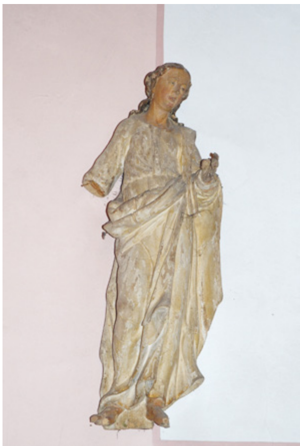
3. Margečan, župna crkva, kip svetog Ivana evanđelista Margečan, parish church, statue of St. John the Evangelist