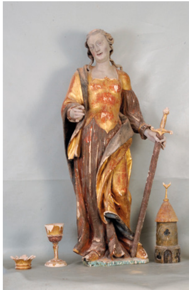
2. Vukovoj, kip svete Barbare prije radova

Margečan, parish church, statue of St. Barbara