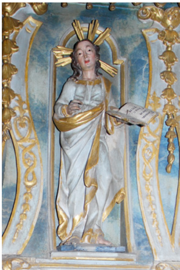
4. Varaždin, uršulinska crkva, propovjedaonica, kip svetog Ivana evanđelista (fototeka HRZ-a, snimila K. Škarić, 2016.) Varaždin, Ursuline Church, pulpit, statue of St. John the Evangelist (Croatian Conservation Institute Photo Archive, photo by K. Škarić, 2016)

prepoznatljivi pramenovi kose koji se odvajaju od vrata mogu se vidjeti na obje skulpture.