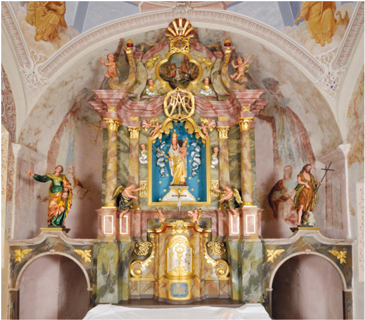
12. Radovan, kapela Blažene Djevice Marije, glavni oltar

Radovan, chapel of the Blessed Virgin Mary, main altar