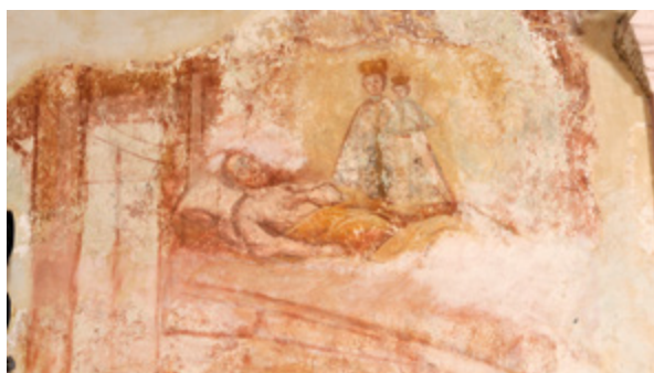
16. Radovan, kapela Blažene Djevice Marije, zidna slika, prikaz Majke Božje uz bolesnika Radovan, chapel of the Blessed Virgin Mary, wall painting depicting Virgin Mary next to a sick man