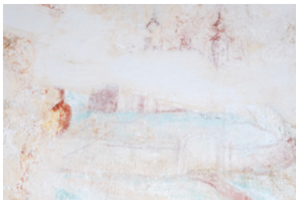
15. Radovan, kapela Blažene Djevice Marije, zidna slika, prikaz crkve s cinktorom Radovan, chapel of the Blessed Virgin Mary, depiction of the church with the colonnaded pathway