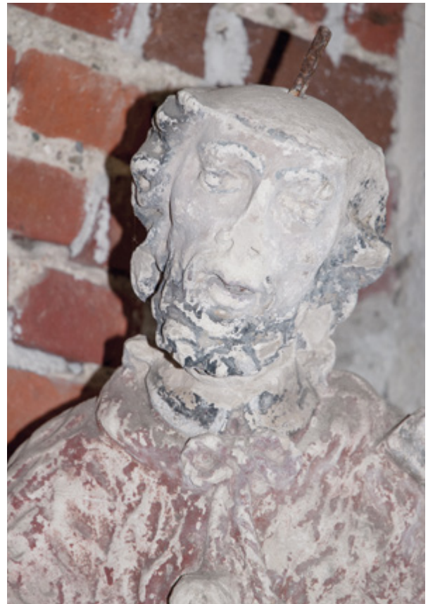
6. Gradski muzej Varaždin, Kulturno-povijesni odjel, kameni kip svetog Ivana Nepomuka, inv. br. GMV KPO 83o8

Varaždin City Museum, Culture and History Department, stone statue of St. John of Nepomuk, inv. no. GMV KPO 83o8