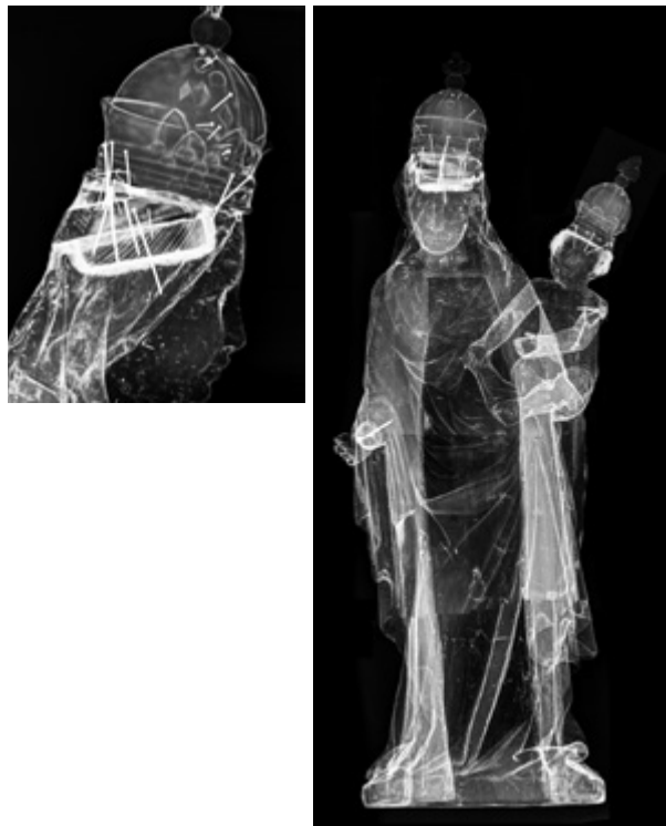
10. - 11. Kip Majke Božje Radovanske, rendgenska snimka Bogorodičine glave i spojene rendgenske snimke Statue of Our Lady of Radovan, x-ray image of the Virgin's head and x-ray images joint together