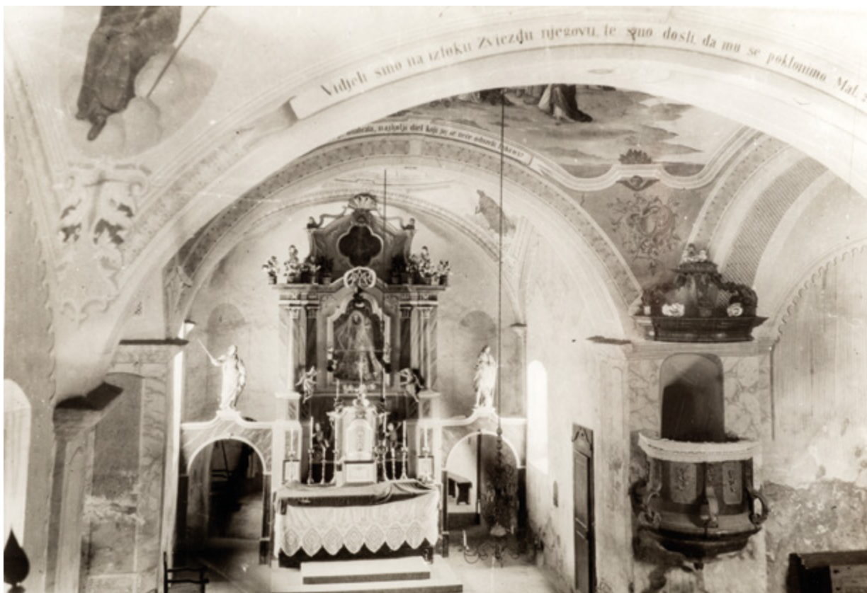
17. Radovan, kapela Blažene Djevice Marije, glavni oltar (fototeka Doris Baričević, snimio G. Szabo, 1913.) Radovan, chapel of the Blessed Virgin Mary, main altar (Photo Archive of Doris Baričević, photo by G. Szabo, 1913)

nekoliko se mjesta smještaj kapele bilježi kao „in monte Radovan“, čime se ističe malo povišen položaj u odnosu na okolni prostor. S novom pobožnošću ta se crkva namjeravala promaknuti u župnu, ali se to nije dogodilo. 37