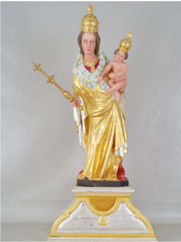
7. Radovan, kip Majke Božje s oslikom iz 1997. godine nakon radova Radovan, statue of Our Lady with the 1997 polychromy, after conservation