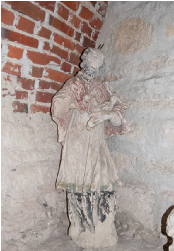
5. Gradski muzej Varaždin, Kulturno-povijesni odjel, kameni kip svetog Ivana Nepomuka, inv. br. GMV KPO 83o8

Varaždin City Museum, Culture and History Department, stone statue of St. John of Nepomuk, inv. no. GMV KPO 83o8