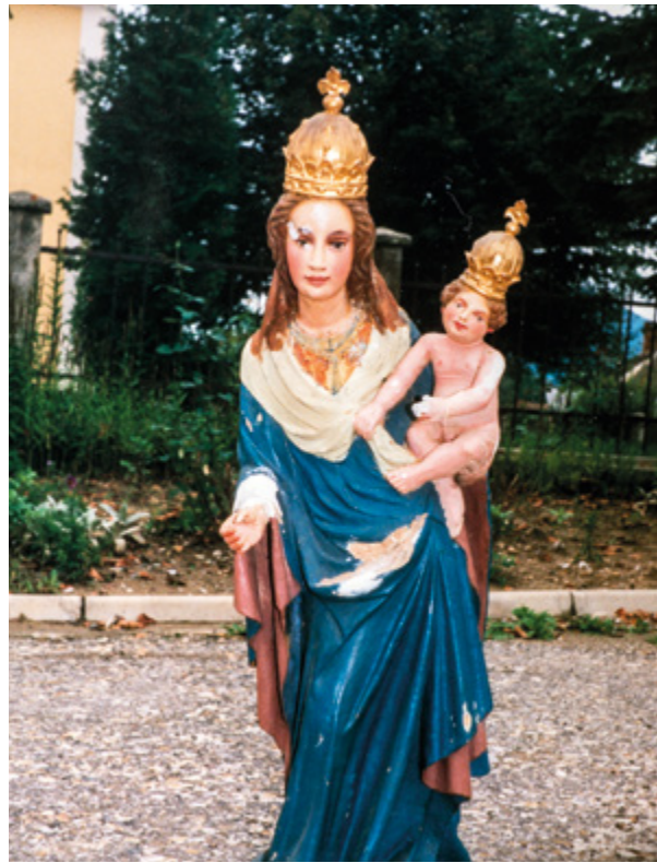
8. Radovan, kip Majke Božje prije obnove Radovan, statue of Our Lady before renovation