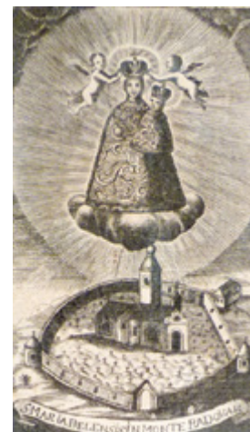
13. - 14. Gradski muzej Varaždin, Kulturno-povijesni odjel, grafika iz Albuma malih nabožnih sličica uršulinskog samostana, inv. br. GMV KPO 6046, inv. br. GMV KPO 6047 Varaždin City Museum, Culture and History Department, print from the Album of Small Devotional Paintings of the Ursuline Convent, inv. no. GMV KPO 6046, inv. no. GMV KPO 6047