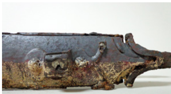
9. Kopča za provlačenje remena A device for pulling the strap