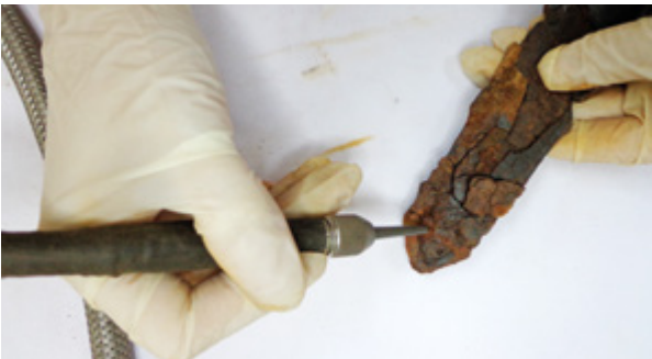
6. Mikropjeskarenje željeznog mača

Removing the products of corrosion with a micro-motor