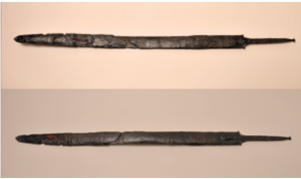
12. Ravni željezni keltski mač nakon provedenih konzervatorsko-restauratorskih radova Straight Celtic iron sword after conservation