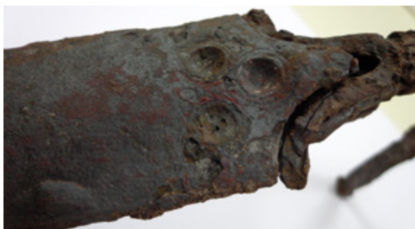
8. Žig na koricama savijenog mača A hallmark on the sheaths of the bent sword