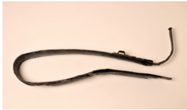
13. Savijeni željezni keltski mač nakon provedenih konzervatorsko-restauratorskih radova Bent Celtic iron sword after conservation

nanesen kistom na površinu keltskih mačeva te je sve ostavljeno da se osuši (sl. 12, 13).