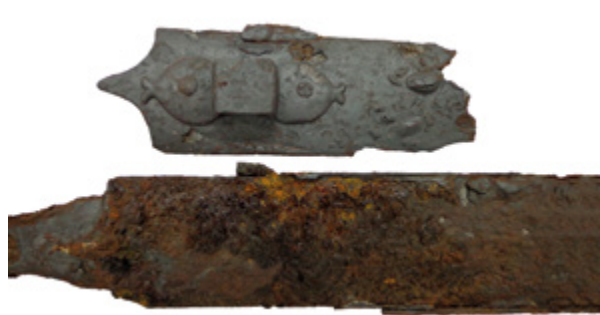
7. Uklanjanje nestabilnih korica; vidljiva je korozivna površina mača (fototeka HRZ-a, snimila E. Perković)

Micro-sandblasting of the iron sword (Croatian Conservation Institute Photo Archive, photo by E. Perković)