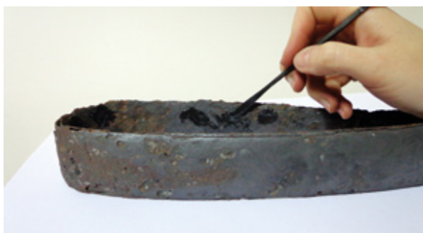
10. Ujednačavanje površine Aralditom 220 Evening the surface with Araldite 220