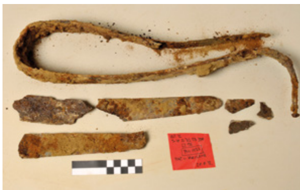
3. Zatečeno stanje savijenog keltskog mača PN= 1132 Pre-existing condition of the bent Celtic sword PN=1132

S obzirom na poznatu činjenicu keltskog ritualnog uništavanja naoružanja savijanjem pri pokapanju mrtvih, mač PN= 1062 relativno je rijedak arheološki nalaz, vrlo zanimljiv. Savijeni mač PN= 1132 svjedoči o navedenom ritualnom uništavanju oružja.