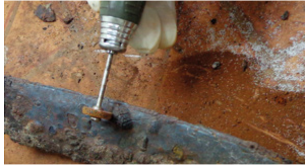
5. Uklanjanje produkata korozije mikromotorom

Visible original layer beneath the products of corrosion