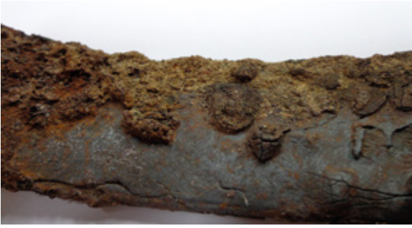
4. Vidljiv originalni sloj ispod produkata korozije

Visible original layer beneath the products of corrosion