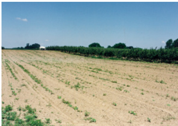
1. Lokalizet Zvonimirovo - Veliko polje (Institut za arheologiju) Zvonimirovo-Veliko Polje site (The Institute of Archaeology)