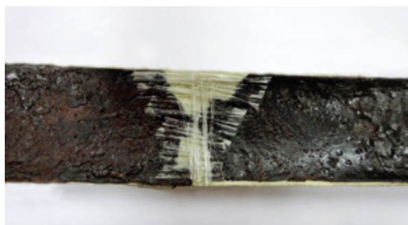
11. Učvršćivanje korica ravnoga mača dodavanjem staklene vune prije nanošenja Araldita 220 Consolidating the sheaths of the straight sword by adding fiberglass before applying Araldite 220

niranjem ukrasa na koricama i žigova (sl. 8) te kopčom za provlačenje remena (sl. 9). To će omogućiti precizniju tipološko-kronološku analizu u obradi nalaza s groblja Zvonimirovo - Veliko polje. Nakon pjeskarenja bilo je moguće utvrditi točne dimenzije željeznih predmeta. Mač PN= 1062 dugačak je 89,6 cm, širok 4,2 cm, debeo 0,3 cm; debljina korica iznosi 0,1 cm. Savijeni mač PN= 1132 savijen je na dužinu od 40 cm, dok su mu sve druge dimenzije jednake prvom maču.