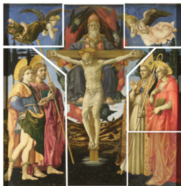
7. Francesco Pesellino, fra Filippo Lippi i radionica, Oltar sv. Trojstva . Razrezani dijelovi pale su tijekom 19. i 20. stoljeća otkupljeni i spojeni u cjelinu. Izgubljeni donji desni dio je rekonstruiran 1929. godine (National Gallery, London and the Royal Collection)

Francesco Pesellino, Fra Filippo Lippi and workshop, The Pistoia Santa Trinità Altarpiece. The severed parts of the altarpiece were collected and brought into a whole during the 19th and 20th century. The lost bottom right portion was reconstructed in 1929 (The National Gallery, London and The Royal Collection)