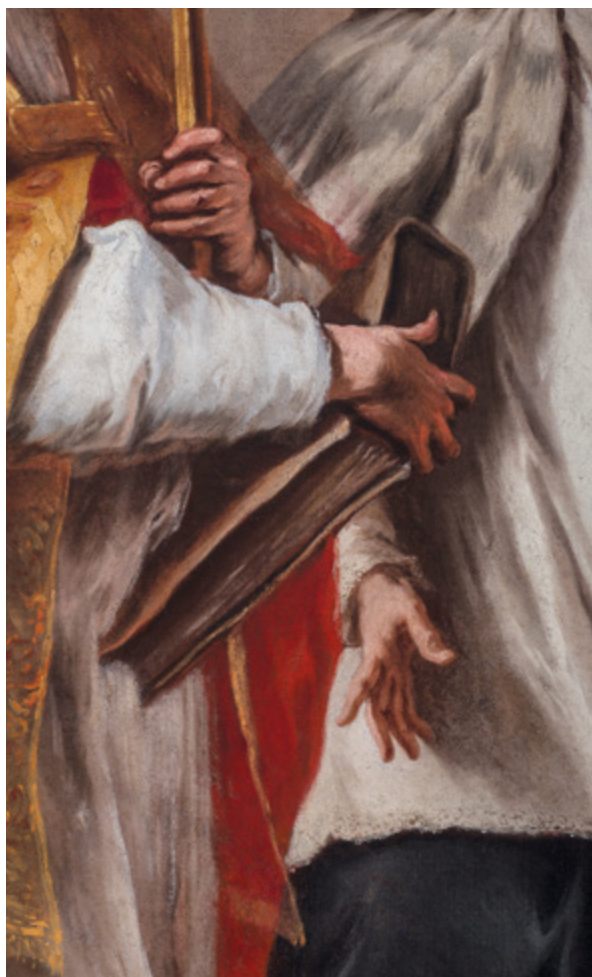
15. - 16. Detalji nakon radova Details after conservation

boje. Stari zakiti su se raspucali, retuši i damar-lak kojim su slike bile lakirane, potamnili i izgubili prozornost, a vezivna snaga voštano-smolne mase za dubliranje popustila. Rastopljena veća količina voštano-smolne mase koja je tijekom dubliranja prošla kroz pukotine s poledine na lice slike, gotovo da i nije bila uklonjena, već je bila prekrivena lakom. Retuš je prekrivao veće, neoštećene zone izvornog slikanog sloja, kao i ostatke voska od dubliranja na licu. Sve tri slike u cjelini su izgledale trošno, ugasla kolorita i umrtvljene slikarske geste čija se živost nazirala pod slojevima lakova, retuša i nečistoće.