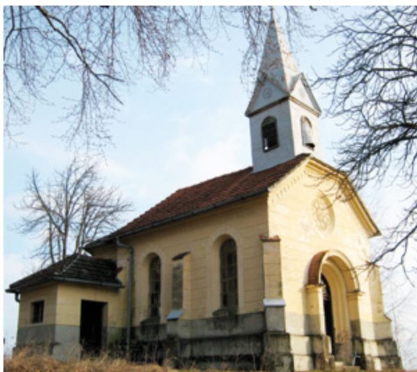
4. Hršak Breg, kapela sv. Antuna Padovanskog, stanje prije radova Hršak Breg, chapel of St. Anthony of Padua, before restoration