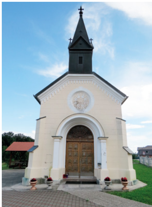
7. Radoboj, kapela sv. Majke Božje Lurdske, pogled na glavno pročelje Radoboj, chapel of Our Lady of Lourdes, view of the main front

živom metodom, jer su izvorna žbuka i boja, zbog lošeg stanja, morale biti gotovo potpuno uklonjene.