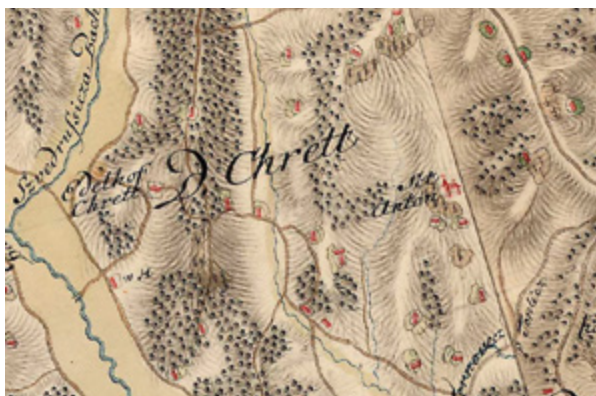
1. Hršak Breg, kapela sv. Antuna Padovanskog - prikaz položaja kapele na topografskoj karti Varaždinske županije iz 1781.-1782. Hršak Breg, chapel of St. Anthony of Padua – the chapel location on the topographic map of the Varaždin County from 1781-1782