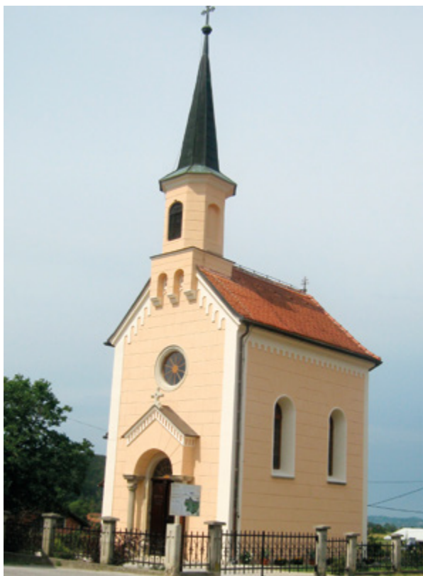
6. Tugonica, kapela sv. Roka Tugonica, chapel of St. Rocco