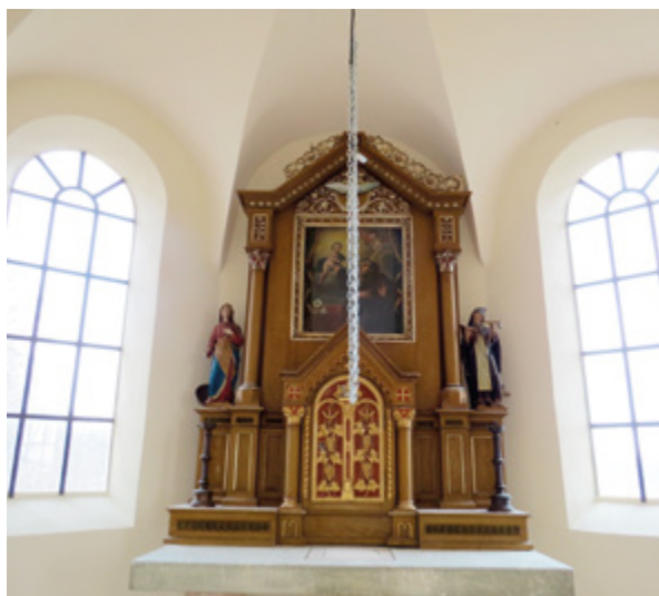
5. Hršak Breg, kapela sv. Antuna Padovanskog, glavni oltar Hršak Breg, chapel of St. Anthony of Padua, the main altar

konstrukcija na pojedinim je mjestima potpuno istrunula, a najveće je oštećenje bilo vidljivo u desnom kutu lađe, ispred svetišta. Stakla na prozorima bila su razbijena pa su oborine izravno prodirale u kapelu, što nije priječilo ni unos smeća i lišća ni ulazak sitnijim životinjama. Crijep je bio u lošem stanju, a vanjskim pregledom moglo se utvrditi da je krovna konstrukcija mjestimice ulegla. Limena oplata zvonika bila je propala i nagrizena korozijom pa ju je trebalo mijenjati. Krovna limarija je bila oštećena, vertikale su bile istrgnute iz ležišta i odvojene od oluka te se oborinska voda nekontrolirano slijevala uz pročelja i ispirala tlo, što je mogao biti uzrok popuštanju i uočenoj pukotini u nadvoju sakristijskih vrata. Naposljetku, ustanovljeno je da je opće građevinsko stanje kapele solidno, ali je narušeno utjecajem vlage i oborinske vode te s njima povezanim procesima.