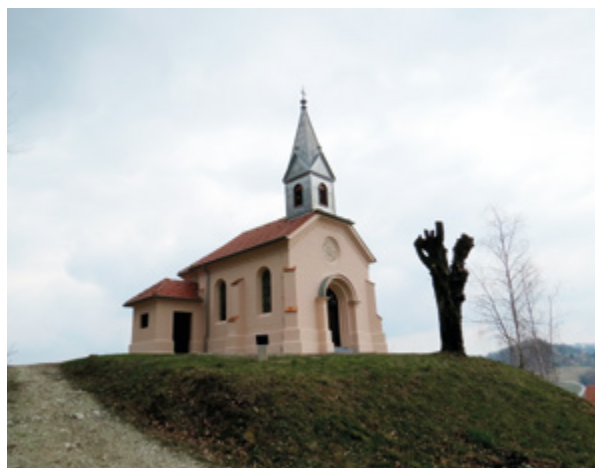
15. Hršak Breg, kapela sv. Antuna Padovanskog, nakon radova obnove (fototeka Konzervatorskog odjela u Krapini, 2016.) Hršak Breg, chapel of St. Anthony of Padua, after restoration (Photo Archive of the Conservation Department in Krapina, 2016)

čuvanje načina i tradicije bojenja/premazivanja pročelja, čime već zalazimo u područje očuvanja nematerijalne kulturne baštine. Primjenom silikatne boje u istom slučaju, neće biti zadovoljen ni kriterij autentičnosti ni kriterij reverzibilnosti.