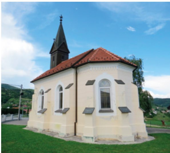
9. Radoboj, kapela sv. Majke Božje Lurdske, pogled na začelje kapele Radoboj, chapel of Our Lady of Lourdes, view of the rear of the chapel