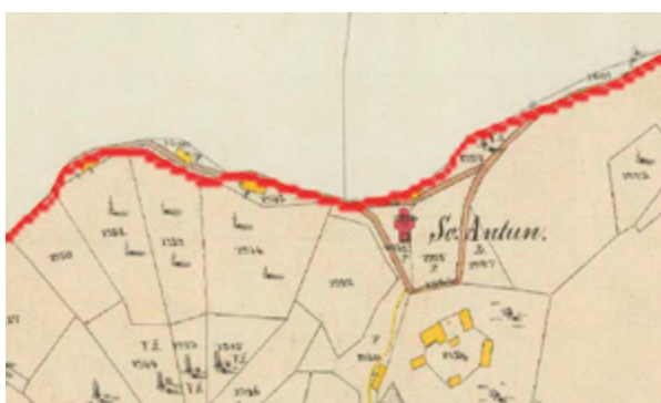
2. Hršak Breg, kapela sv. Antuna Padovanskog - prikaz kapele na katastarskoj karti iz 1861. Hršak Breg, chapel of St. Anthony of Padua – the chapel shown on a cadastral map from 1861