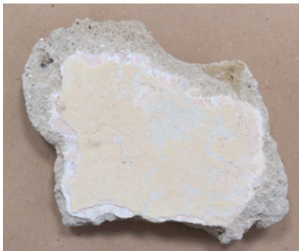
12. Uzorak žbuke na kojem se ispod recentnog sintetskog oker naliča nazire svijetlopljavo ružičasti izvorni nalič Sample of plaster on which, beneath the original synthetic ochre paint, a light dirty pink original paint is observed