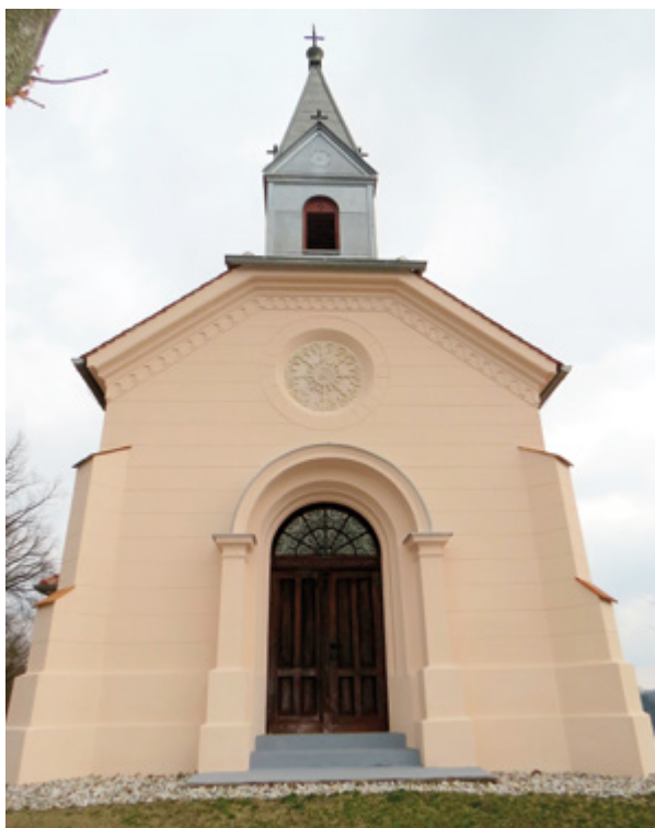
8. Hršak Breg, kapela sv. Antuna Padovanskog, pogled na glavno pročelje, nakon radova obnove (fototeka Konzervatorskog odjela u Krapini, 2016.)

Hršak Breg, chapel of St. Anthony of Padua, view of the main front, after restoration (Photo Archive of the Conservation Department in Krapina, 2016)