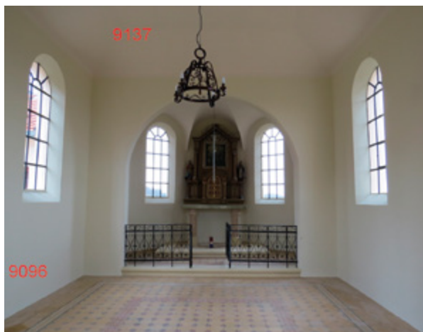
14. Hršak Breg, kapela sv. Antuna Padovanskog, unutrašnjost nakon radova (fototeka Konzervatorskog odjela u Krapini, 2016.) Hršak Breg, chapel of St. Anthony of Padua, interior after restoration (Photo Archive of the Conservation Department in Krapina, 2016)