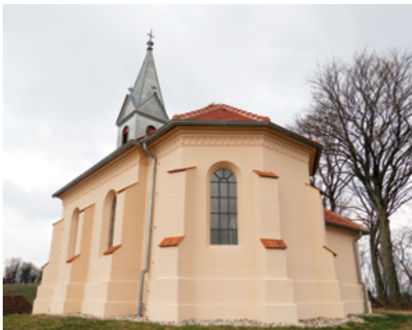
10. Hršak Breg, kapela sv. Antuna Padovanskog, pogled na začelje kapele, stanje nakon radova (fototeka Konzervatorskog odjela u Krapini, 2016.) Hršak Breg, chapel of St. Anthony of Padua, view of the rear of the chapel, after restoration (Photo Archive of the Conservation Department in Krapina, 2016)

replicirati oni povijesni oslici čija se prezentacija kritičkom interpretacijom utvrdi opravdanom.