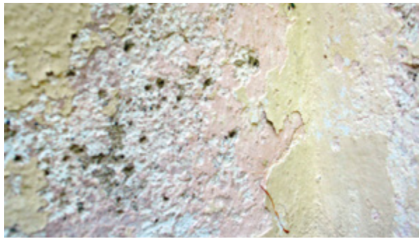
11. Detalj zida - ispod recentnog sintetskog oker naliča nazire se svijetlopljavo ružičasti prvotni nalič nanesen na izvornu žbuku, in situ Detail of the wall – beneath a recent synthetic ochre paint, a light dirty pink original paint is observed, applied over the original plaster, in situ

Ako je završnoj obradi površina zidova, bilo unutar-njih ili vanjskih, zbog trusnosti, neprianjanja uz podlogu, umanjene čvrstoće zbog djelovanja vlage ili bilo kojeg drugog opravdanog razloga, prethodilo uklanjanje izvorne ili zatečene žbuke te je ona morala biti potpuno zamijenjena novom, tada ireverzibilnost silikatnih ili vapnenih boja neće biti konzervatorski problem, jer se radi o novoj podlozi. No ako se izvorna žbuka nastoji očuvati, pri donošenju odluke o vrsti boje koju ćemo primijeniti moramo uzeti u obzir oba čimbenika - i autentičnost i reverzibilnost. Znamo li da je izvorna vapnena žbuka bila premazana vapnenim naličem, ponavljanje istovrsnog naliča, pripremljenog na „povijesni“ način osiguralo bi ako ne doslovce samu autentičnost (jer materijal više nije onaj isti izvorni, sjetimo se trulih dasaka Tezejeva broda!), a ono barem kontinuiranje autentičnosti, odnosno