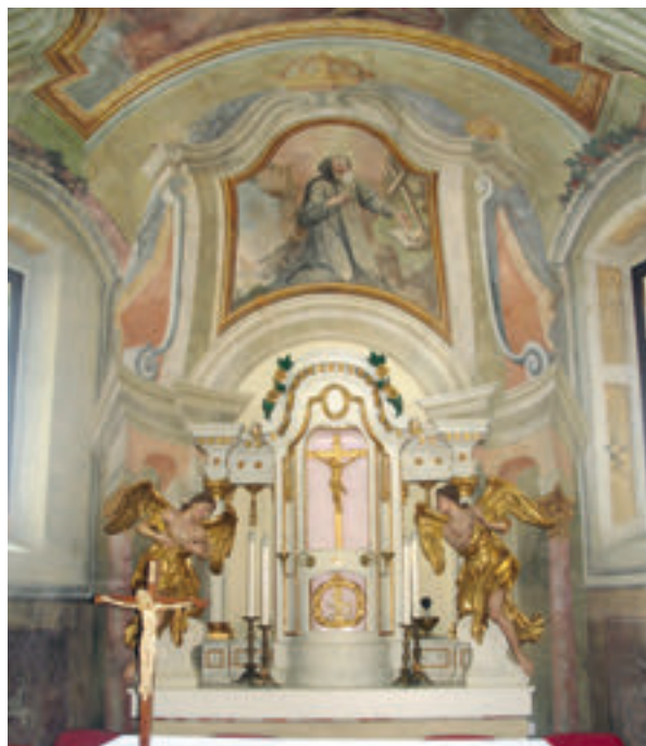
2. Slavetić, župna crkva sv. Antuna pustinjaka, pogled na glavni oltar, stanje 2014. godine.

Slavetić, the parish church of St. Anthony the Hermit, view of the main altar, condition in 2007