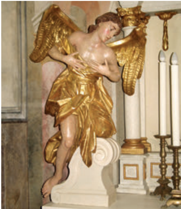
4. Slavetić, župna crkva sv. Antuna pustinjaka, glavni oltar, lijevi kip anđela adoranta iz 1791. godine.

Slavetić, the parish church of St. Anthony the Hermit, the main altar, the left statue of an adoring angel, 1791