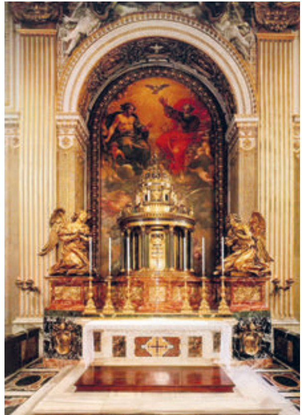
9. Rim, bazilika sv. Petra, oltar Presvetog Sakramenta, Gian Lorenzo Bernini, 1673/4. godine. Rome, St. Peter's Basilica, the Altar of the Most Holy Sacrament. G. L. Bernini, 1673/4

Prisutnost anđela uz svetohranište imala je, dakle, potporu u brojnim referencama iz svetih spisa i teoloških učenja, a izravni likovni prethodnici Berninijeva projekta su oltar Presvetog Sakramenta u kapeli pape Siksta V. u Santa Maria Maggiore u Rimu, u čijem središtu četiri stojeća brončana anđela nose model oktogonalne crkve (projekt Domenico Fontana, kipar Sebastiano Torregiani, 1585. godine). Bernini je svakako bio upoznat i sa starijim glavnim oltarom u milanskoj katedrali (Pellegrino Tibaldi, 1581. godine), rađenim uz savjetodavni upliv samoga Karla Boromejskog, gdje unutar visokog tempietta četiri klečeća anđela nose svetohranište. 43 Nacrti prvotnog projekta upućuju na to da se Bernini nadahnio starijim uzorima, namijenivši anđelima ulogu nosača i svetohraništa i svijećā. Na kraju se ipak odlučio za posve novu kompozicijsku i ikonografsku temu; veliki poklekli anđeli klanjaju se svetohraništu u obliku tempietta , 44 „(...) oslobađajući anđele svih praktičnih dužnosti kako bi, predani svojim osjećajima, promišljali o radosti i divljenju euharistijskog čuda sadržanog u svetohraništu“. 45 „Spuštanjem“ anđela u taj niži položaj ostvarena je vizualno uspješnija