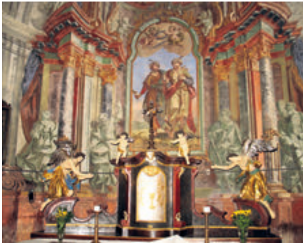
8. Kuzminec, župna crkva Sv. Kuzme i Damjana, glavni oltar, prije 1778. godine.

Kuzminec, the parish church of Sts. Cosmas and Damian, the main altar, before 1778