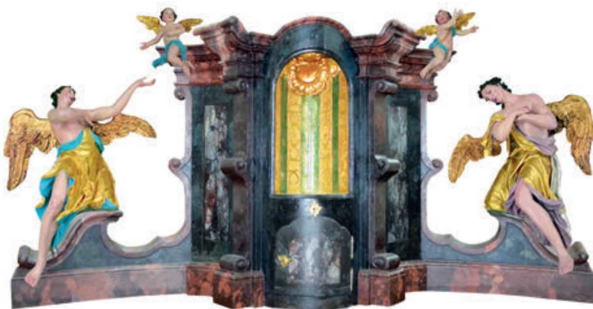
6. Koprivnički Ivanec, župna crkva sv. Ivana Krstitelja, glavni oltar, između 1768. i 1778. godine, fotomontaža obnovljenog oltara (fototeka Hrvatskog restauratorskog zavoda, Restauratorski centar Ludbreg, 2014. godine). Koprivnički Ivanec, the parish church of St. John the Baptist, the main altar, around 1778, photomontage of the altar after conservation (photo by Ludbreg Conservation Centre, 2014)