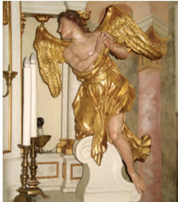
5. Slavetić, župna crkva sv. Antuna pustinjaka, glavni oltar, desni kip anđela adoranta iz 1791. godine.

Slavetić, the parish church of St. Anthony the Hermit, the main altar, the left statue of an adoring angel, 1791