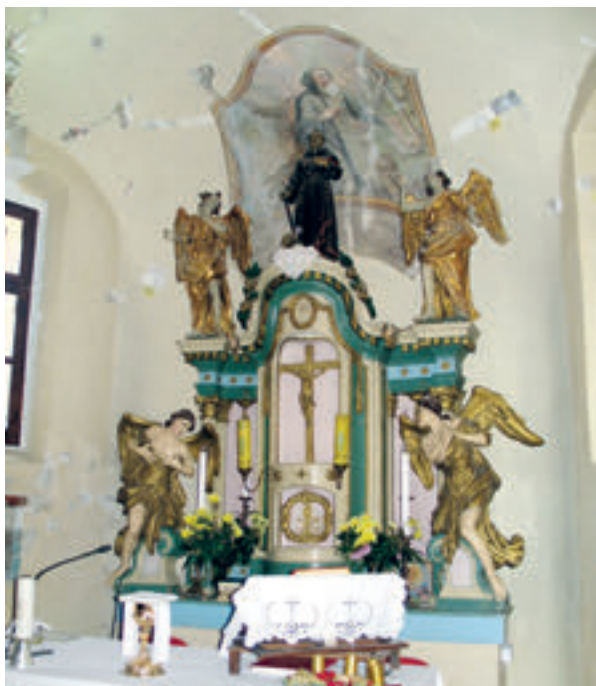
1. Slavetić, župna crkva sv. Antuna pustinjaka, pogled na glavni oltar, stanje 2007. godine.

Slavetić, the parish church of St. Anthony the Hermit, view of the main altar, condition in 2007