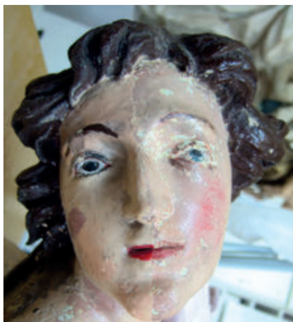
7. Slavetić, župna crkva sv. Antuna pustinjaka, desni kip anđela adoranta, detalj tijekom konzervatorsko-restauratorskih zahvata (snimio RE-Dizajn, 2010. godine). Slavetić, the parish church of St. Anthony the Hermit, the right statue of an adoring angel, detail in the course of conservation (photo by RE-Dizajn, 2010)

završena tek 1673./74. godine u vrijeme pontifikata pape Klementa X. Altierija (1670.-1676.). 35 U kapeli je već bila postavljena slika „Presveto Trojstvo“ Pietra da Cortone