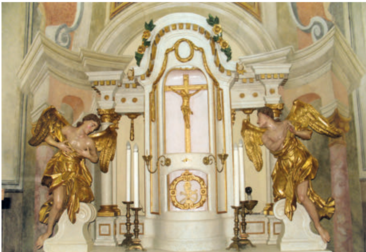
3. Slavetić, župna crkva sv. Antuna pustinjaka, glavni oltar iz 1791. godine. Slavetić, the parish church of St. Anthony the Hermit, the main altar, 1791

te oprečne tendencije pridonose aktiviranju cijele figure i njezine prostorne ekspresivnosti. Dlanovi su približeni, ali ne i spojeni do kraja, već se samo jagodice vitkih prstiju dodiruju, kao da je pokret zaustavljen u trenutku, iščekujući razrješenje u konačnom smiraju. I njegovo lice odražava blagu uznemirenost potenciranu odlučno uprtim pogledom i lagano razmaknutim usnicama, za razliku od lijevog anđela, na čijem se licu razabire spokojni emotivni naboj dubokog predanja. Na lijevom anđelu je i gibanje tijela građeno smirenije, a pognuta glava na glatkom cilindru vrata intenzivira „S“ krivuljnu siluetu figuralne cjeline (sl. 4). Naprezanje tjelesne mase i nabujali nabori tkanine stvaraju promjenjive vizure s različitih točki gledišta te ističu dinamizam skulpturalne koncepcije, ukazujući na znalačko umijeće vrsnoga majstora. Autorstvo, za sada, nije arhivski potvrđeno, no Doris Baričević u skulpturama anđela prepoznala je „tipološku blizinu“ 15 jednog od najistaknutijih mariborskih kipara druge polovice XVIII. stoljeća, Jožefa Holzingera (Limbuš kod Maribora, 1735. - Maribor, 1797.). 16 Slavetički kipovi, naročito impostacija i znalačka vještina dinamičke modelacije volumena tijela i draperije, odražavaju odlike Holzingerova duktusa, premda fizionomija desnoga anđela slabijom izvedbom sugerira moguću prisutnost neznanoga suradnika kojemu je povjeren taj zadatak, s obzirom na to da lice ionako nije