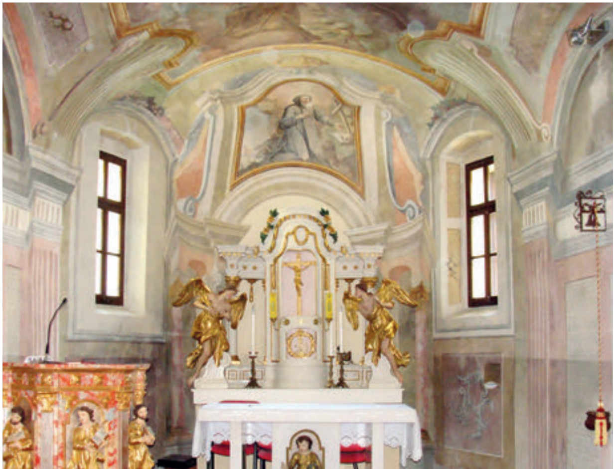
1. Svetište župne crkve sv. Antuna pustinjaka u Slavetiću. Sanctuary of the parish church of St. Anthony the Hermit in Slavetić

je, povisuje i prošupljuje (sl. 1). Na središnjem dijelu zaključnoga zida naslikan je retabl oltara, čiji se tanki i vitki stupovi uzdižu bočno od menze, skladno vizualno rubecći drveni tabernakul oltar. Stupovi nose gređe koje je izrazito blisko upravo onome s tabernakul oltara – srodno je profilirano, s polukružno povijenim segmentom u sredini. Nad gređem se uzdiže visoka atika koju gotovo u cijelosti ispunjava iluzionirana slika s prikazom sv. Antuna pustinjaka (opata), u sivom monaškom habitu s kukuljicom na glavi, pokleknutoga unutar pustinjačkoga pejzaža. Na stijeni njemu slijeva nalaze se otvorena Knjiga, drveni križ i lubanja, a iza njega zdesna nalazi se svinja, koja simbolizira demone požude i proždrljivosti te je znak svečeve pobjede nad kušnjama i grijehom, kao i njegove uloge zaštitnika stoke. 5 Na vrhu atike je zlatna kruna ispod koje se bočnim stranama atike razastire tkanina svečanoga zastora. Vizualna uklopljenost drvenog tabernakul oltara s iluzioniranim retablom očituje se ne samo u njegovim odmjerenim dimenzijama spram oslika nego i u oblikovnim karakteristikama, u kojima oslik prepoznajemo kao svojevrsni slikani okvir drvenom oltaru. Bitno je pritom naznačiti da je izvorno oltarna menza bila udaljena od začelnoga zida pa se oko oltara moglo obilaziti. 6 Bez