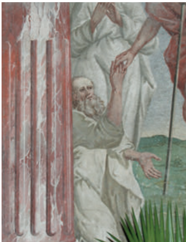
9. Antun Archer (pripisano), Krist u limbu (detalj), 1787., kapela sv. Križa, župna crkva sv. Ivana Krstitelja, Zagreb.

Antun Archer (attributed to), Christ in Limbo (detail), 1787, the Holy Cross Chapel, the parish church of St. John the Baptist, Zagreb