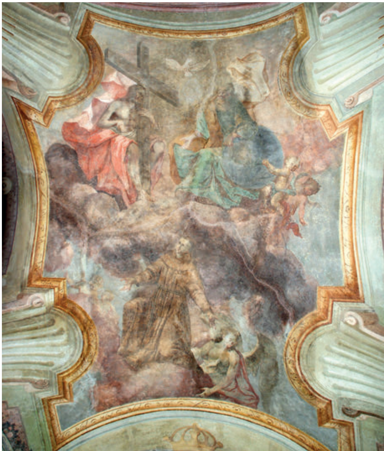
2. Antun Archer (pripisano), Sv. Antun Padovanski u slavi i Presveto Trojstvo, zadnje desetljeće 18. st., župna crkva sv. Antuna Pustinjaka, Slavetić.

Antun Archer (attributed to), St. Anthony of Padua in Glory and the Most Holy Trinity, in the 1790s, the parish church of St. Anthony the Hermit, Slavetić