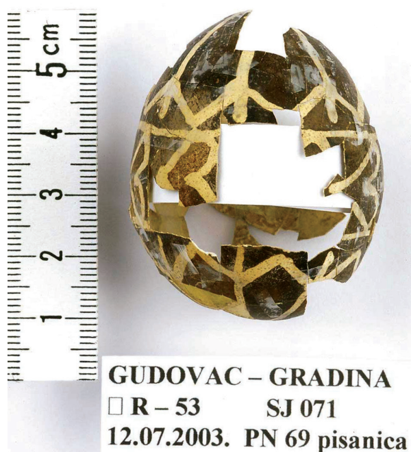
2. Pisanica nakon spajanja ulomaka u cjelinu

Easter egg after joining its pieces together