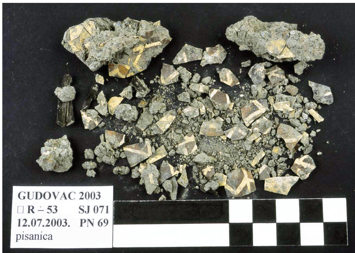
1. Zatečeno stanje pisanice.

Easter egg prior to conservation and restoration