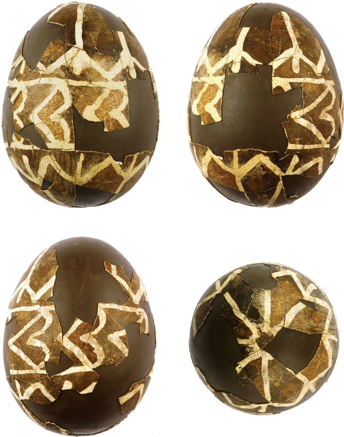
4-7. Restaurirana pisanica, pogledi sa strane i pogled odozgo Restored Easter egg, side view and top view