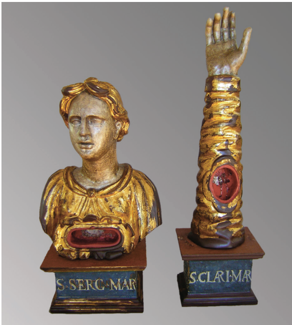
8. Relikvijari Sv. Sergije i Sv. Klare tijekom nanošenja polimenta St. Clare's and St. Sergius's reliquary during poliment application

vlastite prosudbe te nema mjesta toleriranju kreacije umanjene razumljivosti. 8 Potrebno je, međutim, umjetninu sagledati i u prvotnoj svrsi, u ovom slučaju kao sakralnog predmeta. Povijesna (možemo reći dokumentarna) vrijednost je na ovom primjeru hvarskih relikvijara neupitna.