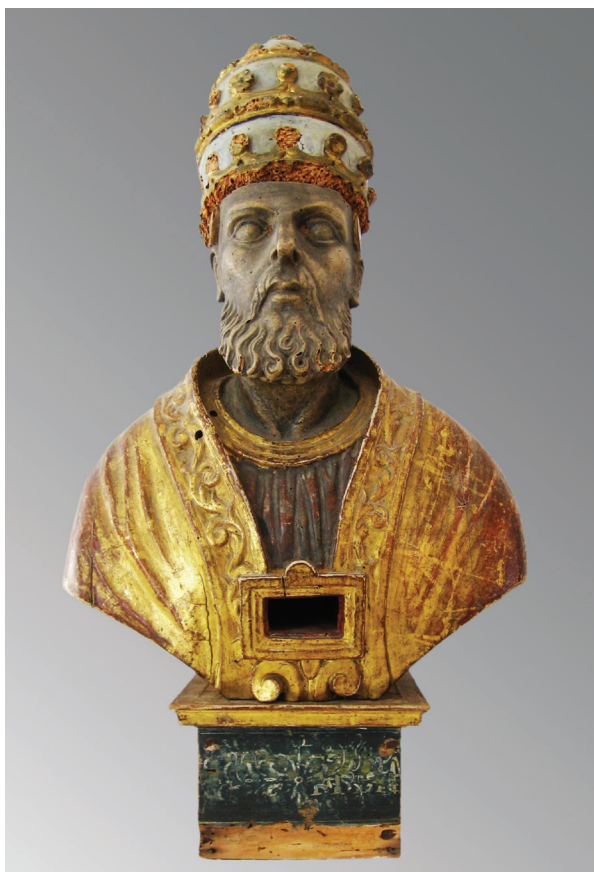
6. Relikvijar Sv. Stjepana Pape, zatečeno stanje The reliquary of Pope St. Stephen, state found

likvijaju i lijevi komad ramena), mitre koja je načinjena od jednog komada i postamenta. Na postamentu nije sačuvan cjelovit natpis. Vidljiva su samo dva slova: s i p. Glava je izrezbarena od jednog komada, s istacima koji omogućavaju sigurnije fiksiranje mitre. Vrat je lagano istaknut prema van, s naznačenom kovrčavom kosom na stražnjem dijelu, izraženim vratnim žilama i Adamovom jabučicom. Srebrni sloj na licu i na prsnom košu sačuvan je u tragovima. Na stražnjem dijelu je otvor za pohranu relikvija.