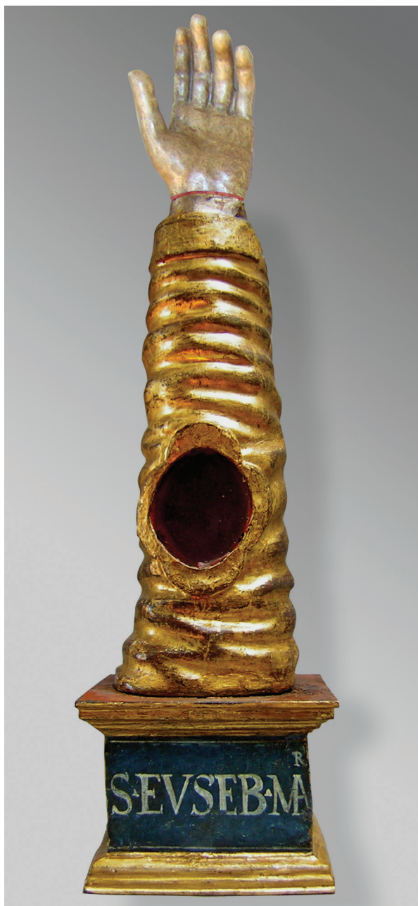
14. Fotomontaža izgleda rekonstrukcije šake relikvijara Sv. Eusebija izvedena u drvu s namjerom nedovršena dojma (snimila i izradila I. N. Unković)

Photomontage of the wood reconstruction of the fist of St. Eusebius's reliquary with the intention of achieving an unfinished feel (made by I. N. Unković)