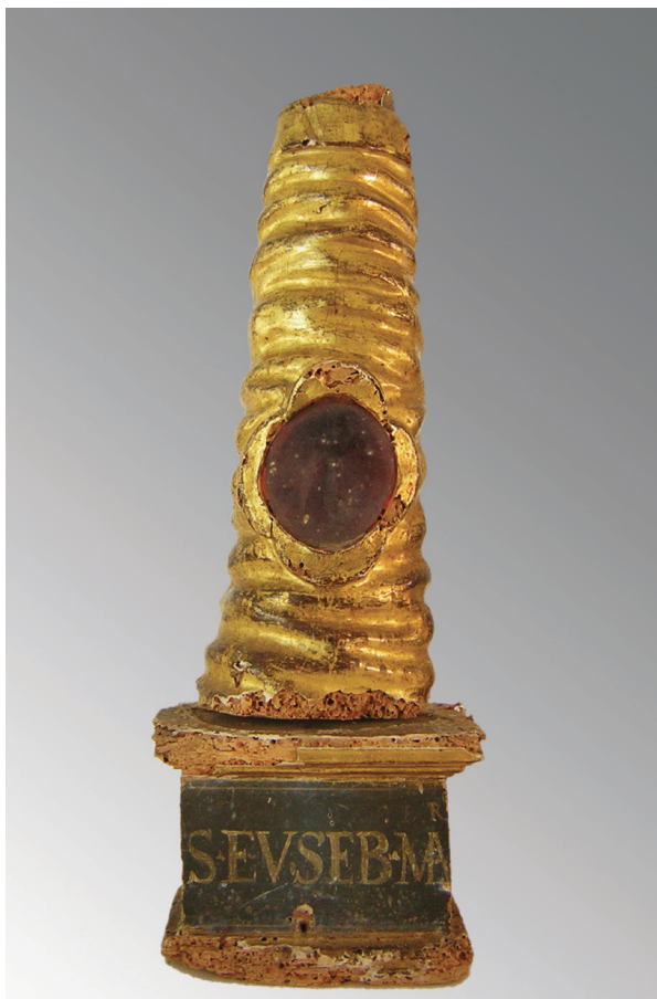
1. Relikvijar Sv. Eusebija, zatečeno stanje

St. Eusebius's reliquary, state found