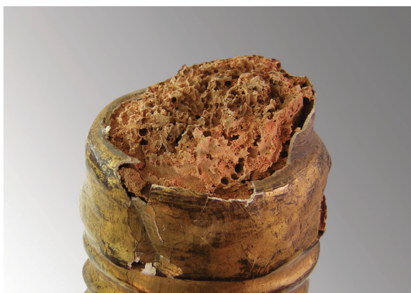
2. Detalj oštećenja relikvijara Sv. Eusebija, zatečeno stanje (fototeka HRZ-a, snimila I. N. Unković)

Relikvijari se ističu kvalitetnom rezbarijom, ali i datacijom. Točnije, Cvito Fisković ih indirektno datira u početak 18. stoljeća, navodeći popis hvarskog inventarija iz 1708. godine 5 .