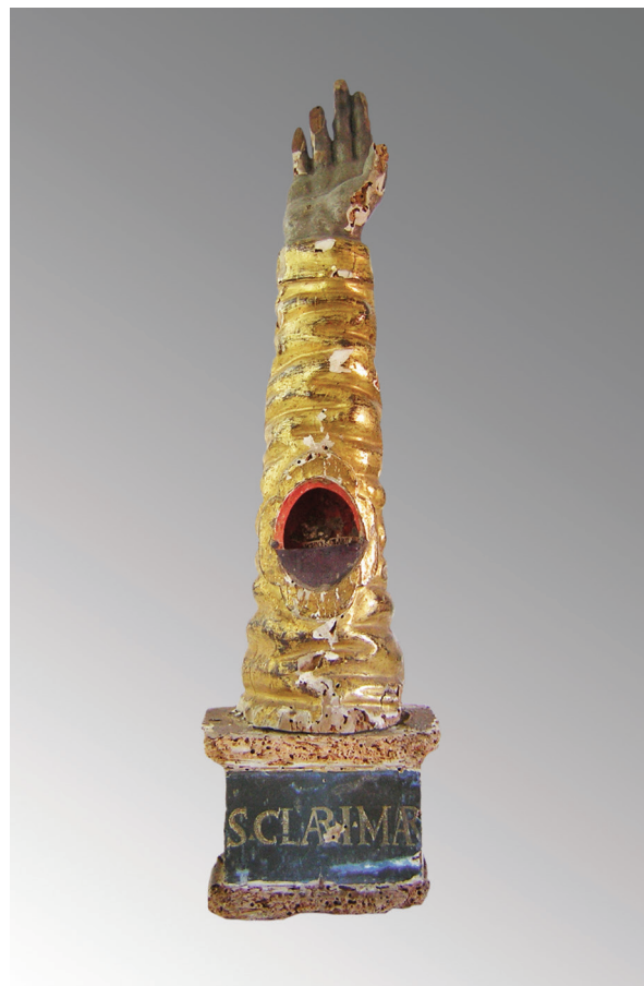
3. Relikvijar Sv. Klare, zatečeno stanje

St. Eusebius's reliquary, detail, state found