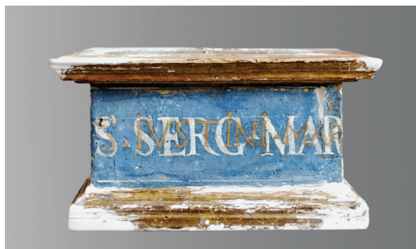
7. Postament relikvijara Sv. Sergija, tijekom restauratorskog postupka vidljiva su oba natpisa (fototeka HRZ-a, snimila I. N. Unković) The base of St. Sergius's reliquary during the restoration process, both inscriptions are visible, (Croatian Conservation Institute Photo Archive, photo by I. N. Unković)

Relikvijari su podvrgnuti uklanjanju završnog premaza i površinske prljavštine. Na postamentima su prezentirana oba natpisa, i to tako da podno natpisa s. IVSTINIMAR izviru originalni natpisi s. GREGORII. MAR i s. SERG MAR S. Uklonjen je svijetloplavi preslik s mitre sv. Stjepana pape. Zahvaljujući tom postupku, otkriven je sloj polimenta i tragovi srebrnih listića. Nakon konsolidacije slojeva polikromije i drvenog nosioca, pristupilo se parcijalnoj rekonstrukciji na dijelovima na kojima je to bilo potrebno, ponajprije radi statičke stabilnosti, a djelomično i estetike. Tako su u drvu lipe rekonstruirani rubovi mitre, nedostajući prsti šake relikvijara sv. Klare, dok su kitom rekonstru-