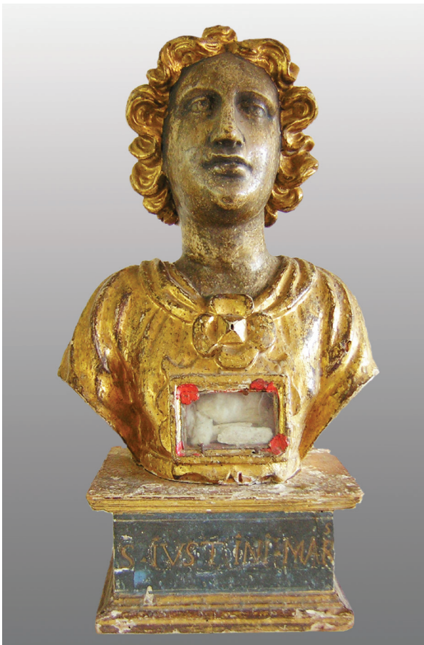
4. Relikvijar Sv. Grgura, zatečeno stanje

St. Gregory's reliquary, state found