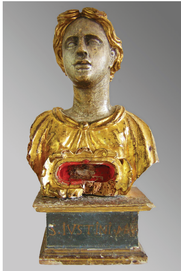
5. Relikvijar Sv. Sergija, zatečeno stanje

St. Gregory's reliquary, state found