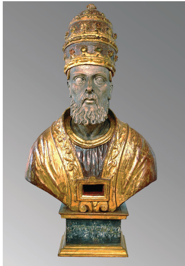
9. Relikvijar Sv. Stjepana Pape nakon dovršetka konzervatorsko-restauratorskog zahvata The reliquary of Pope St. Stephen after the completion of conservation and restoration interventions

Svjesni smo da su konzervatori-restauratori često odgovorni za to kako će drugi ljudi (moći) prosuđivati umjetničko djelo; nikad se ne smije zaboraviti da ljudi gledaju umjetničko djelo da bi vidjeli umjetnikovu kreaciju (koliko god je to moguće), a ne da bi gledali uradak konzervatora-restauratora. 10 Teme o kojima se uvijek intenzivno raspravlja, pa se čak zbog njih i verbalno ratuje, odnose se na to koliko će se restauratorsko-konzervatorskim radovima posegnuti duboko u reintegraciju nedostajućih dijelova i u rekonstrukciju. Potrebno je stoga pronaći ravnotežu između različitih vrijednosti i konzervatorsko-restauratorskog pristupa. To implicira da konzervator-restaurator, nakon što pozorno razmotri postojeće probleme, odmjeri relevantnost vrijednosti i namjera koje mogu biti u sukobu. Interpretacije, osobito one koje ovise o individualnoj estetskoj prosudbi, također neizbježno sadrže subjektivni element. Zbog toga su potrebne konzultacije tijekom odluka o prirodi intervencije. Alessandra M. Vaccaro smatra da prije nego što se pita kako konzervirati-restaurirati, treba pitati što konzervirati-restaurirati i za koga. 11 Traženje