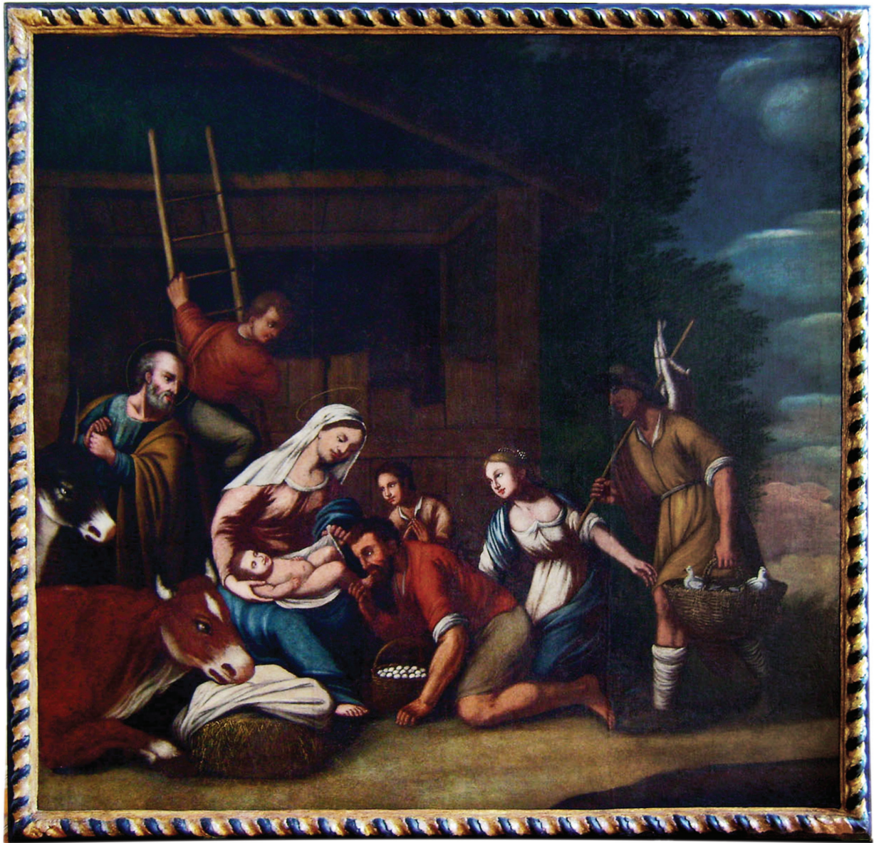
10. Slika Poklonstvo pastira s ukrasnim okvirom, nakon konzervatorsko-restauratorskog zahvata Painting Adoration of the Shepherds with the decorative frame, after the conservation-restoration intervention

prezentacije, ali izlažem, u kratkim crtama, sljedeća dva problema: