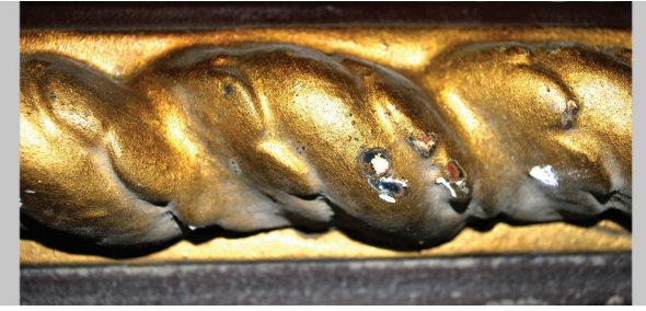
4. Detalj drugog preslika Detail of the second layer of paint