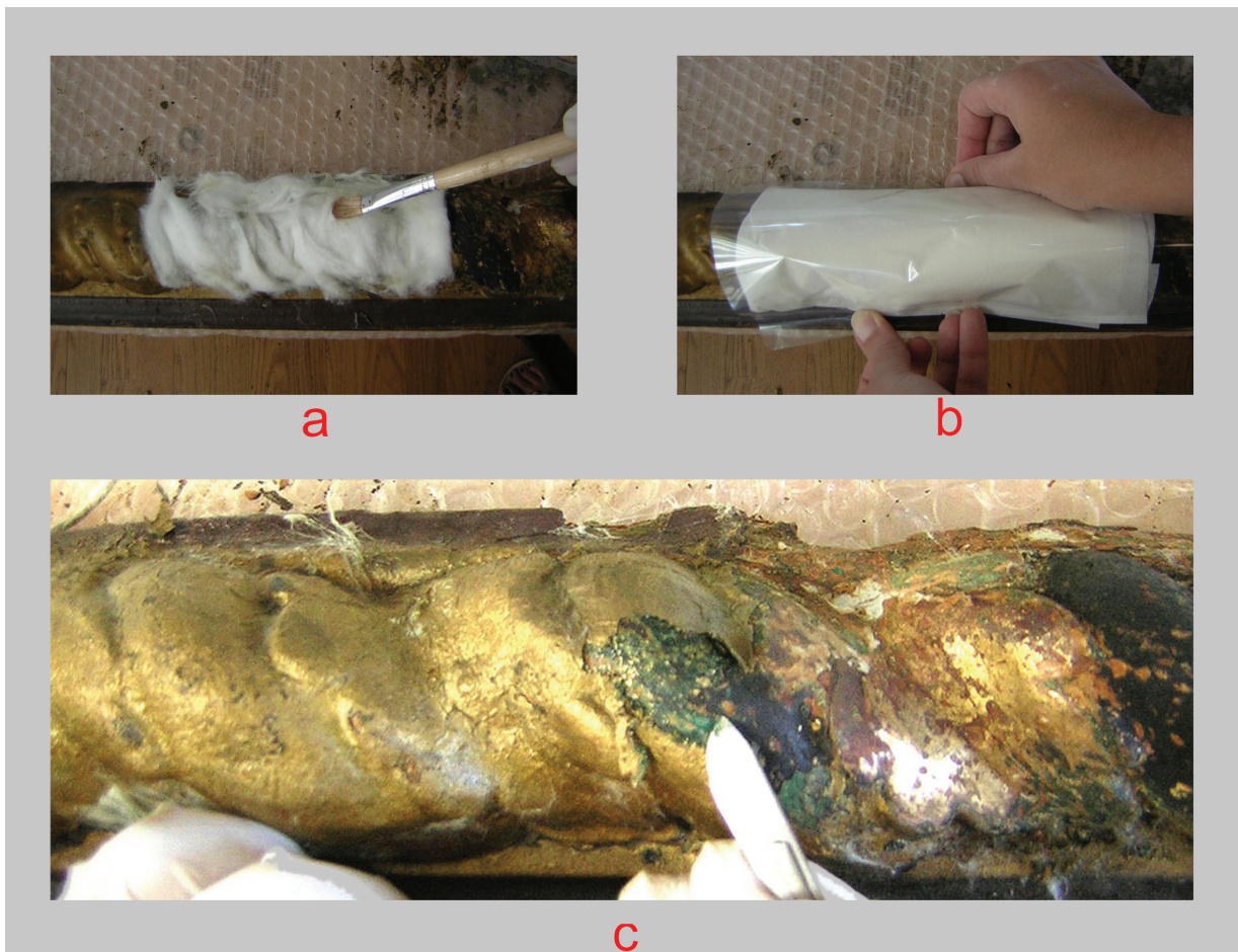
8. a) prekrivanje tretiranog dijela celuloznom vatom (nanosi se smjesa etil metil ketona u Klucelu G), b) tretirani dio se prekrije celuloznom vatom i silikoniziranim melineksom, c) uklanjanje slojeva nakon omekšavanja a) The treated segment is covered with cellulose cotton (coated with a mixture of ethyl-methyl ketone in Klucel G.); b) The treated segment is covered with cellulose cotton and siliconized Melinex; c) Removal of layers after softening

Drugi preslik na letvama (smeđa uljena boja s preparacijom) uklonjena je tzv. pappinom fiorentinom koja sadrži 750 ml destilirane vode, 500 g otopljenog bijelog pčelinjeg voska, 1,2 g stearinske kiseline i 6 ml amonij hidrogen karbonata 11 . Tijekom faze čišćenja pažljivo su se podlijepili odignuti dijelovi polikromije i pozlate uštrcavanjem 3%-tne otopine zečjeg tutkala u destiliranoj vodi. Dio po dio se spuštao djelovanjem vlage iz tutkala i topline, tretirajući navlaženi segment toplom špattlicom preko silikoniziranog Melinexa .