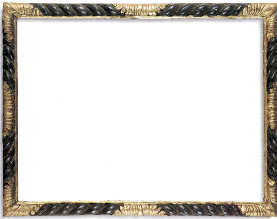
1. Ukrasni polikromirani i pozlaćeni okvir, Brescia, Pinakoteka Tosio-Martinengo Decorative polychrome and gilded frame, Brescia, Pinacoteca Tosio Martinengo

majstora koji je bio u izravnom kontaktu s talijanskim majstorima i njihovim djelima. Vranjički okvir je po svojoj izvedbi usporediv s okvirom iz Brescie koji se čuva u pinakoteci Tosio-Martinengo (83 × 111 × 7 cm) 2 . Taj tip okvira Talijani nazivaju a tortiglione . Okvir iz Brescie sadrži stilizirane i polirane spirale, čiji se jednostavni ali elegantni ukrasi zasnivaju na kontrastu crne polikromije i vegetabilnih ukrasnih elemenata. (sl. 1)