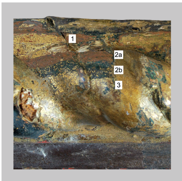
7. Sondiranje okvira: 1. originalni sloj vodene pozlate, 2a. kredna podloga prvog preslika, 2b. prvi preslik (uljena pozlata), 3. drugi preslik, tzv. purpurina Probing of the frame: 1. Original layer of water gilding; 2a. Chalk base of the first layer; 2b. First layer of paint (oil gilding); 3. Second layer of paint, the so-called purpurine

tzv. Pettenkoferovoj metodi omekšavanja filma boje djelovanjem para otapala 9 . Kad su se prvi i drugi sloj preslika dovoljno omekšali, oprezno je uklonjen beskiselinski papir, pri čemu su se dijelom uklonili “neželjeni” slojevi koji su se zalijepili za papir. Ostatak se pažljivo uklanjao kirurškim skalpelom pod svjetlosnim mikroskopom da se ne ošteti originalni sloj. (sl. 8) Čišćenje segmenata pozlate od nečistoća i prljavštine obavljeno je gelom koji sadrži dvije komponente koje se pomiješaju nakon što se zasebno pripreve: komponenta A: 100 ml destilirane vode, 1,36 g kalijeva dihidrogen fosfata, 1,1 g diamonijum citrata i komponenta B: 60 ml ksilena, 30 ml Tritona X-100. Važno je da se tretirana površina naknadno ispiru ksilenom 10 .