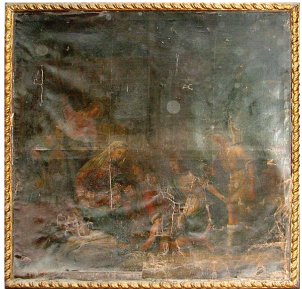
2. Nepoznati autor, Poklonstvo pastira , 17. st (?), Vranjic (Solin), župna crkva, slika s ukrasnim polikromiranim i pozlaćenim okvirom prije konzervatorsko-restauratorskih radova Unknown author, Adoration of the Shepherds, 17th c. (?), Vranjic (Solin), parish church, painting with the decorative polychrome and gilded frame prior to the conservation-restoration works

Drugi zahvat (drugi preslik), vidljiv na početku restauratorskog zahvata, obavljen je tako da je na uljenoj pozlati