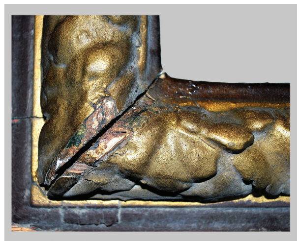
3. Detalj oštećenja kutnog dijela ukrasnog okvira, zatečeno stanje Detail of the damaged corner section of the decorative frame, condition before the works

(prvi preslik) postavljena preparacija (gips-kalcijev sulfat) i na njoj poprilično deo sloj purpurine 4 na rezbarenim dijelovima, dok je na rubovima letvi nanesen deo uljeni smeđi sloj. (sl. 4) Prvi zahvat (prvi preslik) vjerojatno je obavljen početkom 20. stoljeća, što je zaključeno zbog upotrebe metoda i materijala tipičnih za austrijsku restauraciju poput kita od kestena. 5 Odlučeno je da se kit ukloni jer je zbog svoje oštećenosti i neravnomjernog nanosa narušavao izgled okvira. Na čitav okvir postavljena je uljena pozlata. Takva vrsta pozlaćivanja, upotrebom