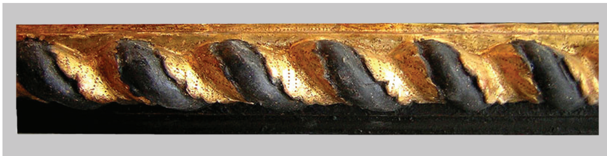
9. Detalj okvira nakon faze nanosa pozlate i parcijalnog retuša Detail of the frame after the gilding and partial retouching

Okvir je na izbočenim tordiranim dijelovima i na donjoj letvi bio oštećen zbog djelovanja crvotočine. Na tim dijelovima drvo se osipalo, pa je bilo potrebno obaviti fazu učvršćivanja drva. Odabrana je 12%-tna otopina Paraloida B 72 u acetonu i etanolu u omjeru 1:1. Različiti postoci otopine (5%, 10%, 12%) postupno su se uštrcali u unutrašnjost drva. Drvo se nakon ove faze više nije osipalo; zadržalo je prirodnu mekoću i elastičnost. Kutni nestabilni dijelovi okvira učvršćeni su smjesom piljevine i dvokomponentnog epoksidnog ljepila tvorničkog naziva Araldit. Odlučeno je da se upotrijebi Araldit jer su kutni dijelovi okvira glavni konstrukcijski nosioci slike.