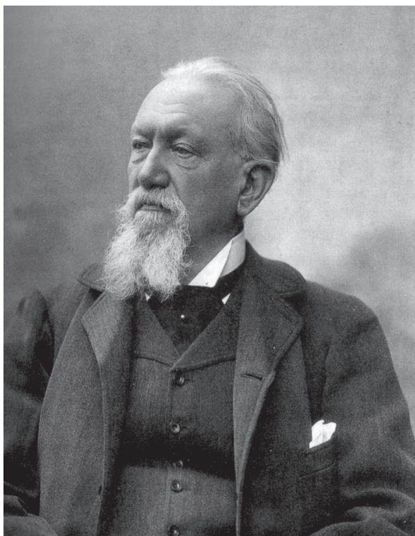
1. Fotografski portret Camilla Boita, oko 1880. godine Photographic portrait of Camillo Boito, c. 1880

Mlecima i 1964. sastavili poznatu povelju koja se u znatnoj mjeri zasnivala upravo na Boitovim načelima. Ideje neprihvaćenosti i dijalektike, čini se, čine samu bit historije i teorije arhitektonskoga konzerviranja 20. stoljeća.