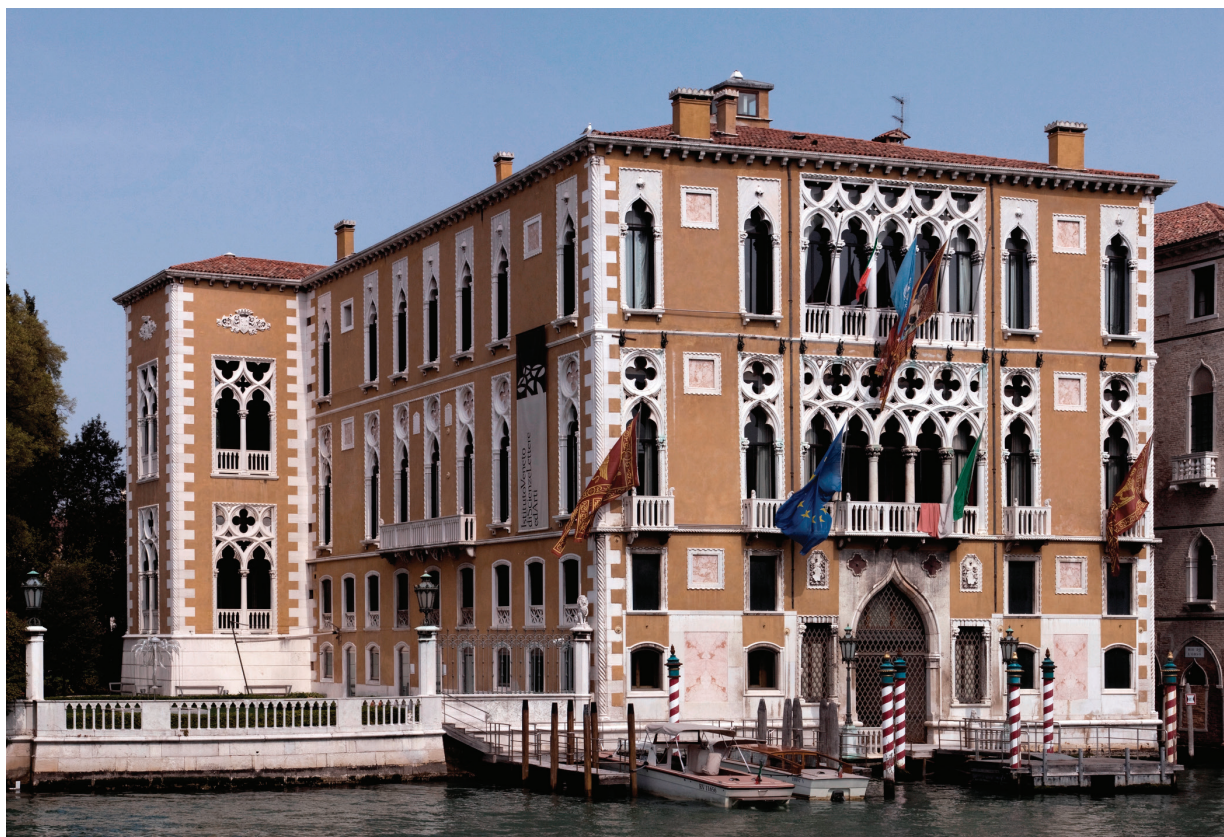
3. Pročelje palače Gussoni-Franchetti, Venecija, nakon Boitovih intervencija 1882. godine Facade of the Gussoni-Franchetti Palace, Venice, after the 1882 interventions by Boito

Rasprava o Sv. Marku dovela je do vrhunca polemike o principima uklanjanja, supstituiranja i kopiranja popule, razlistale i smrvljene građe Zlatne bazilike. Stvari su se od sredine 1840-ih, kada se tvrdilo da supstitucija i analogijsko integriranje ne osporavaju autentičnost, znatno promijenile; sada su pisci izoštrena vida prešli iz