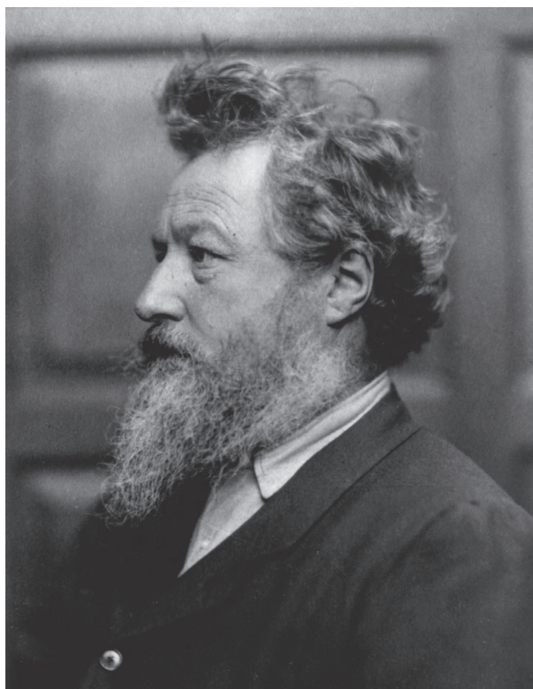
2. Fotografski portret Williama Morrisa Photographic portrait of William Morris

Boitov se članak o dovršetku pročelja firentinske katedrale pojavio godinu dana nakon osvajanja papinskoga