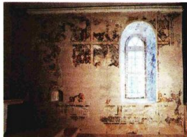
Zidni oslik većim dijelom sačuvao se na južnom zidu crkve