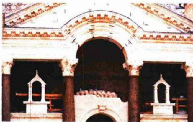
Radovi na Protironu primiču se kraju