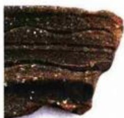
Odlomak vrča Josip Višnjić (desno) bio je voditelj ekipe koja je otkrila senzaciju u Kaštelu (dolje)

PAZIN-KAŠTEL '11 SONDA 2 195 24.10.2011.