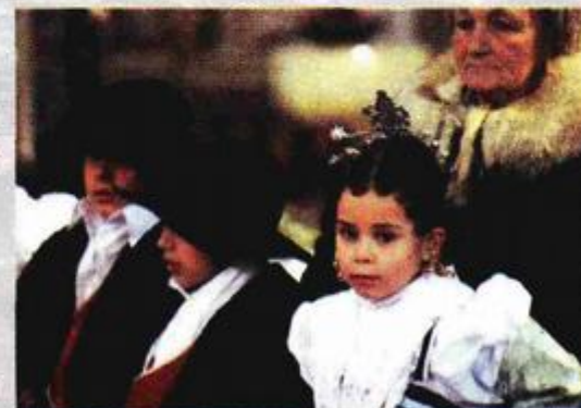
Mali Vodnjanci u tradicionalnim nošnjama

I galižanski župnik Giacomo Giachin u svojem rukopisu sačuvanom u župnom arhivu u Galižani spominje da je u Guranu već 784. godine bio Kaptol kojeg je odobrio papa. Krajem travnja bit će organiziran znanstveni skup te prikazan dokumentarni film o radovima na relikvijama i svetim tijelima.