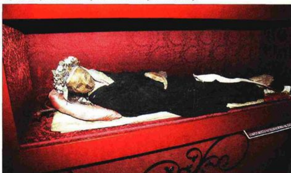
Tijelo sv. Nikoloz Bursa, koja je preminula 1512., sačuvano je sa svim unutarnjim organima

Bemba koji je umro 1188. pak djelomično je raspadnuto, a tijela sv. Ivana Olinija umrlog 1300. i sv. Nikoloz koja je preminula 1512., sačuvana su sa svim unutarnjim organima, što predstavlja svojevrsni fenomen.