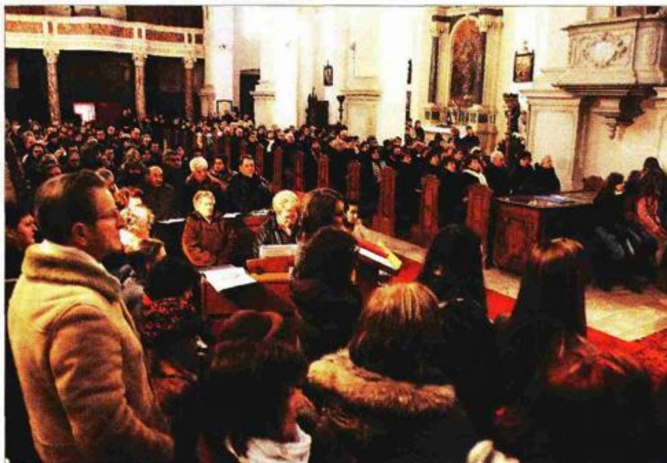
Proslava osam stoljeća župe

- Župa Sv. Blaža u Vodnjanu poznata je po relikvijama, a sveta tijela su najdragocjenija i posao na njihovom očuvanju je gotov, rekao je porečki i pulski biskup monsinjor Ivan Milovan. Vodnjan, naveo je, već dva stoljeća čuva sveta tijela, a njihova obnova i zaštita provedena je na Jelenićevu inicijativu. Na tom su poslu, usto surađivali Ministarstvo kulture, Hrvatski restauratorski zavod, Konzervatorski odjel u Puli, KBC Split, Istarska županija, Grad Vodnjan te posebno povjerenstvo osnovano s ciljem očuvanja i zaštite svetih tijela.