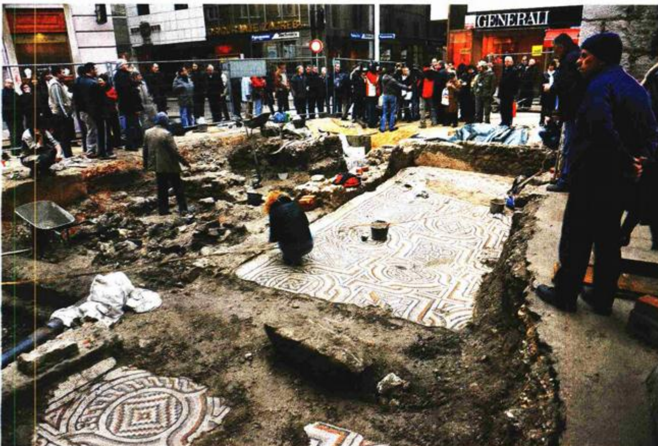
Arheološka istraživanja lokaliteta Trga pul Vele crikve u Starom gradu 2008/2009. godine

obaveza, rekao je Franić, zahvalivši na ukazanom povjerenju.