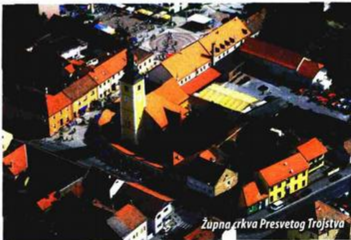
Župna crkva Presvetog Trojstva

Najveći radovi izvršeni su na arheološkim iskopinama Rimskih termi koje zajednički financiraju Ministarstvo kulture i Grad Ludbreg, a pod nadzorom stručnjaka Hrvatskog restauratorskog zavoda - Arheološkog odjela.