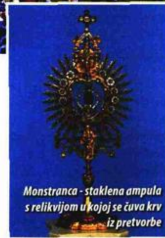
Monstranca - staklena ampula s relikvijom u kojoj se čuva krv iz pretvorbe