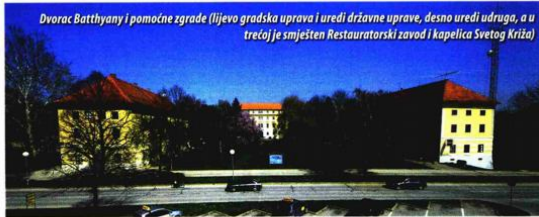
Dvorac Batthyany i pomoćne zgrade (lijevo gradska uprava i uredi državne uprave, desno uredi udruga, a u trećoj je smješten Restauratorski zavod i kapelica Svetog Križa)

Na Svetištu Predragocjene Krvi Kristove uređena je centralna staza Križnog puta koju je djelom financiralo i Ministarstvo turizma, uređene su bočne staze Križnog puta kako bi se omogućio pristup osobama s invaliditetom. Izgrađene su pješačko-biciklističke staze u nekim ulicama Ludbrega te naseljima, radilo se na uređenju nerazvrstanih cesta prema mo-