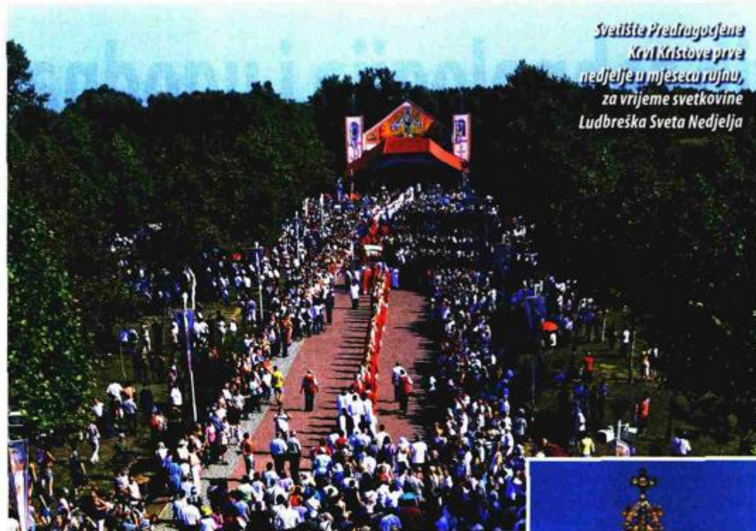
Svetište Predragocjene Krvi Kristove prve nedjelje u mjesecu rujnu, za vrijeme svetkovine Ludbreška Sveta Nedjelja

Radi se o projektu koji bi u konačnici trebao rezultirati maksimalnom racionalizacijom potrošnje svih oblika energije uz istovremeno osiguranje uvjeta za ugodan život građana te za razvoj grada. Ili jednostavnije, nakon realizacije projekta troškovi života i rada u Gradu biti će niži. Od Grada se u prvoj, razvojnoj fazi očekuje sudjelovanje u prikupljanju podataka, te maksimalna suradnja i pružanje potpore stručnjacima. U drugoj fazi, a to je provedba, očekuje nas izravno uključivanje svih subjekata projekta što praktično znači skoro svih građana. Troškove za prvu fazu pokrivali bi europski projekt (Inteligentna energija Europe) i nacionalne financijske strukture. Grad i građani trebali bi biti financijski minimalno opterećeni jer se planira zatražiti sufinanciranje mjerodavnih ministarstava, fon-