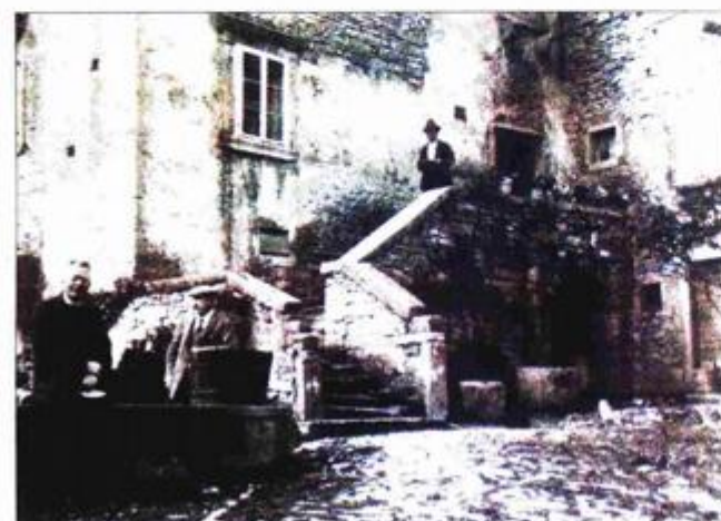
Kuća Rapicio prije nego je stradala u Drugom svjetskom ratu

Ruševna kuća nad bezdanom pazinske jame prozvana je po njenim negdašnjim vlasnicima, tršćanskoj obitelji Rapicio koja je u Pazin doselila u 16. stoljeću, a dala je nekoliko uglednika i svećenika. Zgrada je teško stradala tijekom njemačkog bombardiranja u Drugom svjetskom ratu, a nakon rata nastavila se urušavati. Od kuće su do naših dana ostali samo zidovi južnog pročelja s više prozora, niša i puškarnicama. Uspije li Grad Pazin osigurati sredstva i konzervirati ovu zgradu na atraktivnom položaju njome će zacijelo oplemeniti najstariji dio grada, ali i stvoriti nov prostor koji se može iskoristiti za razne društvene namjene.