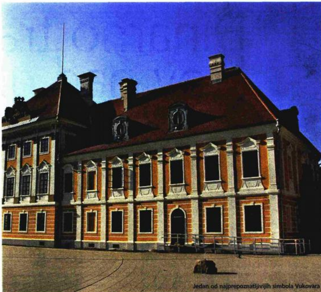
Jedan od najprepoznatljivijih simbola Vukovara