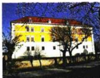
Villa Streim u Iloku

3. Arheološko nalazište Vučedol, lokalitet eponim Vučedolske kulture, jedno od najznačajnijih prethistorijskih nalazišta u Europi; gradnja Muzeja Vučedolske kulture, arheološko-turističkog parka, obnova secesijske Vile Streim, međunarodna arheološka škola, arheološka istraživanja.