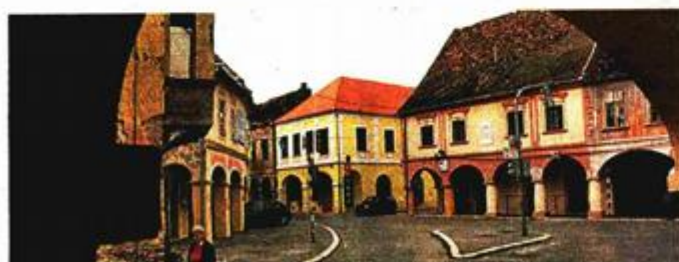
Barokna jezgra Vukovara

4. Grad Ilok, obnova povijesne jezgre - najznačajnije srednjovjekovne urbane cjeline u hrvatskom dijelu Podunavlja; dovršena su višegodišnja arheološka istraživanja; istražen i obnovljen dvorac Odeschalchi i u njemu je u veljači 2010. otvoren novi postav Muzeja grada Iloka; uređenje krajoлика u povijesnoj jezgri, započela su istraživanja na Franjevačkom samostanu i Crkvi sv. Ivana Kapistrana.