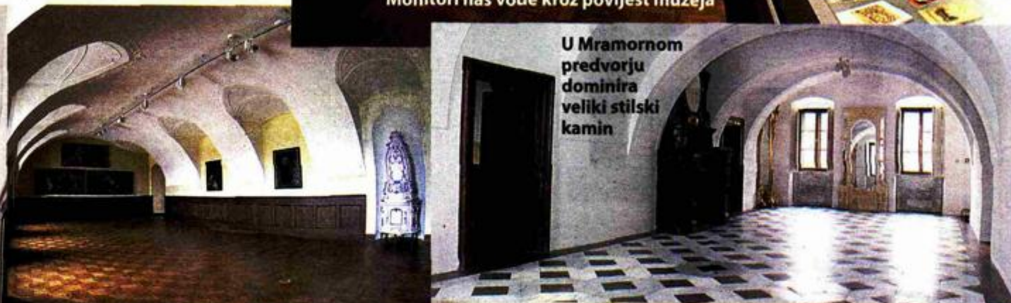
Prvi organizirani posjeti tek u lipnju