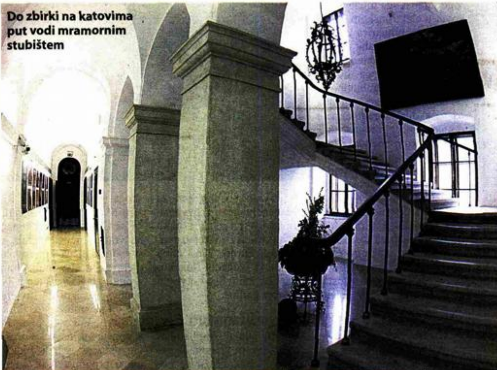
Do zbirki na katovima put vodi mramornim stubištem

- Prema projekciji razvoja i realizacije projekta Vlade Republike Hrvatske i Razvojne banke Vijeća Europe, koji provodi Ministarstvo kulture Republike Hrvatske, otvaranje cjelokupnoga stalnoga postava Gradskoga muzeja Vukovar, koji će se nalaziti na svim katovima dvorca Eltz, bit će u lipnju, neposredno pred ulazak Hrvatske u Europsku Uniju - zaključila je Marić.