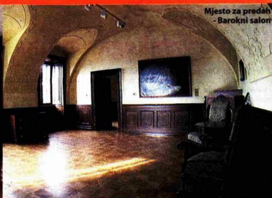
Mjesto za predah - Barokni salon