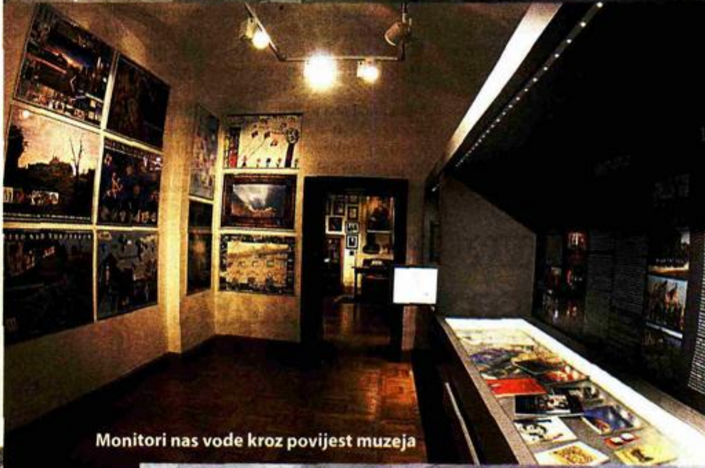
Monitori nas vode kroz povijest muzeja