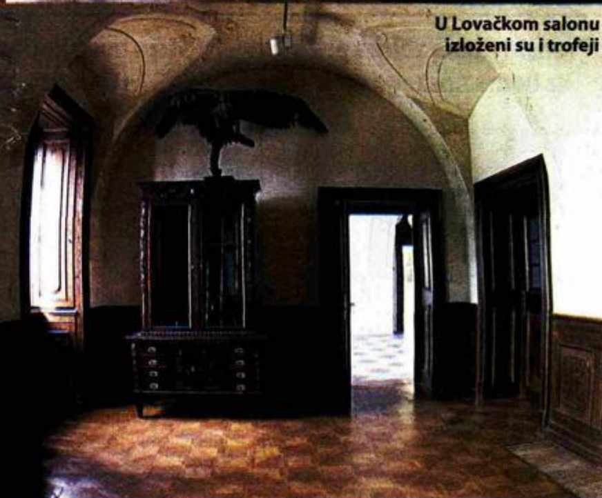
U Lovачkom salonu izloženi su i trofeji