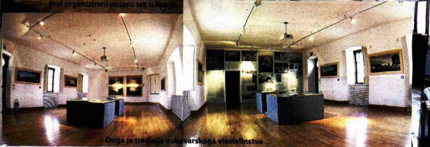
Duga je tradicija vukovarskoga vlastelinstva