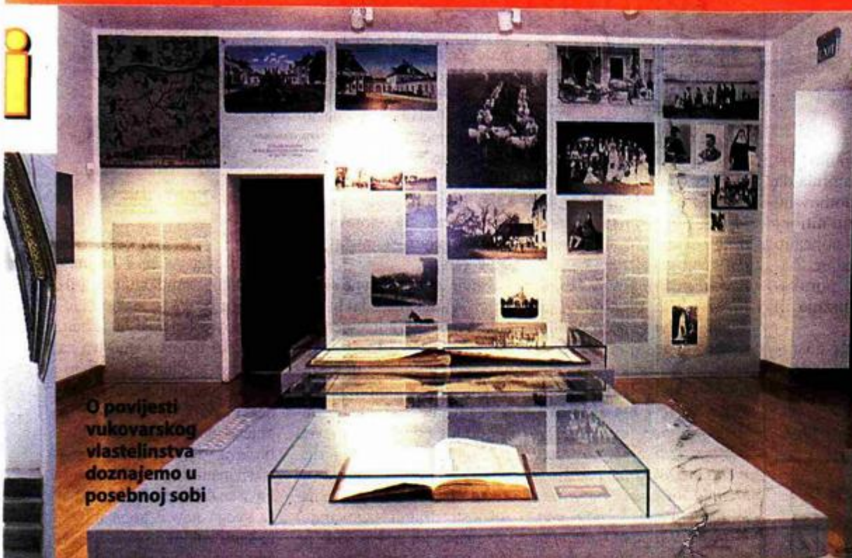
O povijesti vukovarskog vlastelinstva doznajemo u posebnoj sobi