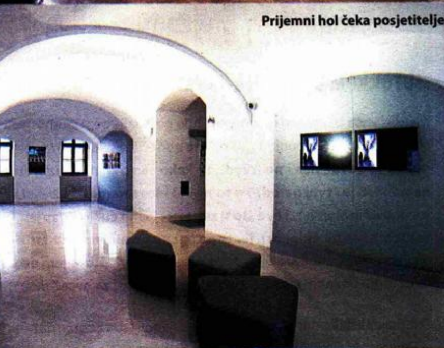
Prijemni hol čeka posjetitelje