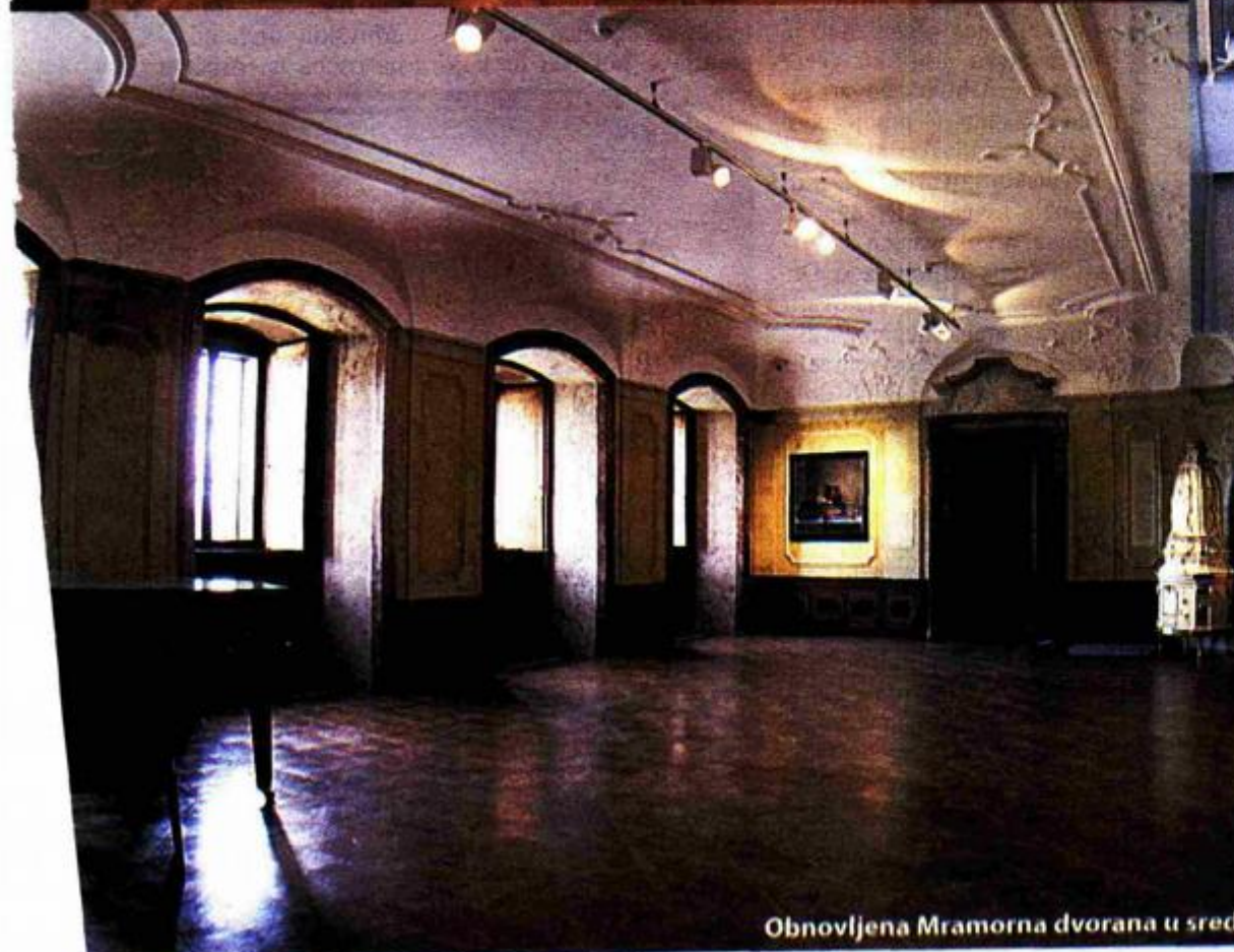
Obnovljena Mramorna dvorana u središnjem dijelu dvorca zasjala je punim sjajem