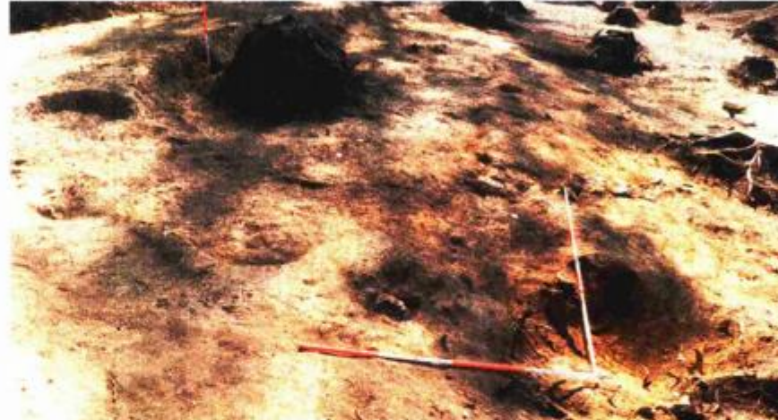
Ostaci jedne od pronađenih zemunica