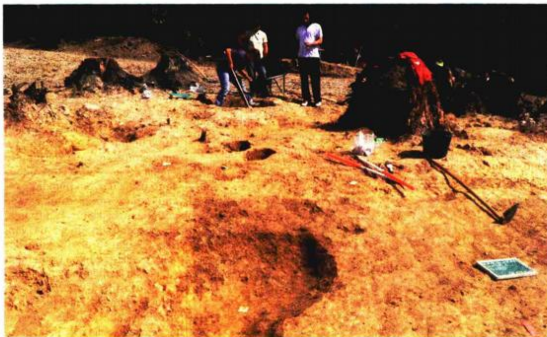
Radovi na arheološkom nalazištu Brekinjova Kosa