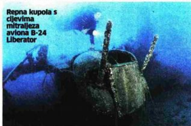
Repna kupola s cijevima mitraljeza aviona B-24 Liberator