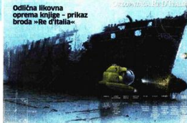
Odlična likovna oprema knjige - prikaz broda »Re d'Italia«

objediniti »stare« i nove teme u jednoj knjizi, čime se broj obrađenih lokaliteta drastično povećao – ističu autori.