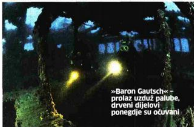
»Baron Gautsch« - prolaz uzduž palube, drveni dijelovi ponedje su očuvani