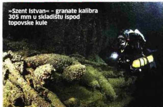
»Szent Istvan« - granate kalibra 305 mm u skladištu ispod topovske kule