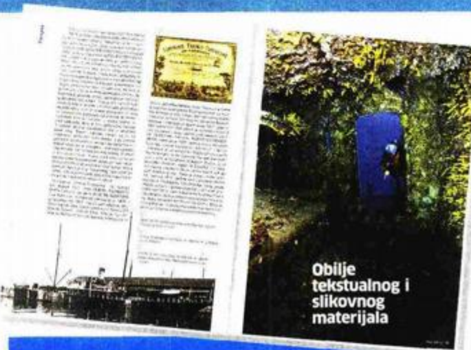
Obilježje tekstualnog i slikovnog materijala

Luksuzno opremljena knjiga što je urednički potpisuje Dragan Ogurlić, s grafičkim oblikovanjem Ivice Oreba, na 380 stranica velikog formata donosi priče o 56 olupina razbacanih po Jadranu, od sjevera prema jugu, od Sistine pokraj Trsta do Cavtata. Zaljubljenicima u podmorje i ljudima koje zanimaju priče iz dubina zacijelo je poznato ponešto od onoga što donosi nova knjiga. Prije deset godina isti su autori, i s istim izdavačem, objavili knjigu