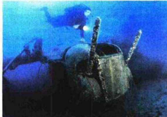
Repna kupola s cijevima mitraljeza aviona B-24 Liberator