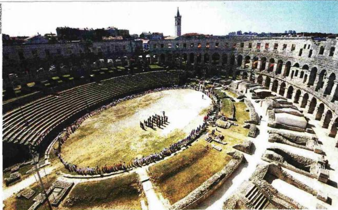
Nakon sjeverozapadne kule na red za popravak doći će najvjerojatnije jugozapadna

Mate Pavin iz Hrvatskog restauratorskog zavoda objasnio je da se radi o lokalnim oštećenjima i pukotinama u kamenu koje će biti sanirane injektiranjem, impregnacijom te sidrenjem. Dobra vijest je da će nakon nešto više od četiri godine od postavljanja skele ona napokon biti skinuta početkom 2012. te će građani moći vidjeti konkretne rezultate. Komšo je najavio i to da će dosadašnje metalno stepenište u kuli pokušati zamijeniti drvenim u skladu s duhom