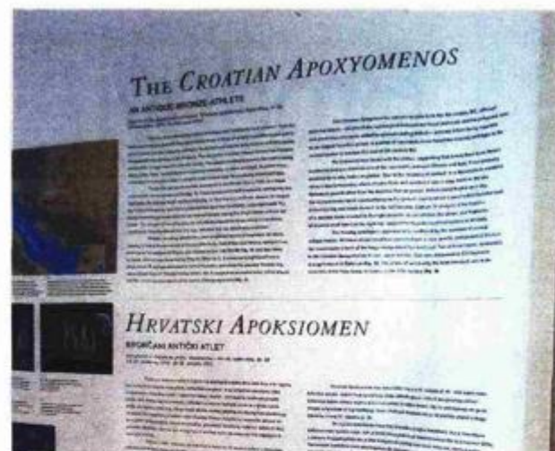
Priča o Apoksiomenu