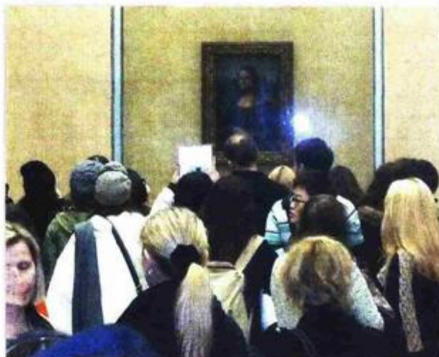
Mona Lisa uvijek ima brojnu publiku