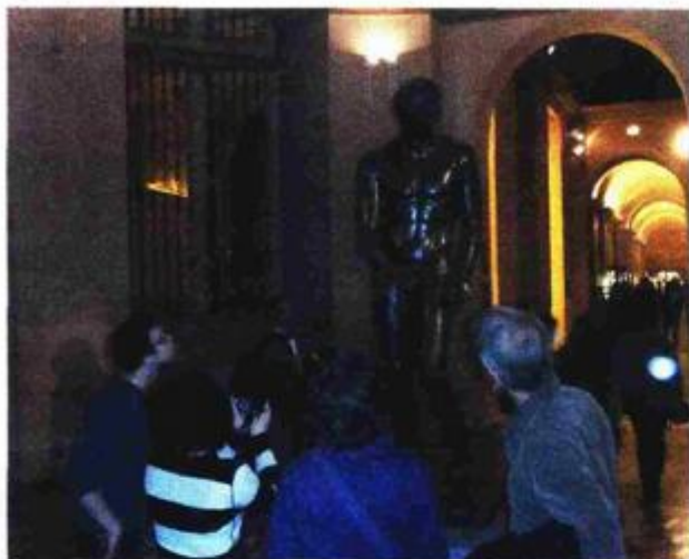
Nitko nije samo prošao pored Apoksiomena