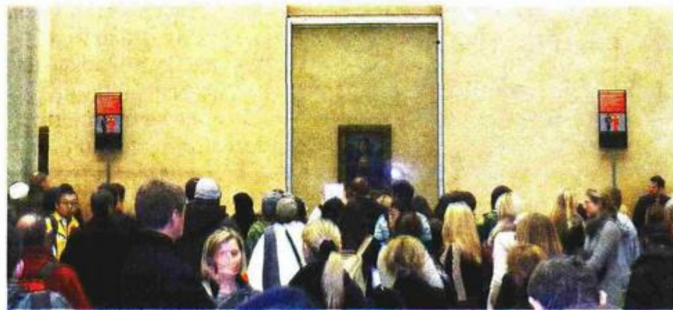
Mona Lisa uvijek ima brojnu publiku

Nisu zanemarena ni djela hrvatskih književnika, hrvatskoga stripa, karikature, filma, fotografije te glazbe domaćih autora. Sve u svemu, riječ je o iznimnom događaju za promociju hrvatske kulture u svijetu, koji je izazvao veliku pozornost francuske javnosti, a kojoj su mnoga hrvatska vrhunska umjetnička djela bila potpuna nepoznanica.