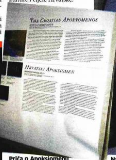
Priča o Apoksiomenu