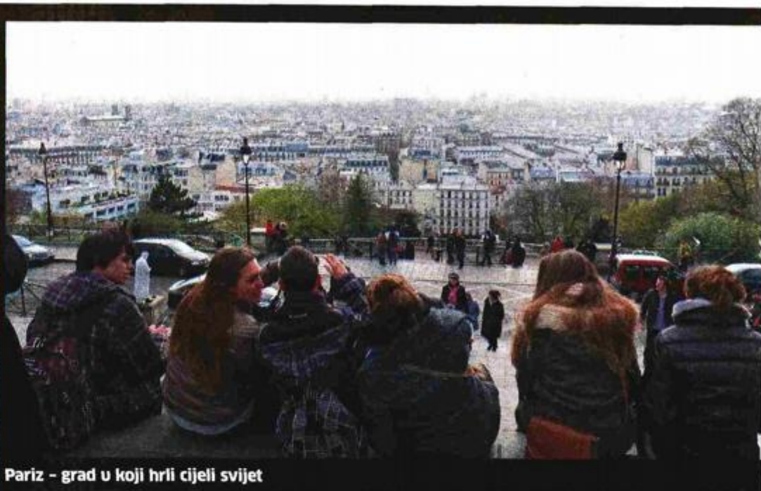
Pariz - grad u koji hrli cijeli svijet