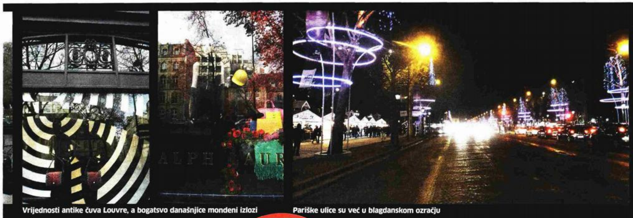
Vrijednosti antike čuva Louvre, a bogatsvo današnjice mondeni izlozi