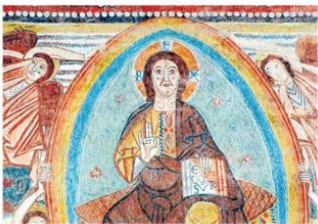
Krist u sv. Foški u Peroju

U veličanstvenim ruševinama Dvigrada, nekoć važnoga srednjovjekovnoga grada, nalaze se ostaci župne crkve sv. Sofije u kojoj su otkrivene najstarije istarske freske, nastale istodobno s arhitekturom crkve krajem 8. st. u karoliško doba. Danas se čuvaju u Arheološkom