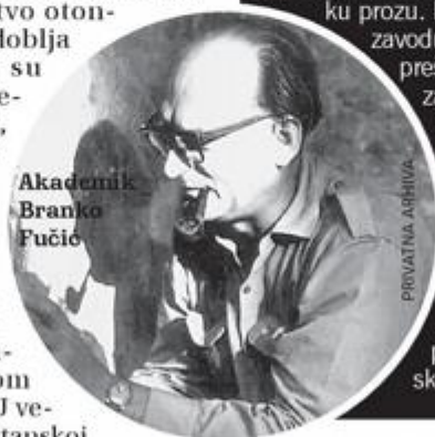
Akademik Branko Fučić

Slikarstvo otoskoga razdoblja također su širili benediktinci, a izraziti primjer nalazi se u crkvi sv. Martina u sv. Lovreću Pazeničkom iz 11. st. U većoj samostanskoj crkvi Opatije sv. Miho-