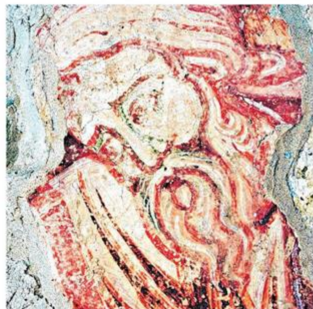
Detalj freske iz Huma