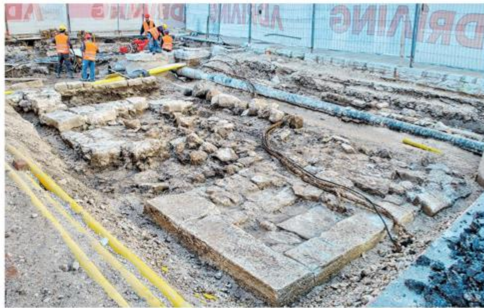
Pred muzejem su temelji mosta kojim se nekad ulazilo u utvrđeni grad na otoku