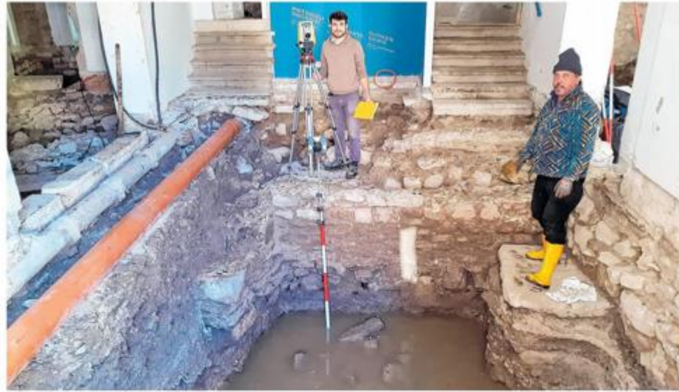
Palača Califfi izgrađena na temeljima bedema