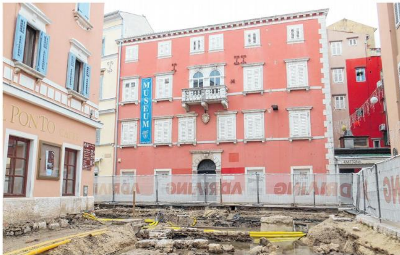
Muzej okružen ogradom i zastorom