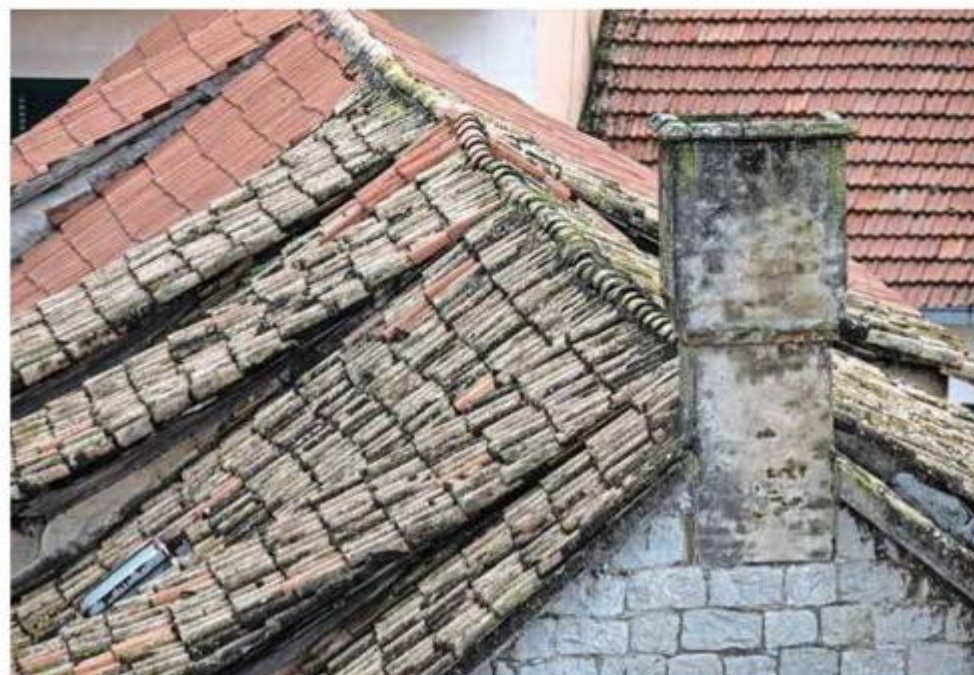
Krovovi i dimnjaci u centru grada

dok sam se stručno usavršavala na temu upravljanja rizicima u kulturnoj baštini na Ritsumeikan Sveučilištu u Japanu, gdje su me mentori ohrabрили i potaknuli na razradu ideje. Ubrzo nakon toga zatražila sam sredstva od Ministarstva kulture RH, te uz logističku podršku Grada Splita i Ravnateljstva Civilne zaštite izradila, pripremila i objavila priručnik. Priručnik u budućnosti planiramo razvijati i nadograđivati, a u suradnji s Gradom Splitu u planu su i tematske radionice za građane. Namjera je da priručnik bude u potpunosti dostupan i besplatan. Može ga se naći u PDF formatu na mrežnim stranicama Grada Splita i Hrvatskog restauratorskog zavoda. Tiskani primjerci u limitiranom broju također su dostupni u prostorijama Gradskog kotara Grad Split te ih građani mogu preuzeti radnim danima kod kotarsko-komunalnog redara - napominje Vinka Marinković. ●