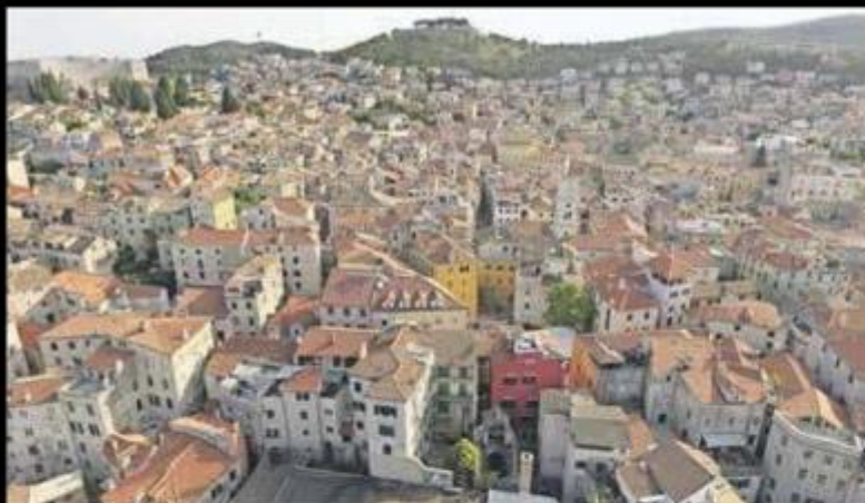
● Položaj crkve u šibenskoj gradskoj jezgri Crkva se nalazi znad nekadašnjeg kina Šibenik i zgrade Županije