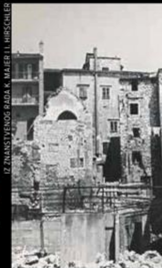
IZ ZNANSTVENOG RADA K. MAJER I HIRSCHLER