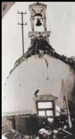
● Nakon bombe Stanje snimljeno pedesetih godina, te nakon savezničkih bombi 1943. godine, kada je zvonik jedva stajao, a više ga uopće nema.