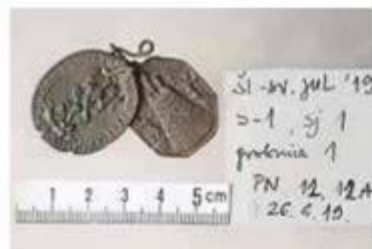
Medaljice iz crkve

- U 14. stoljeću crkva se navodi kao ecclesia sancti Iuliani i imala je oltar sv. Mihovila. U 15. stoljeću nad njom je dograđena gornja, crkva Sv. Nikole. To se zbilo između 1386. godine, kada se u dokumentima još uvijek navodi samo crkva Sv. Julijana, i 1481. kada vizitacija, koju je u ime biskupa Luke Tolentića obavio kanonik Juraj Šižgorić, spominje dvije crkve: donju Sv. Julijana i gornju Sv. Nikole. Takva je tipologija dvokatne crkve karakteristična samo za rijetke primjere srednjovjekovne sakralne arhitekture na istočnojadranskoj obali i ovdje se javlja razmjerno kasno. Poslije, u 16. stoljeću, donja je crkva prema odluci mletačkog Senata dana na korištenje pravoslavcima i uređena je prema propisima Istočne crkve. U apsidu je postavljen oltar s ikonom Bogorodice, a katolički oltar sv. Mihovila i sv. Julijana premješten je na bočni zid crkve. I nadalje je održavan, a na njemu se služila katolička misa čak do 1807. godine. Početkom 19. stoljeća, u vrijeme francuske uprave, crkva je služila kao skladište. Pravoslavna šibenska crkvena općina preuzela je crkvu Sv. Julijana nakon 1875. godine te je gornju crkvu 1931. prepustila za bogoslužje