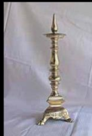
● Svijećnjak Rijetki predmet sačuvan iz liturgijskog sv. Julijana