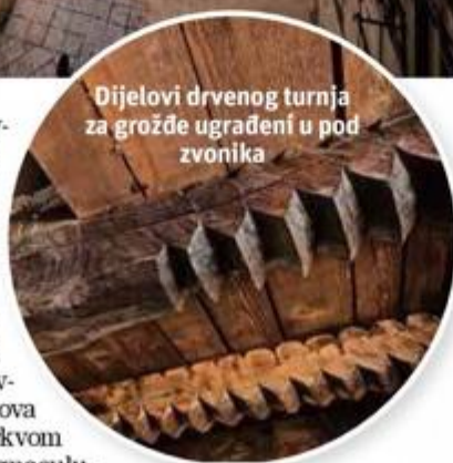
Dijelovi drvenog turnja za grožđe ugrađeni u pod zvonika

sa zidova crkve, obavljani su strapiranje i pohrana zidnih oslika Mate Meneghella Rodića . Zatim su postavljene nove elektroinstalacije, ožbukani su zidovi sakristije i romanički svodovi crkve, a obavljena je i izmjena pokrova crkve... Paralelno s crkvom radili smo i na propugnaculumu, pa je tako 2016. prilikom čišćenja otvora niše na sjevernom zidu sjevernog zida pronađen veliki broj ulomaka skulpture. Skulpturu smo nanovo sastavili i 2018. godine prezentirali "ruke s krunom" koje su bile svojevrsna atrakcija. Naposljetku su se radovi toliko zahuktali da smo se 2019. godine obratili pismom namjere Gradu Splitu sa zamolbom za sufinanciranje. Tadašnji gradonačelnik Andro Krstulović Opara inicirao je potpisivanje sporazuma o suradnji s Gradom, kojim je dogovoreno da će Grad iz svog proračuna za obnovu osiguravati jednaka sredstva kao Ministarstvo kulture, pa smo naposljetku došli do 700 tisuća kuna godišnje, dakle nešto manje 100 tisuća eura, što je od 2019. godine znatno intenziviralo i ubrzalo radove. Ove godine je gradonačelnik Ivica Puljak obnovio sporazum do 2025. godine, što je očigledno znak da profesionalno i dosljedno obavljamo posao.