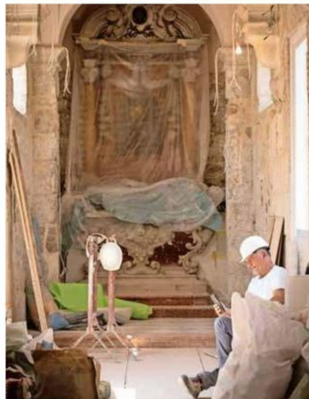
Unutrašnjost crkve Gospe od Zvonika

ga Magi i Bite, kao donatora. Ikona Gospe od Kampanela je iz 13. stoljeća i smatra se najljepšim djelom splitske slikarske radionice, a čuva se u katedralnoj riznici. Mramorna luneta s reljefom Gospe od Milosrda koja plaštom zakriva bratime natpisom je datirana u 1480. godinu, a pripisuje se kiparu Andriji Alešiju, koji je bio član bratovštine Gospe od Zvonika. Sakristija je dograđena u 14. stoljeću, a na njezinu šufitu sastajala se bratovština koja je okupljala stanovnike Veloga Varoša, pučane koji su često bili oporba vladajućoj, plemićkoj klasi. Zanimljiva je i pobožna predaja po kojoj su uz raskošno kame-nostubište iz 18. stoljeća koje vodi do crkve hodočastile trudne Splitsanke, možda baš kako bi im taj napor olakšao porođaj. To je samo dio štorije o ovom neobično vrijednom komadiću splitske povijesti, a voditeljica radova dr. sc. Vinka Marinković, viša konzervatorica-restauratorica iz HRZ-a, upućuje kako crkvu i zvonik uvijek treba gledati u kontekstu arhitektonskih mijena u antičkom dvo-