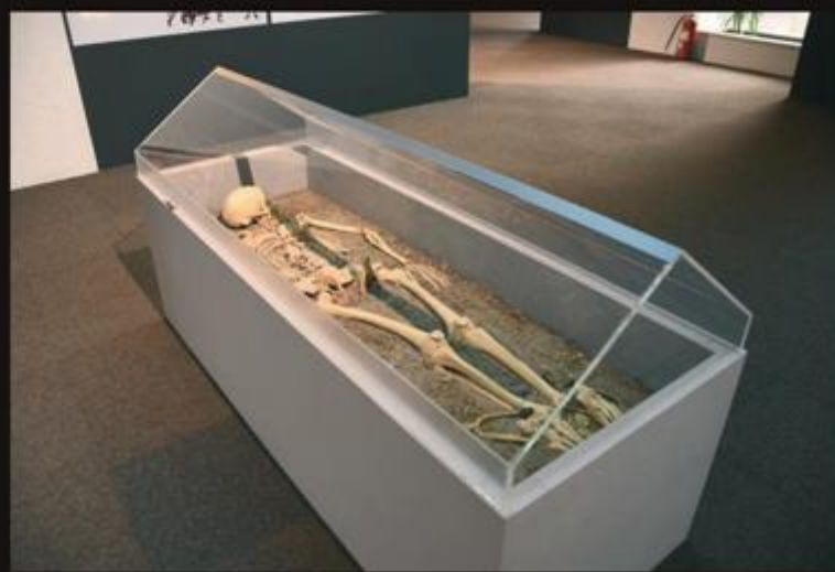
Kopija velikaške grobnice iz IX. stoljeća. Možda je riječ o ostacima kneza Borne?