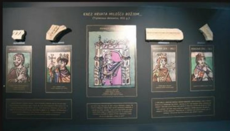
Likovne koncepcije Zorana Bobana i ilustracije Dalibora Popovića daju poseban pečat izložbi