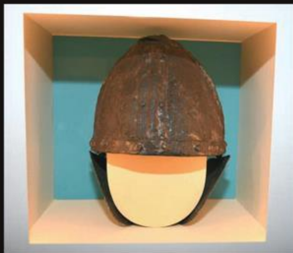
Izvanredno očuvana ratnička kaciga iz VI. stoljeća

Multimedijska kombinacija dragocjenih izložaka, pisanih podataka, ilustracija i rekonstrukcija ispričala je veliku i pristupačnu priču