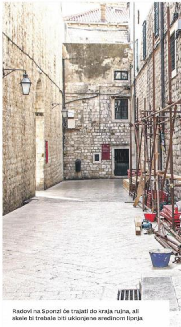
Radovi na Sponzi će trajati do kraja rujna, ali skele bi trebale biti uklonjene sredinom lipnja

SPONZA Svi vanjski radovi, odnosno radovi za koje je nužna građevinska skela, trebali bi po planiranoj dinamici biti dovršeni do 15. lipnja. Nakon toga će se smanjenim intenzitetom dovršavati preostali radovi u unutrašnjosti palače