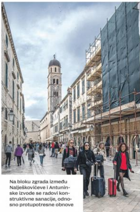
Na bloku zgrada između Nalješkovićeve i Antuninske izvode se radovi konstruktivne sanacije, odnosno protupotresne obnove

Naime, analiza rezultata dobivena statičkim nadzorom, koji se provodio od sredine 2019. do kraja 2022. godine, pokazala je kako se pukotine šire od ožujka do rujna, a potom slijedi faza mirovanja. Slijedom svega, utvrđeno je kako se spomenik ne treba uklanjati nego će se isti restaurirati. Ranije je najavljivano kako bi konzervatorsko-restauratorski radovi trebali početi u ovoj godini. „Krajem ožujka planiraju se pripremni radovi za zahvat otpuštanja sile u centralnom trnu Orlandovog stupa. Pripremni radovi podrazumijevaju interventno podupiranje stupa i postavljanje uređaja za praćenje ponašanja pukotina prilikom zahvata otpuštanja sile, odnosno reducirani monitoring. Zahvat otpuštanja sile centralnog trna planira se krajem travnja“, odgovorili su na upit o dinamici radova iz Grada Dubrovnika uz naglasak kako će svi postupci biti odrađeni prema smjernicama i zaključcima stručnog tima za određivanje daljnjeg pristupa problematici sanacije postojećih oštećenja na Orlandovom stupu. Do tada, Orlando će ostati okovan, kako bi bio čim više sačuvan.