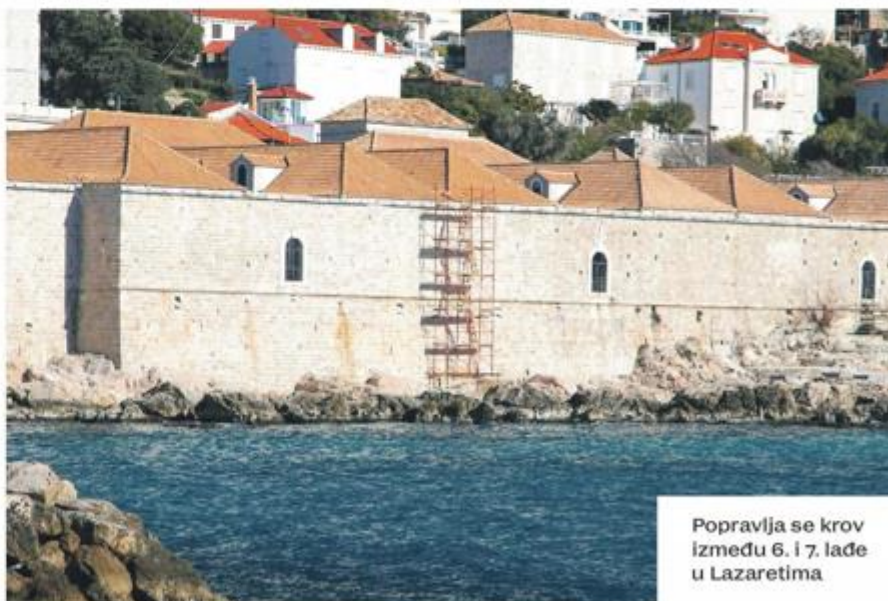
Popravlja se krov između 6. i 7. lađe u Lazaretima

Na ulazu na Stradun, kod unutarnjih vrata od Pila također je vidljiva skela koja se proteže po Zidinama prema Puncjeli i Bokaru. Sanira se unutrašnji zid Zidina i zid Vrata od Pila, a radovi će biti gotovi nakon turističke sezone.