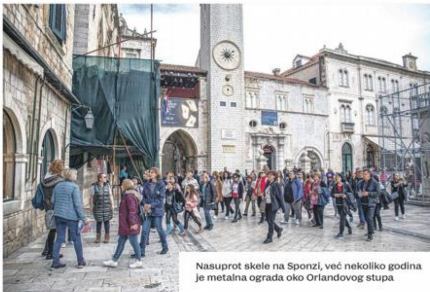
Nasuprot skele na Sponzi, već nekoliko godina je metalna ograda oko Orlandovog stupa

la, također je vidljiva skela koja se proteže po Zidinama prema Puncjeli i Bokaru.