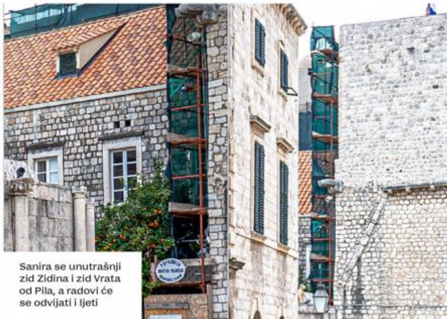
Sanira se unutrašnji zid Zidina i zid Vrata od Pila, a radovi će se odvijati i ljeti