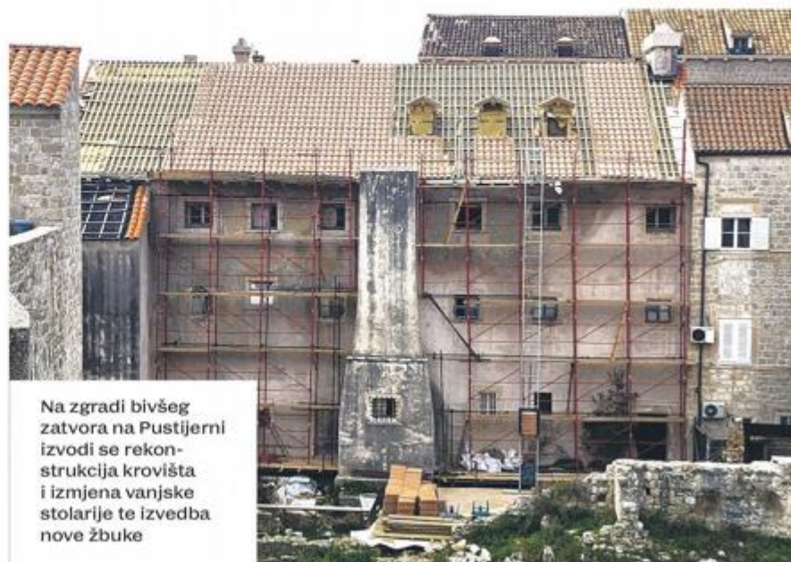
Na zgradi bivšeg zatvora na Pustijerni izvodi se rekonstrukcija krovništva i izmjena vanjske stolarije te izvedba nove žbuke

Ravnateljica ZOD-a: S obzirom na trajanje sezone, nije moguće kompleksne građevinske radove izvoditi samo u periodu izvan nje, posebno znajući koliko je zahtjevna organizacija radova u povijesnoj jezgri