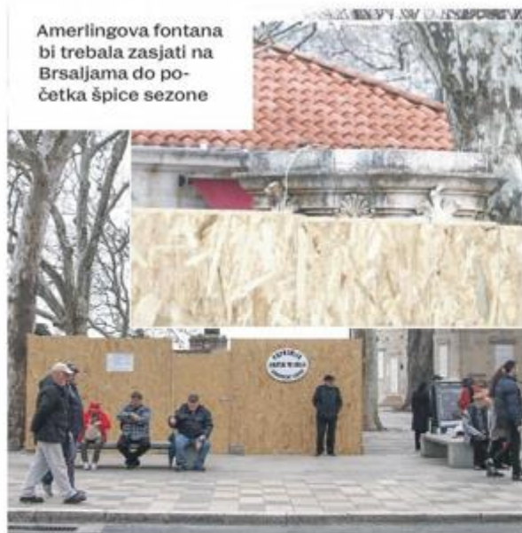
Amerlingova fontana bi trebala zasjati na Brsaljama do početka špice sezone