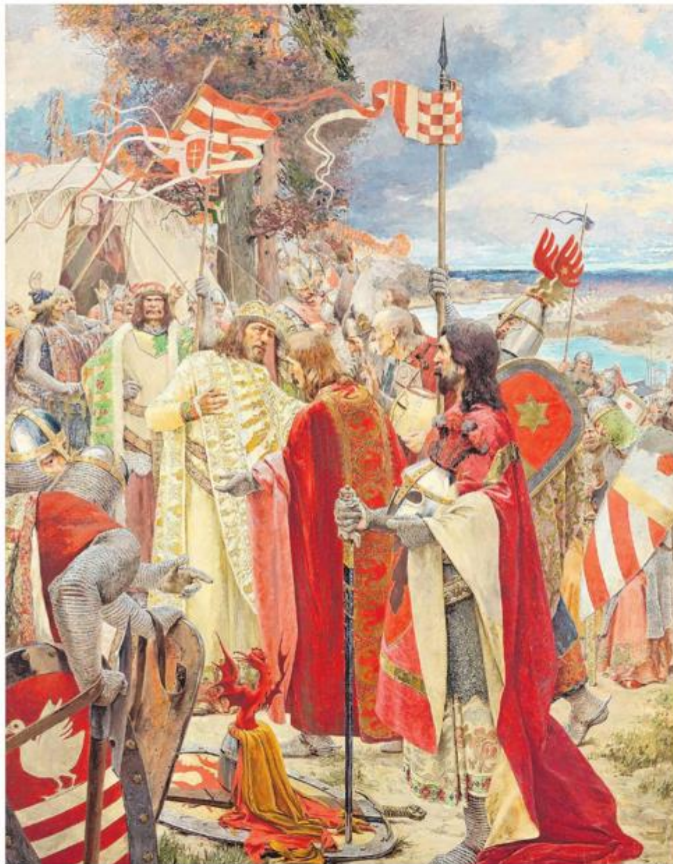
»Poljubac mira hrvatskih velmoža kralju Kolomanu«, 1906.

Oton Iveković rođen je u Klanjcu 1869., a preminuo je 1939. u Zagrebu. Obrazovanje je započeo kod E. Quiquereza u Zagrebu, zatim od 1886. u Beču,