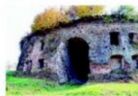
Fotografije zatečenog stanja iz Elaborata HRZ-a sadrži analize faza izgradnje te oznake pozicija istražnih sondi