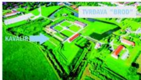
Pogled na središnji dio Tvrđave „Brod“ sa zgradom Kavalira