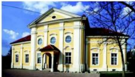
Zgrada Hrvatskog restauratorskog zavoda u Zagrebu