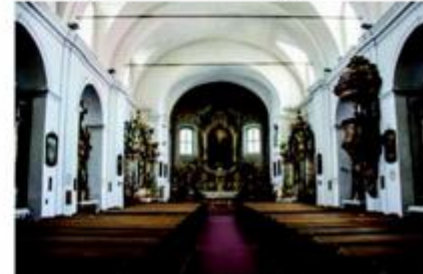
Stručnjaci HRZ-a su restaurirali inventar crkve Presvetog Trojstva u Slavonskom Brodu

Ministarstvo kulture i medija, Uprava za zaštitu kulturne baštine, svi konzervatorski odjeli, surađuju s Hrvatskim restauratorskim zavodom.