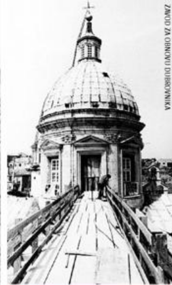
ZAVOD ZA OBNOVU DUBROVNIKA