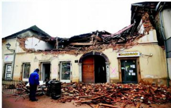
► Obnova na Baniji ide puževim korakom

S druge strane, djelatnost Zavoda za obnovu usmjerena je na poslove pripreme, organiziranja i provođenja programa obnove spomeničke cjeline Dubrovnika, odnosno na obnovu nepokretnih kulturnih dobara u seizmičkoj zoni. ■