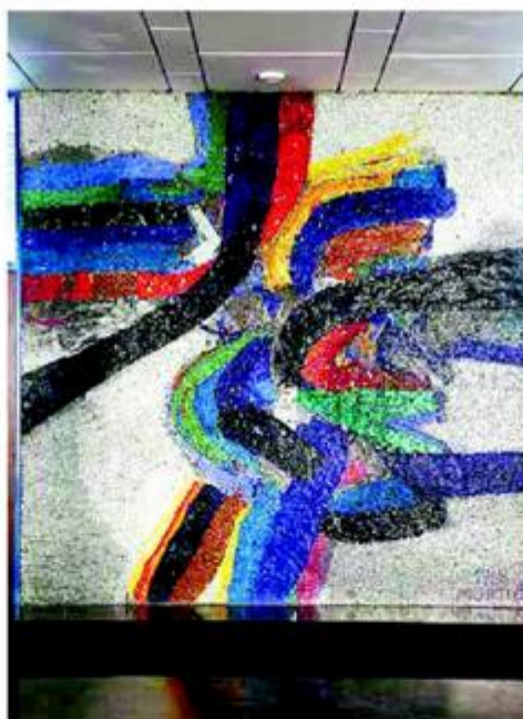
Zidni mozaik Ede Murtića, još jednog hrvatskog klasika koji je kontribuirao unutrašnjem uređenju zgrade. Fotka lijevo je prije, a desno nakon restauracije

Osim izgledom, Kockica je plijenila pažnju i jednostavnim, funkcionalnim, modernističkim interijerom i brojnim umjetničkim djelima u stilu lirske apstrakcije. U opremanju interijera sudjelovala je skupina tad najuglednijih umjetnika predvođenih kiparom Raulom Goldonijem, koji ga je oblikovao u estetici visokog modernizma. Edo Murtić je izradio dva mozaika: mozaik u bazenu ispred zgrade na platou, sastavljen od 64 polja, a izveden od staklenih kockica proizvedenih u Fažani i na talijanskome Muranu, te "Stropni mural" na stropu blagovaonice, oba tijekom 1968. godine. U Kongresnoj dvorani nalazi se "Veliki mozaik" Zlatka Price, zatim metalni reljef "Skulptura" Stevana Luketića i golema tapiserija "Tkanje trenutak radosti" Jagode Buić iz 1970. godine. Goldonijevi karakteristični paravani od plavoga stakla