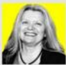
Piše: NINA OŽEGOVIĆ

Kockica, uzdignuta na jednaku visinu kao Savski nasip. Gledano s druge strane tijelo zgrade prividno sjeda na taj horizont riječnog koridora