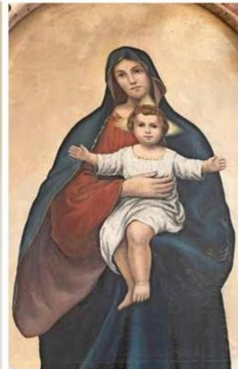
Slike u Šibeniku i Žirju uklapaju se u potpunosti stilski u akademski izraz oca i sina Natalea i Felicea Schiavona, koji se naslanjao na tada u Europi izuzetno popularno Rafaelovo slikarstvo. Utjecaji Rafaela i venecijanskih slikara prepoznaju se i na Feliceovoj potpisanoj slici svetog Josipa s Djetetom iz šibenske crkve svetog Frane

» podigla tadašnja "vlada" (kako 1941. piše don Krsto Stošić ) 1856. godine. Današnju, novu, veliku crkvu posvetio je 9. lipnja 1907. godine šibenski biskup, Vinko Puljić (1903. – 1910.). Oltarna slika o kojoj je riječ, Bezgrešno Začete, potječe iz starije crkve, koja se nalazila na mjestu današnje crkve.